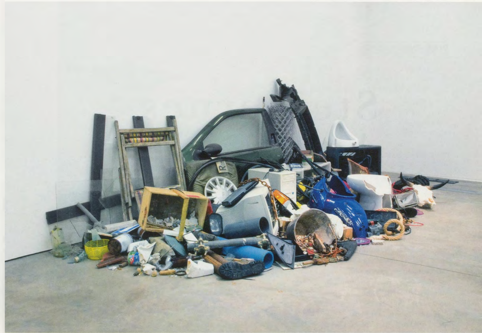
JIMMIE DURHAM, LA STRADA DI ROMA , 2011, installation view / DIE STRASSE ROMS , Installationsansicht.