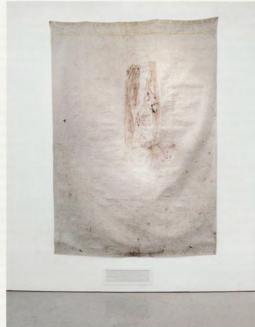
JIMMIE DURHAM, EARTH AND HAIR AND COTTON, 1996, earth, hair, cotton / ERDE UND HAAR UND BAUMWOLLE, Erde, Haare, Baumwolle.

In seinen Untersuchungen zur Architektur des Körpers und der unkontrollierbaren, exzessiven, pulsierenden und letztlich undurchdringlichen Natur des organisch Abjekten versucht Durham die Grenzen einer sich selbst relativierenden und negierenden Identität noch deutlicher vor Augen zu führen. In Arbeiten wie EARTH AND HAIR AND COTTON (Erde und Haar auf Baumwolle, 1996) werden Textilien in Graphit, modrigen Flüssigkeiten und anderen Ablagerungen getränkt und anschliessend gegen Oberflächen geschlagen (Leinwand, Papier oder eine Wand). Die Muster und Spuren, die diese Abdrücke hinterlassen, entziehen sich wie das Abjekte per definitionem jeder Form von Repräsentation. Sie