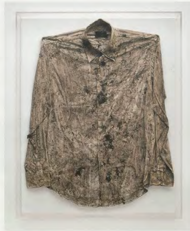
JIMMIE DURHAM, LA LEÇON D'ANATOMIE N°3, 1996, hair and dirt on cotton, 31 7/8 x 25 3/8 x 3/8" / DIE ANATOMIESTUNDE NR. 3, Haar und Schmutz auf Leinwand, 81 x 65 x 1 cm.

Eine ähnliche Zielsetzung wird auch in anderen kumulativen Arbeiten sichtbar: ONE THOUSAND BEAUTIFUL THINGS (Tausend schöne Dinge, 2004), einer Ansammlung von Abfällen unter der Haupttreppe des Sydney Museum of Contemporary Art, entstanden für die Biennale 2004, und LA STRADA DI ROMA (2011), einem Geröllhaufen, der unter anderem aus einer Autotür, Plastikteilen von alten Computern, einem Schädel und als augenzwinkerndes Zitat einem umgekehrten Urinal besteht. Die Bestandteile mögen aus den Zirkulationsbeziehungen herausgefallen sein, dennoch behalten sie ihre volle Identität, selbst wenn diese Identität im Raum der Repräsentation an den Rand der Marginalität gerät.