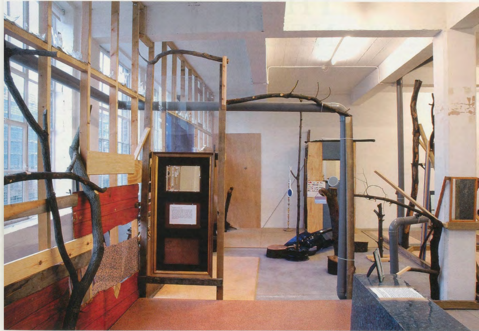
JIMMIE DURHAM, BUILDING A NATION, 2006, installation views / EINE NATION AUFBAUEN, Installationsansichten.