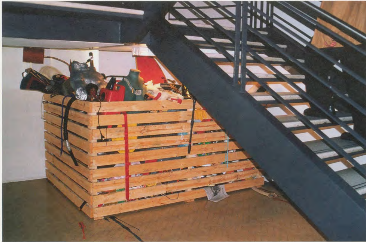
JIMMIE DURHAM, ONE THOUSAND BEAUTIFUL THINGS, 2004,

installation view Sidney Museum of Contemporary Art / TAUSEND SCHÖNE DINGE, Installationsansicht.