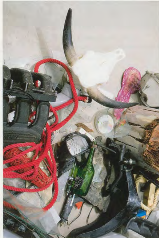
JIMMIE DURHAM, LA STRADA DI ROMA , 2011, details / DIE STRASSE ROMS , Details.