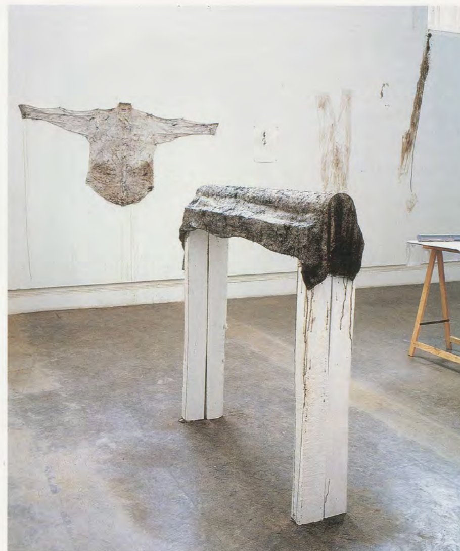
JIMMIE DURHAM, LA LEÇON D'ANATOMIE (A PROGRESS REPORT), 1996, installation view / ANATOMIESTUNDE (EINE BESTANDESAUFNAHME), Installationsansicht.

Sein ganzes Schaffen hindurch hat Durham an der Dekonstruktion von Sprache und Architektur gearbeitet – zwei Medien, die ihm zufolge wesentlich Macht und Autorität repräsentieren. Eines seiner bevorzugten Materialien ist natürlich Stein, den er paradoxerweise dazu einsetzt, um alles Starre, Gefestigte, Monumentale aufzuheben. «Ich versuche Kunst zu machen, die nicht mit Metaphern zusammenhängt», hat er einmal gesagt, «die nicht mit diesem deskriptiven, metaphorischen, architektonischen Gewicht belastet ist ... Ich möchte andere Dinge mit Stein machen, den Stein leicht machen, von seinem metaphorischen Gewicht, seinem architektonischen Gewicht befreien. Deshalb habe ich über andere Möglichkeiten, mit Stein zu arbeiten, nachgedacht, den Stein in Bewegung zu versetzen, statt ihn zu einem architektonischen Element zu machen.» 2) So etwa in SMASHING (Zerschlagen, 2004), dem Video einer Performance in der Fondazione Ratti in Como. Durham sitzt frontal hinter einem breiten Büromöbel, hübsch ordentlich in Krawatte und Anzug, und empfängt die Besucher, die ein-