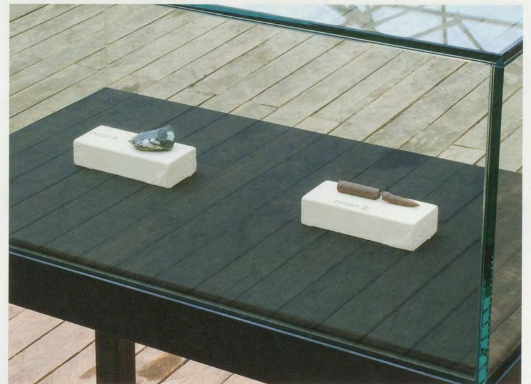
JIMMIE DURHAM, HISTORY OF EUROPE, installation view, Documenta 2012 / GESCHICHTE EUROPAS, Installationsansicht.