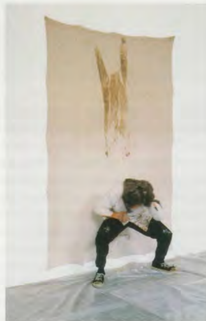
JIMMIE DURHAM, LA LEÇON D'ANATOMIE (A PROGRESS REPORT), 1996, installing the exhibition / ANATOMIESTUNDE (EINE BESTANDESAUFNAHME), Einrichten der Ausstellung.