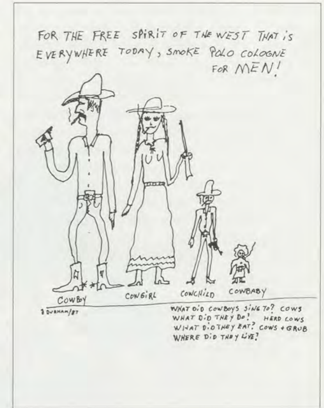
JIMMIE DURHAM, COWBOY FAMILY, 2006,