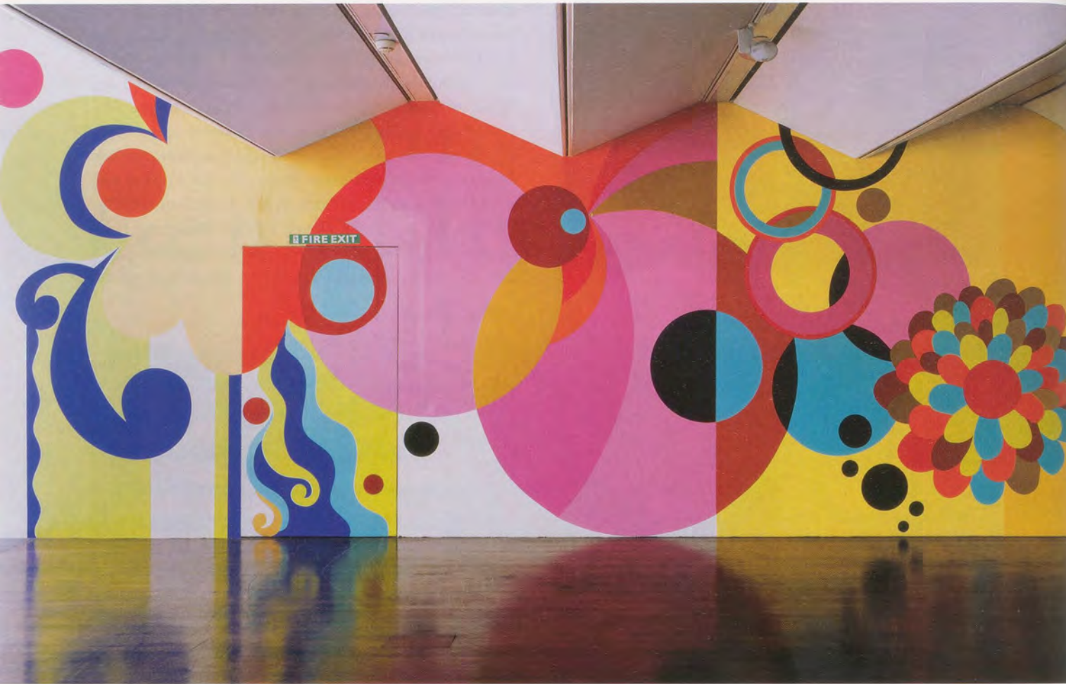
BEATRIZ MILHAZES, GUANABARA, 2005, Tate Modern Restaurant Project, London / Projekt Restaurant Tate Modern.

zierter – auch wenn diese «reduzierten» Formen in den Augen vieler anderer Maler noch immer masslos übersteigert sein dürften. Das Ergebnis war jedenfalls eine grössere Frische, die Farben waren Pop-artiger; man war eher an Pucci und Lichtenstein erinnert als an Retablos und das Barock. In den letzten Jahren sind die Gemälde noch dichter geworden. Kannten ihre wirbelnden Kreisformen in früheren Jahren keinen anderen geradlinigen Widerstand als den des Rahmens, so steht ihnen jetzt eine aus Gittern und Stäben zusammengesetzte Matrix gegenüber. Auch wenn die Streifen oft wellig sind, ihre grundsätzlich geraden Wege sind nie in Frage gestellt. Die daraus