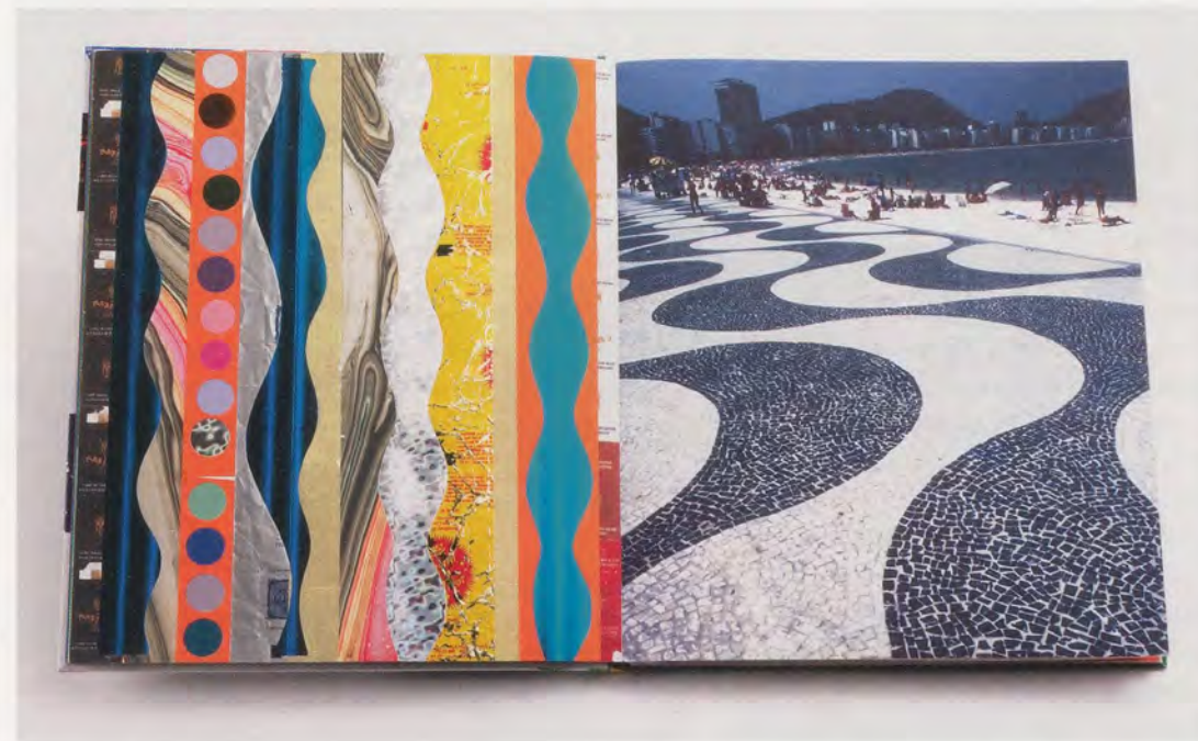
BEATRIZ MILHAZES, Meu Bem, My Darling / Mein Schatz , 2008.

of her work and open it up to possibilities as yet unelaborated in her paintings. Coisa Linda (Something Beautiful) was published in 2002 by The Museum of Modern Art, New York. Its text consists of a dozen lyrics by three generations of Brazilian songwriters—the bossa nova of the late-fifties and early-sixties, the Tropicália of the late-sixties and early-seventies, and finally a third generation, closer to the painter's own, which is given no official name. As with any good livre d'artiste , what the artist has done here is neither a presentation of the text nor an illustration of it, but an interpretation of it—one might almost say a performance or perhaps an orchestration of it. And if it seems strange to accord to pop song lyrics the kind of