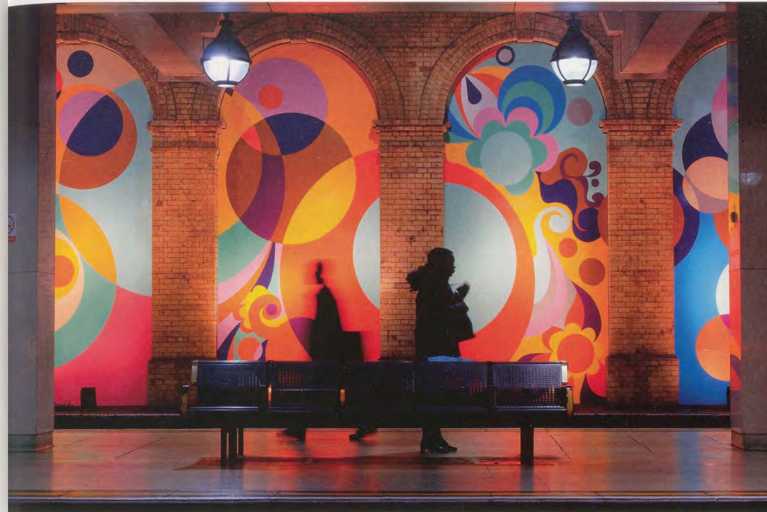
BEATRIZ MILHAZES, PEACE AND LOVE , 2005, Gloucester Road Station Project Platform for Art Underground, London / Friede und Liebe , Projekt für eine U-Bahn-Station.

“I do not distinguish between the construction of a book and that of a painting,” wrote Matisse, and “I always proceed from the simple to the complex, yet I am always ready to reconceive in simplicity.” 5) This path, from the simple to the complex and above all back again, is likewise that of Milhazes. Looking back over reproductions of her paintings from the time when I first saw them in the mid-nineties—already a decade after she first began exhibiting in Brazil—I am struck by how much more abstract her paintings have become, how much more concise, even blunt, they are now, and perhaps less seductive as well. And