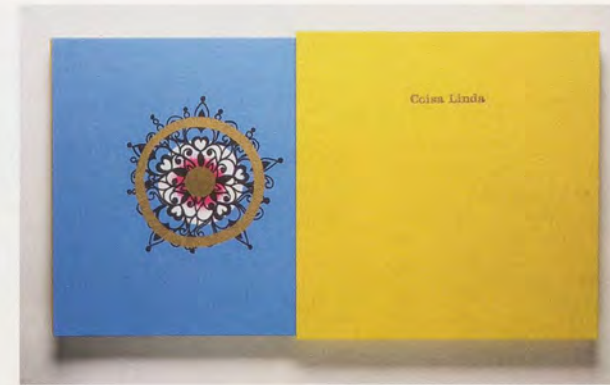
BEATRIZ MILHAZES, Coisa Linda, Something Beautiful / Etwas Schönes , 2002.

abstrakt gewesen zu sein scheinen, ungeachtet ihrer Verweise auf die Rüschen und Spitzen, die sich in der Porträtmalerei des Barock wie Weinreben ausbreiten. Irgendwie machten die leuchtenden Farben der Bilder mit der Zeit einen leicht schmutzigen Eindruck, wie die ein wenig in die Jahre gekommenen Wände in einer tropischen Stadt. Die historischen Resonanzen in Milhazes' Mitte der 90er-Jahre entstandenem Werk schienen ihren Ursprung eher in Mexiko als in ihrem eigenen brasilianischen Erbe zu haben. Zu Beginn des jetzigen Jahrzehnts waren ihre Formen weniger detailliert geworden, redu-