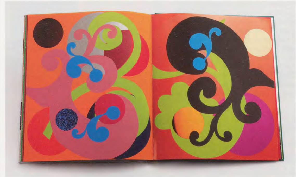
BEATRIZ MILHAZES, Meu Bem, My Darling / Mein Schatz, 2008.