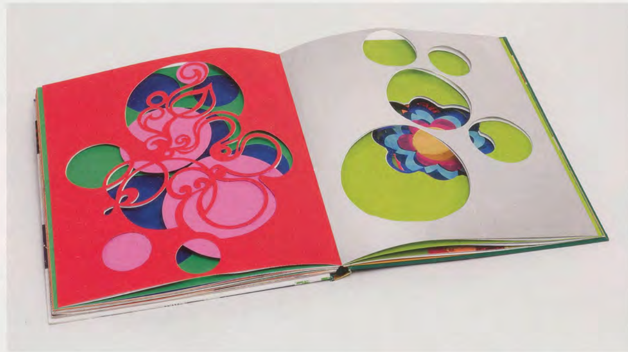
BEATRIZ MILHAZES, Meu Bem, My Darling / Mein Schatz , 2008.

that of Léger, with his overt monumentality, than of Picasso and Braque).