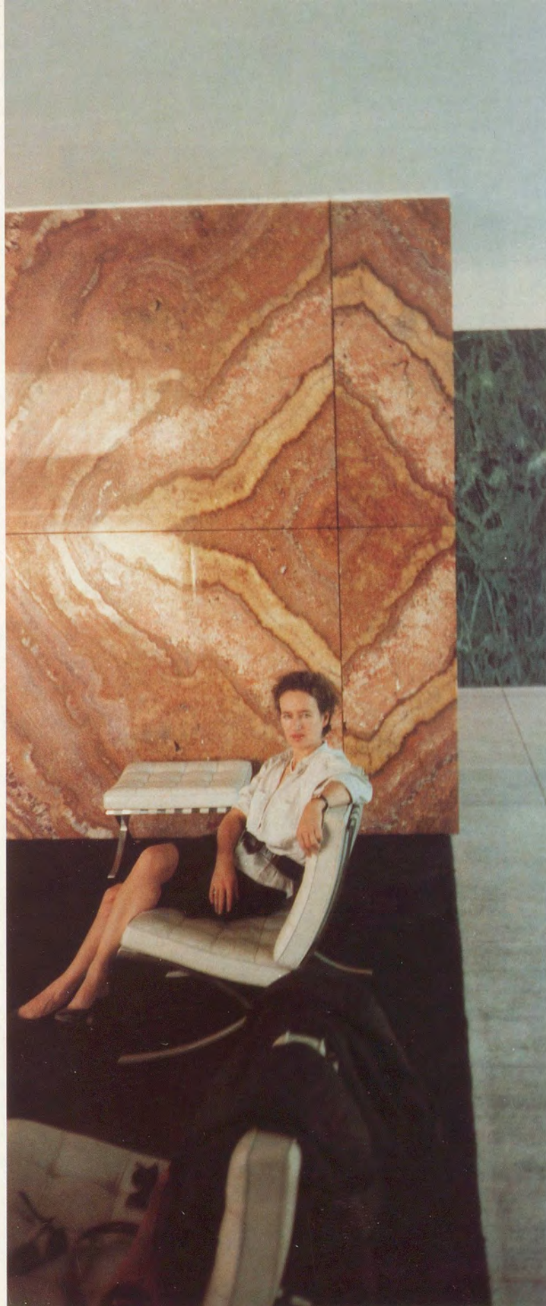
GÜNTHER FÖRG, BARCELONA PAVILLON, 1988, color photograph, 270 x 120 cm / 106 x 47".