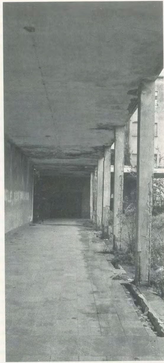
GÜNTHER FÖRG, COLONIA «28 OTTOBRE», MARINA DI MASSA, 1986, Schwarz/Weiss-Photographie, je 270 x 120 cm / 106 1 / 4 x 47 1 / 4 '' each.