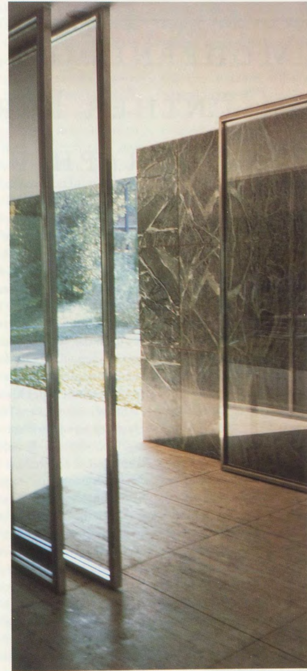
GÜNTHER FÖRG, BARCELONA PAVILLON, 1988, color photograph, 270 x 120 cm / 106 x 47".