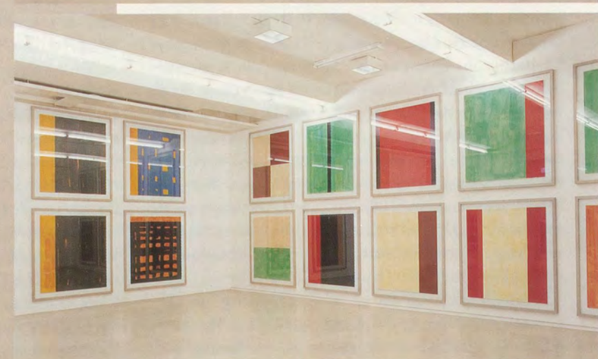
AUSSTELLUNG / EXHIBITION GÜNTHER FÖRG, MUSEUM FRIDERICIANUM KASSEL, 7. 10. - 16. 12. 1990.