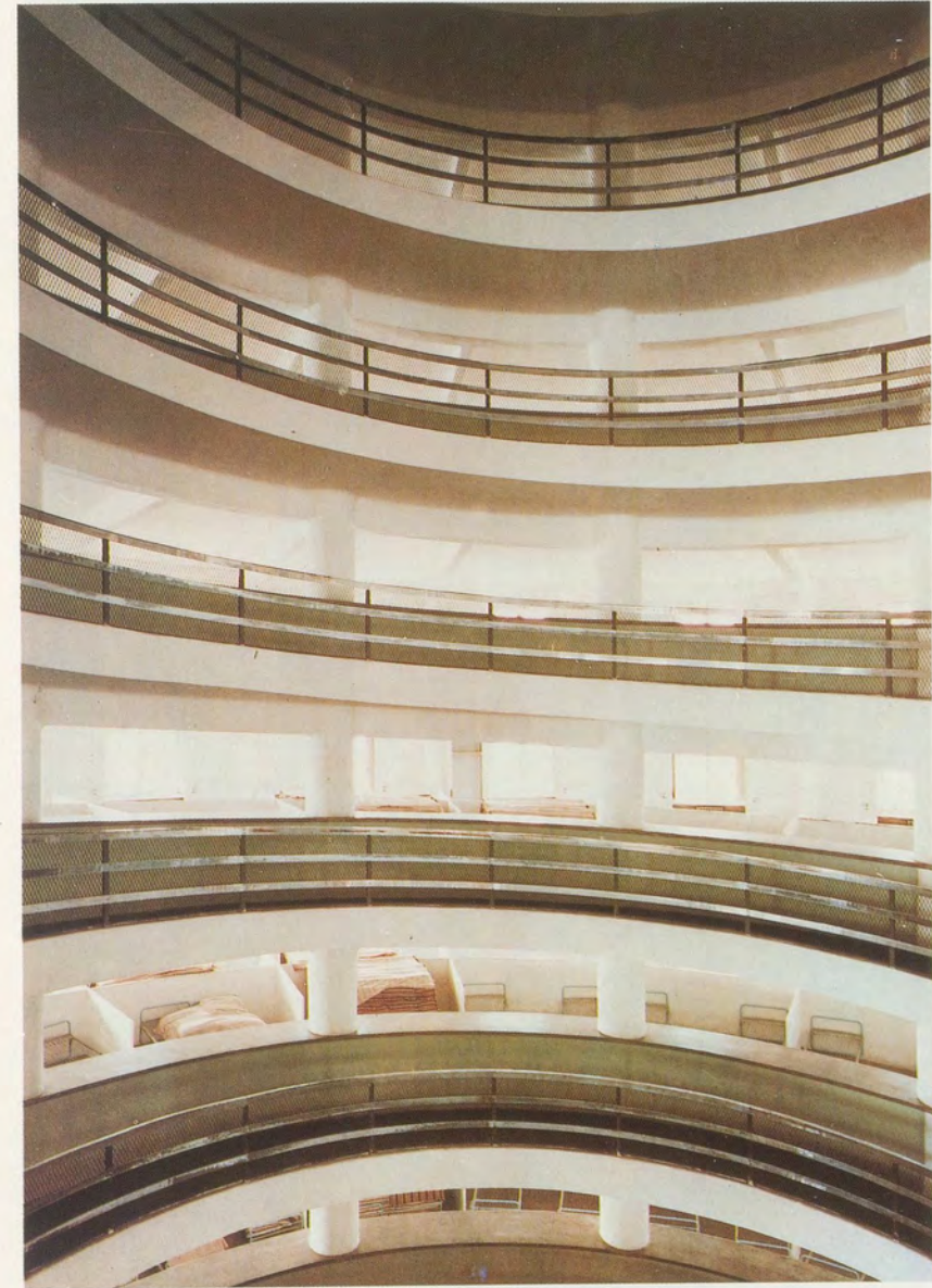
GÜNTHER FÖRG, KINDERHEIM, TURIN, 1986, Farbphotographie, 270 x 180 cm / CHILDREN'S HOME, TORINO, 1986, colorphotograph, 106 1 / 4 x 70 7 / 8 ''.