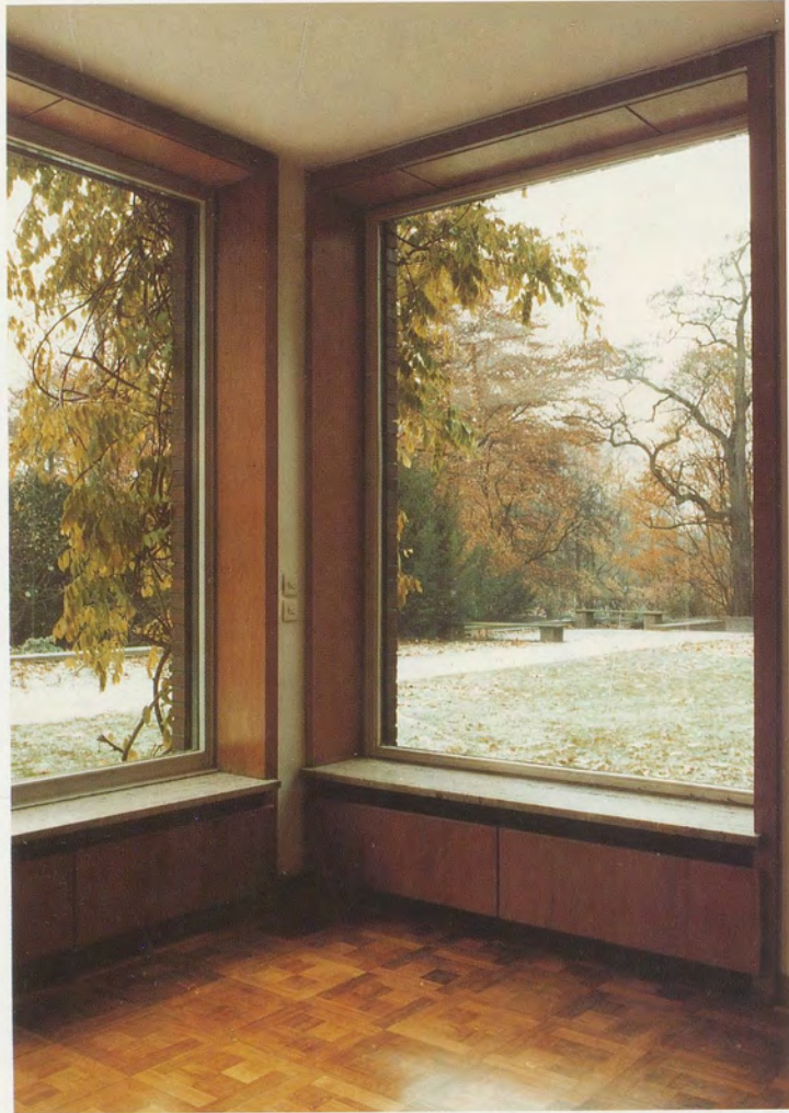
GÜNTHER FÖRG, HAUS LANGE, KREFELD, 1985, Farbphotographie, 270 x 180 cm / color photograph 106 1/4 x 70 7/8".