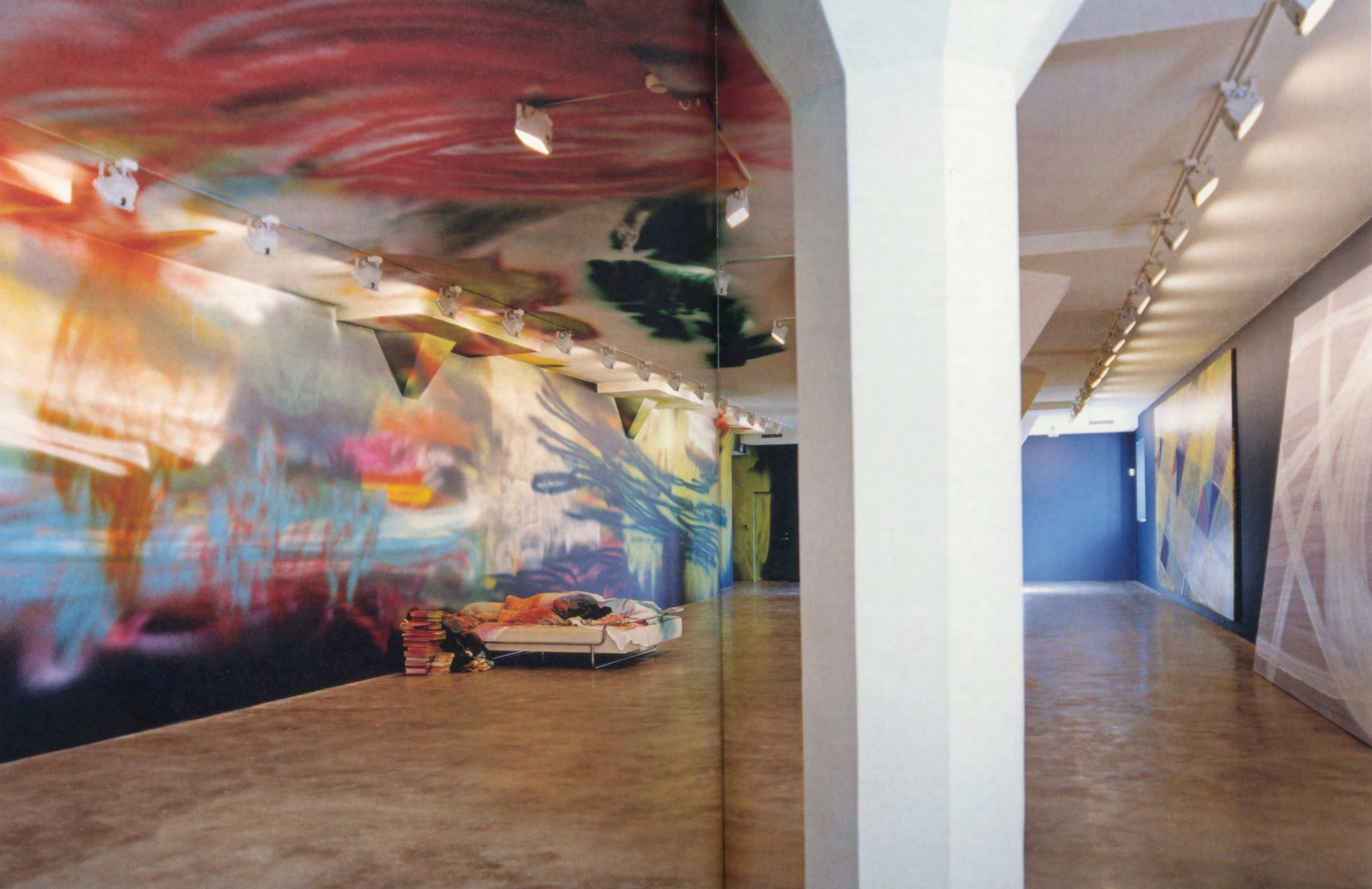
KATHARINA GROSSE, INFINITE LOGIC CONFERENCE, 2004, acrylic on wall, floor, bed, bedcover, books, and clothes, Magasin 3 Stockholm Konsthall, Stockholm, 152 3/4 x 984 1/4 x 322 7/8" / Acryl auf Wand, Boden, Bett, Decke, Bücher und Kleidung, 388 x 2500 x 820 cm.