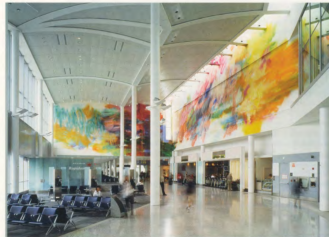
KATHARINA GROSSE, UNTITLED, 2003, acrylic on wall, Pearson International Airport, Toronto, 348 7/16 x 689 x 925 3/8" / Acryl auf Wand, 885 x 1750 x 2350 cm.