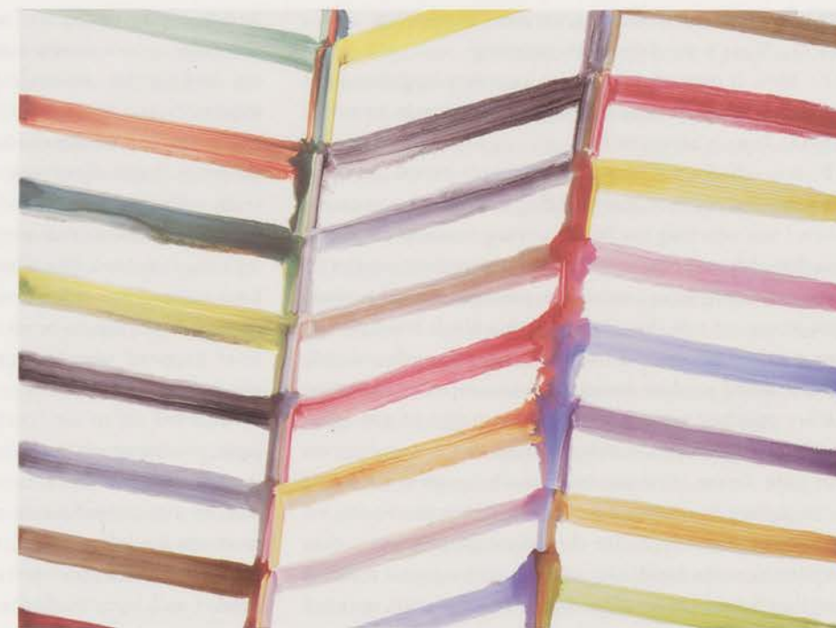
BERNARD FRIZE, ILLUSTRATION , 1998, acrylic and resin on canvas, 59 x 78 3 / 4 " / Acryl und Kunstharz auf Leinwand, 150 x 200 cm.

last paintings, which look a little like curtains, I used a similar principle: as always, it is a question of mixing the colors on the canvas and here the result is a mottled color. I do not make a particular choice in the beginning: for example, these paintings were made with the same colors and the result is completely different. I am quite negligent with regard to the skill of painting in general. I use very ordinary procedures, without any savoir faire. As a matter of fact, the collaborators who help me are not painters at all.