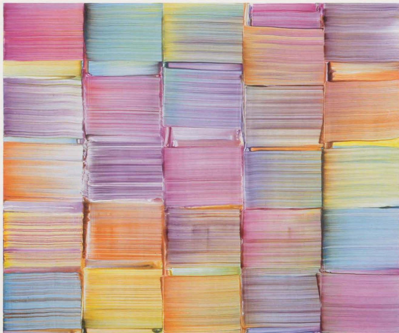
BERNARD FRIZE, AUNNO, 2003, acrylic and resin on canvas, 88 9 / 16 x 106 5 / 16 " / Acryl und Kunstharz auf Leinwand, 225 x 270 cm.

Kombinationen zum Scheitern oder Gelingen kommt.