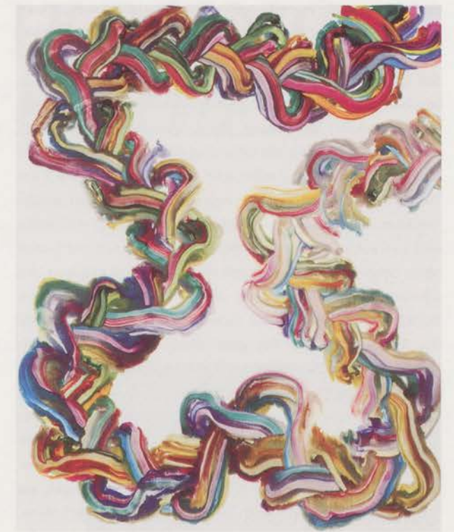
BERNARD FRIZE, PALACE, 2000, acrylic and resin on canvas, 86 3 / 8 x 70 7 / 8 "/ Acryl und Kunstharz auf Leinwand, 220 x 180 cm.

Vor rund zehn Jahren hat ein Mathematiker namens Szilassi eine einfachere, viel geometrischere Lösung für diese Karte gefunden. Und ich denke, während Heawood seine Karte gegen Ende des neunzehnten Jahrhunderts auf empirische Weise anfertigte, hat Szilassi natürlich den Computer verwendet. Schau dir dieses Buch an über die Récréations Mathématiques de la librairie technique Albert Blanchard . Es gibt mehrere Bände davon, die diverse mathematische Probleme behandeln. Zum Beispiel, das Problem der Königsberger Brücken, bei dem es darum geht, einen Weg durch die Stadt zu finden ohne zweimal dieselbe Brücke zu überqueren. Oder die Logik der Verwandtschaftsbeziehungen. Das sind Dinge, die ich immer wieder in meiner Arbeit verwende. Oft erstelle ich Diagramme, um nicht dieselben Farben zu verwenden oder aber die Wiederholung der Farben gerade zu provozieren. Solche Quellen aus dem Bereich der Logik hab ich angezapft um zu Lösungen zu kommen.