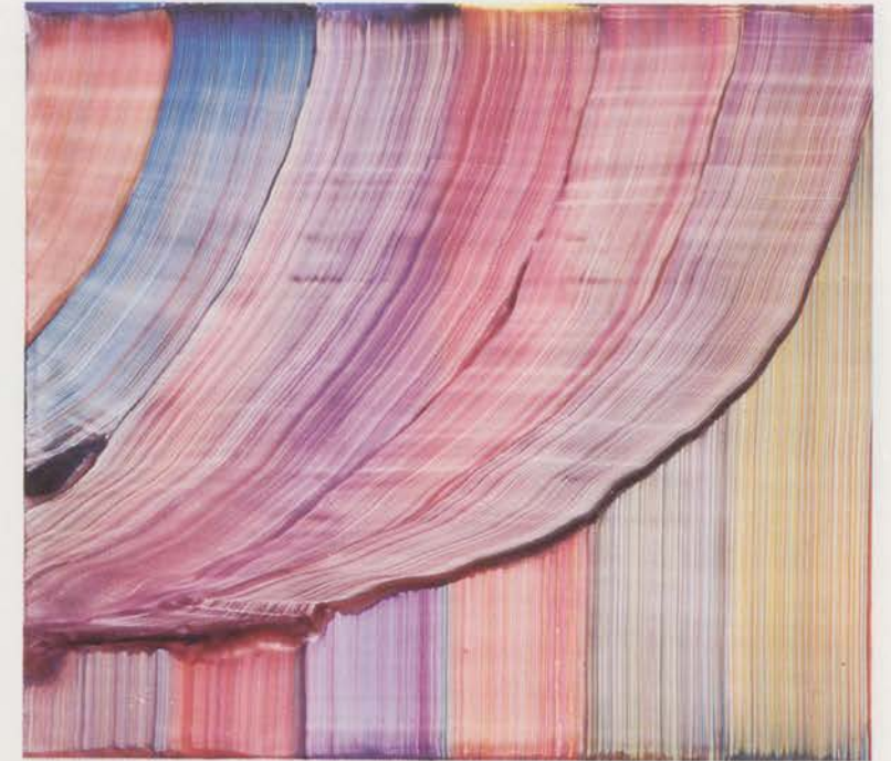
BERNARD FRIZE, MEROTOM, 2003, acrylic and resin on canvas, 63 x 70 1/8" / Acryl und Kunstharz auf Leinwand, 160 x 180 cm.

BF: Nein, das Einzige, was dem vielleicht entspricht, ist die grosse Zahl von Bildern, die wir produzieren, manchmal innert nur fünf Minuten. Aber viele sind natürlich unbrauchbar. Dieselben Prozeduren, dieselben Farben – wir bereiten jeweils die Farben für eine ganze Woche oder mehrere Sitzungen vor – erlauben eine grosse Vielfalt und ein ebenso gründliches Abwägen, wie es mit denselben