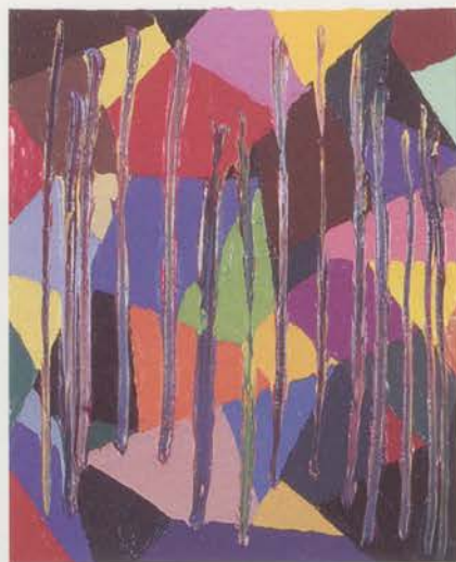
BERNARD FRIZE, SIMPLETON , 2002, acrylic and resin on canvas, 28 3 / 4 x 23 5 / 8 " / SIMPEL , Acryl und Kunstharz auf Leinwand, 73 x 60 cm.