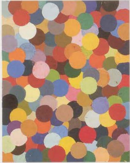
BERNARD FRIZE, SUITE SECONDE STRN30F100, 1980, alkyd urethane lacquer on canvas, 36 1/4 x 28 3/4" / Alkydurethan-Lack auf Leinwand, 92 x 73 cm.