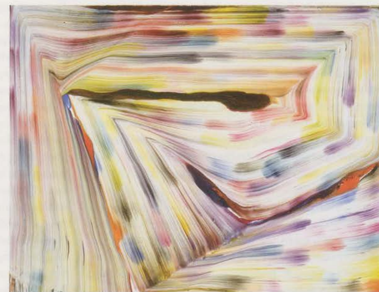
BERNARD FRIZE, CONDUCTEUR B , 2001, acrylic and resin on canvas, 35 x 45 1/2" / Acryl und Kunstharz auf Leinwand, 89 x 115,5 cm.

H U O: That's what Raymond Hains calls a "personified abstraction."