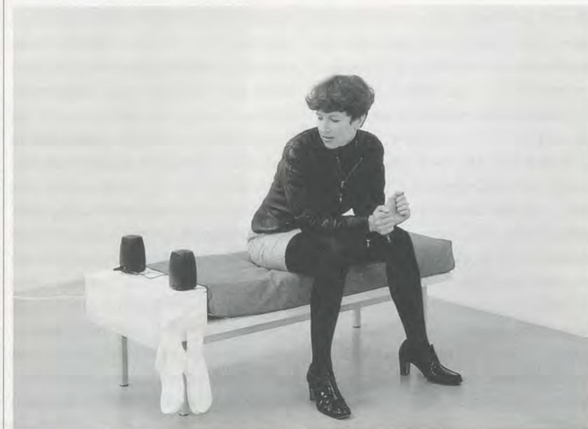
ANGELA BULLOCH, FORMATION DANCING BENCH (VIRTUAL HMMM), 1996, bench, cushion, socks, walkman, loudspeaker system, sound tape, electronic equipment, 57 x 17¾ x 18½" / FORMATIONSTANZ-BANK (VIRTUELLES HMMM), Bank, Kissen, Socken, Walkman, Lautsprecher, Tonkassette, div. Elektronik, 145 x 45 x 47 cm.

AB: So far I've projected a new name onto it. As there is no public access to it, I would like to permanently install one work to be remote-controlled by people on the shore. I've thought of other events as well. It should be a platform for art.