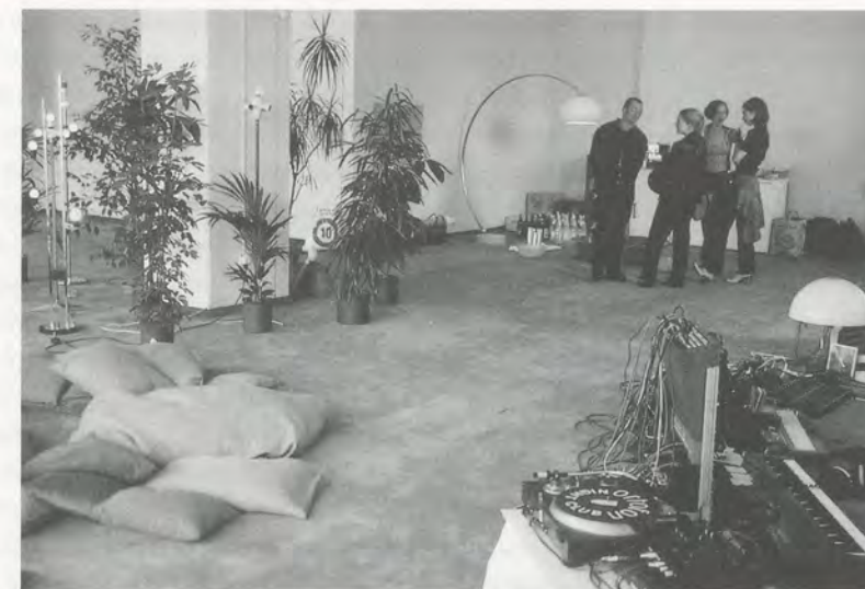
Kombirama, Zurich, July 1996.

things like you were; another I'm just starting to be involved with is a kind of women's group (which was mostly full of men at the first meeting). Another important occurrence is less formal, more social meetings of a group of friends centred around an event of some kind—like showing someone's videos or going to some music perfor-