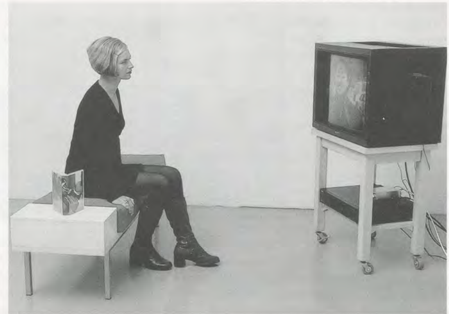
ANGELA BULLOCH, AUDIO VIDEO TECHNO BENCH (JOSO NEW TOWN), 1996, bench, cushion, monitor, video tape and electronic equipment, 57 x 17¼ x 18½" / Bank, Kissens, Monitor, Videoband, diverse Elektronik, 145 x 45 x 47 cm.

AB: Ja, Snow Crash ist momentan mein liebstes Science-fiction-Buch, aber das kann mit der Zeit ändern, die Bücher können gegen andere ausgetauscht werden. Das Video dagegen