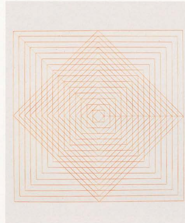
CAROL BOVE, ORANGE MANDALA, 2003, thread, pins, 30 x 30" / ORANGES MANDALA, Faden, Stecknadeln, 76,2 x 76,2 cm.

CB: Ja. Mich erinnert es auch daran, wie wichtig Craig Owens' Essay «The Allegorical Impulse: Toward a