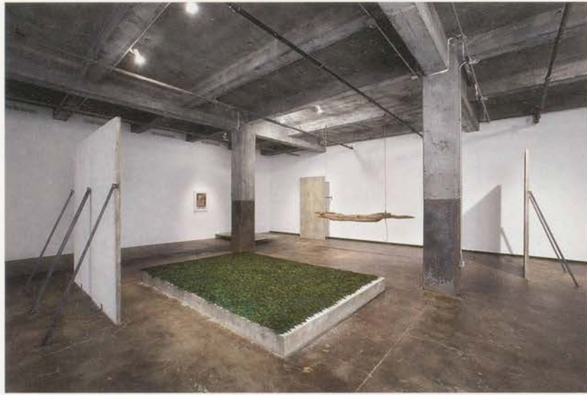
CAROL BOVE, "The Middle Pillar," 2007, exhibition view, Maccarone Gallery, New York, mixed media, including a collage by Bruce Conner, dimensions variable / Der mittlere Pfeiler, Ausstellungsansicht, verschiedene Materialien, mit einer Collage von Bruce Conner, Masse variabel.

geln, Parameter, welche die künstlerische Arbeit leiten, sind die Architektur, die dem Impuls ermöglicht Gestalt anzunehmen. Der Impuls ist das Ursprüngliche, aber ohne die Begrenzung durch Regeln bleibt er ein ungestaltetes Durcheinander. Ich muss dabei an die universalen Prinzipien von Ausdehnung und Verdichtung denken.