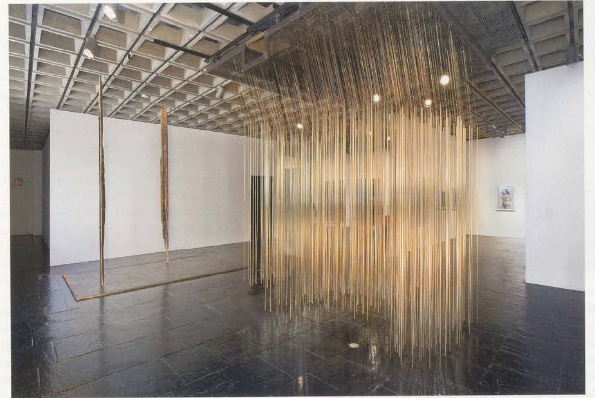
CAROL BOVE, from left to right, FIELD FIGURES , 2008, steel, driftwood, 156 x 132 x 84", THE NIGHT SKY OVER NEW YORK, OCTOBER 21, 2007 , steel, bronze, 168 x 144 x 96", exhibition view Whitney Biennial, 2008 / FELDFIGUREN , Stahl, Treibholz, 396 x 335 x 213 cm / DER NACHTHIMMEL ÜBER NEW YORK, 21. OKTOBER , Stahl, Bronze, 1006 x 851 x 541 cm, Ausstellungsansicht.

BETTINA FUNCKE ist Redaktorin von Parkett in New York.