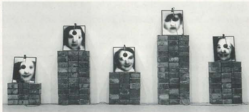
CHRISTIAN BOLTANSKI, MONUMENT (LA FÊTE DE POURIM), 1989, 220 x 540 x 23 cm / 86 1/2 x 212 x 9". (PHOTO: ADAM RZEPEKA)

job. I do it for myself, to understand, but it is also to give to people, even knowing that I am bound to the art world, vain and ambitious. Aren't all preachers like that?