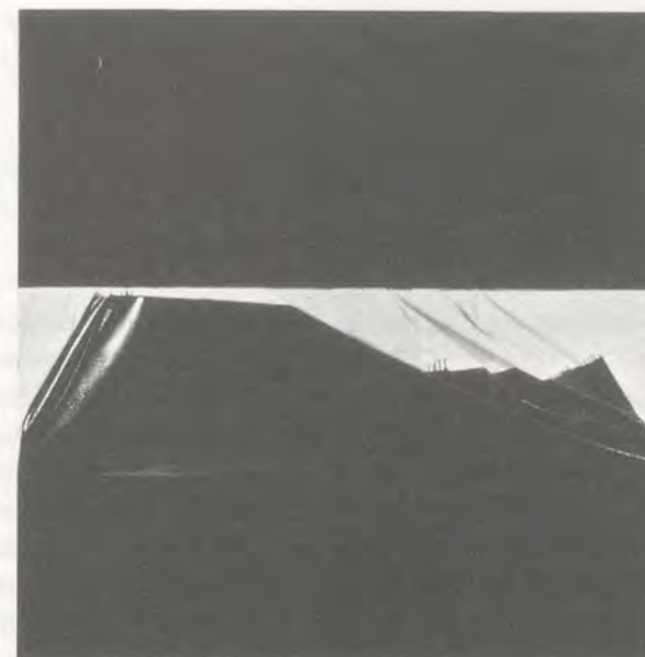
STEVEN PARRINO, KITTEN NATIVIDAD, 1991, enamel paint on canvas, 84 x 84" / Lackfarbe auf Leinwand, 213,4 x 213,4 cm.

down with history, and America as total substance with disposable history, even if American substance is violence, sex and stupidity." 2) Recently, Steven joked about the fact that in 1985 he was included in a group show titled "Smart Art" 3) and, in 1992, in another, titled "Dumb Painting," 4) only to end up a few years later in "Ca-Ca-Poo-Poo." 5) Yet, even as he doused some of his paintings with a gooey silicon gel or chainsawed previous works into a pile of junk, the work had nothing to do with abjection, striving instead to reach a kind of stark necromantic elegance. Unlike Mike Kelley (alongside whom he exhibited in "Ca-Ca-Poo-Poo"), Parrino never claimed to unearth the repressed, psycho-cultural impulses of American culture. His exploitation of culture, whether high or low, was much less humanistic than that of his Californian counterparts. And much much more lively. Although his works made direct use of biker culture, Russ Meyer and George Romero anti-establishment cinema, and Ed "Big Daddy"