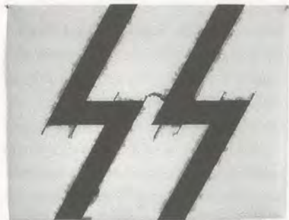
STEVEN PARRINO, UNTITLED, 1992, engine enamel spray on vellum / Maschinenlackspray auf Segeltuch.

Radikalität folgt aus dem Inhalt und nicht notwendig aus der Form. Die Formen sind in der Erinnerung radikal, indem sie das einst Radikale in seinen geschichtlichen Ausläufern fortsetzen. Die Avantgarde entwickelt in ihrem Kielwasser einen Sog und bewegt sich durch eine manieristische Kraft weiter vorwärts. Selbst wenn wir voranstürmen, werfen wir manchmal einen Blick über die Schulter zurück und nähern uns der Kunst mehr intuitiv als strategisch. Solche Kunst ist eher Kult denn Kultur. 1)