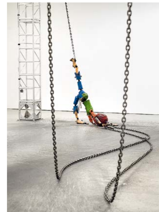
JORDAN WOLFSON, COLORED SCULPTURE , 2016, mixed media, variable dimensions / FARBIGE SKULPTUR , verschiedene Materialien, Masse variabel.

ANDREW RUSSETH is an art critic based in New York and co-executive editor of ARTnews .