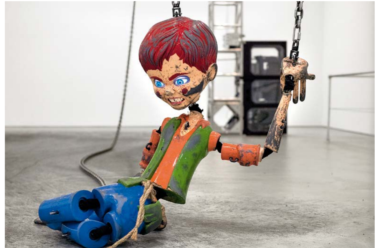
JORDAN WOLFSON, COLORED SCULPTURE, 2016, mixed media, variable dimensions / FARBIGE SKULPTUR, verschiedene Materialien, Masse variabel.

been up all night, tryna get that rich», rappt sie in ihrer charismatisch fauchenden Art. «I've been work, work, work, work, working on my shit» – eine Zeile, die zugleich auf einen geradezu zwanghaften Stolz auf ihre Kunst und auf bahnbrechende Therapieerfolge hindeutet.