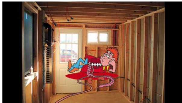
JORDAN WOLFSON, RASPBERRY POSER, 2012, projected video animation, color, sound, 13 min. 54 sec., sound, variable dimensions / HIMBEER-ANGEBER, projizierte Videoanimation, Farbe, Ton, Loop, Masse variabel.

Ein geschundener Tänzer blickt dich aus dem Spiegel an. Der gefesselte Bursche starrt dich nieder. Andere schauen dir in Videos direkt in die Augen, während sie sich selbst ausweiden, lasziv tanzen oder verstohlen flüstern. Sie schauen dich unverwandt an. Sie wollen eine gewisse Vertrautheit herstellen, bevor sie dir den Rest geben.