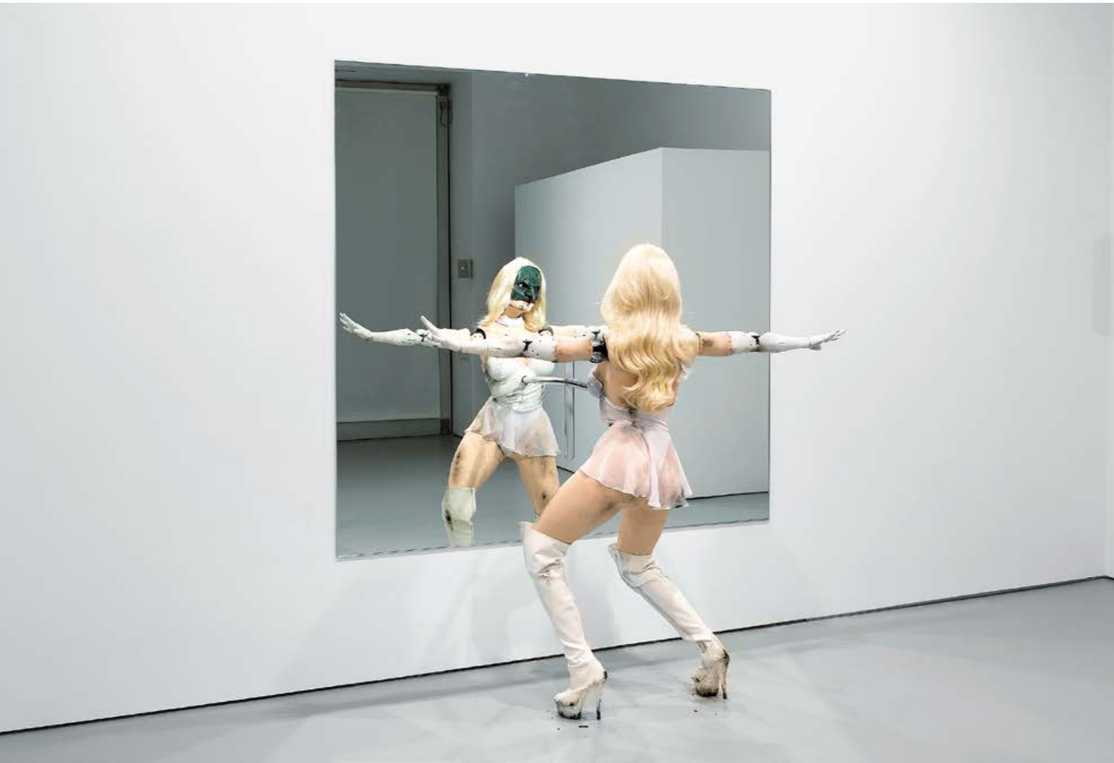
JORDAN WOLFSON, FEMALE FIGURE, 2014, animatronic sculpture, overall 90 1/2 x 72 x 29" / WEIBLICHE FIGUR, animatronische Skulptur, insgesamt 229,9 x 182,9 x 73,7 cm.

aber dennoch abscheulich – geben strafende Worte von sich, während sie sich zigarettenrauchend zurücklehnen, Verkörperungen eines rabenschwarzen Ichs, vielleicht. All diesen Charakteren leiht Wolfson seine eigene Stimme.