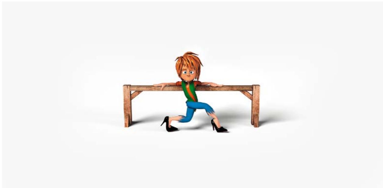
JORDAN WOLFSON, RIVERBOAT SONG, 2017, color, sound, 7 min. 23 sec., loop, variable dimensions / FLUSSKAHN-LIED, Farbe, Ton, Loop, Masse variabel.

was sie ausser sich geraten und in Verwirrung enden lässt. In einer neueren Metallwandkonstruktion UNTITLED (2017, Ohne Titel) hat er eine Karikatur aus der rechten politischen Ecke vergrössert; darauf sind Huma Abedin und Hillary Clinton als böse Hexen zu sehen, wie sie in einem dampfenden Kessel die E-Mails der ehemaligen Staatssekretärin umrühren. In der Originalkarikatur steht Abedins baldiger Ex-Ehemann, der frühere Kongressabgeordnete Anthony Weiner, etwas abseits als Zentaur, der ein Selfie knipst. Es ist ein Bild, das aufs Albernstes an der Realität vorbeischlingert und von Frauenhass und Verfolgungswahn nur so trieft, das Produkt einer Subkultur, die genauso abgeschottet ist wie jene der Hardcore-Bands, deren Namen auf die Lederjacken gekrakelt sind, die an den aus dem Werk ragenden Stangen hängen.