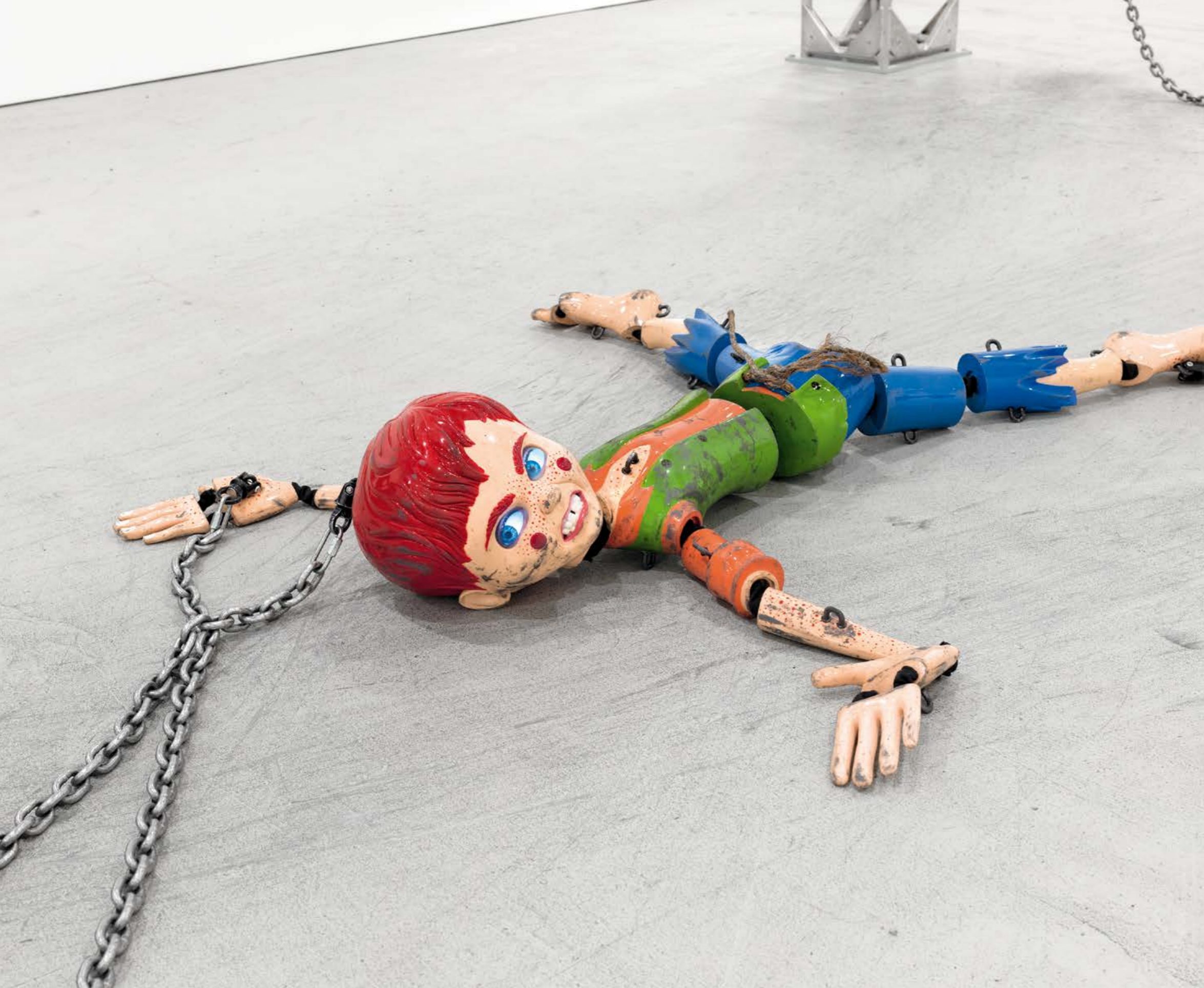
JORDAN WOLFSON, COLORED SCULPTURE , 2016, mixed media, variable dimensions / FARBIGE SKULPTUR , verschiedene Materialien, Masse variabel.

A Huckleberry Finn type is dancing in an empty white space, dressed in Louboutin pumps. You've seen him before—trussed up, under extreme abuse—but here he is more androgynous, more sassy than sinister. Huck is fresh-faced, with no freckles, and he suddenly sprouts breasts and a huge ass, which almost immediately fall from his body. The next moment his face is on the floor, too, and a cartoon witch is stabbing the hell out of it, annihilating whoever that was.