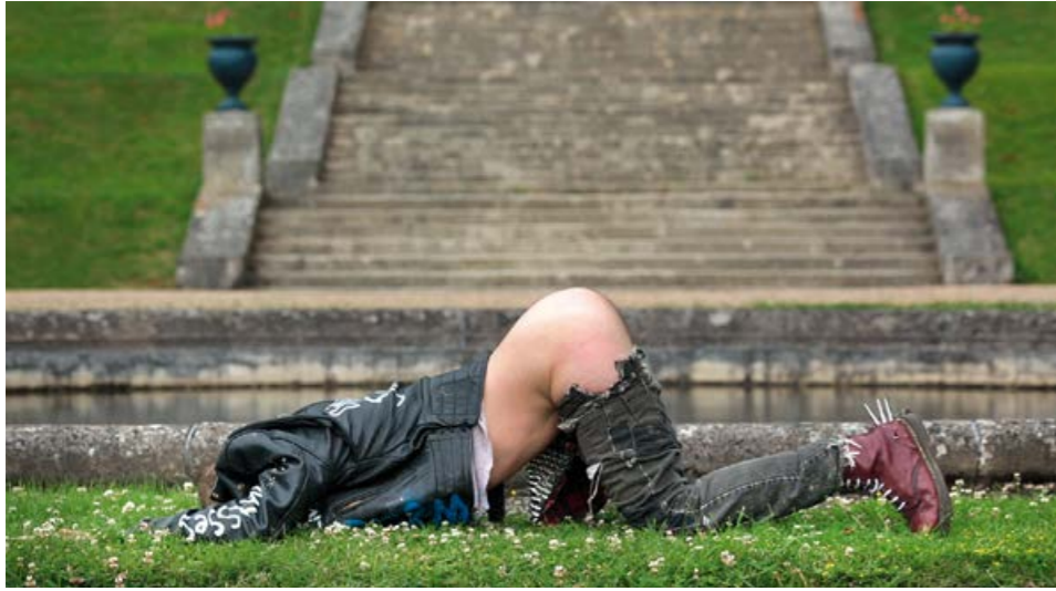
JORDAN WOLFSON, RASPBERRY POSER, 2012, projected video animation, color, sound, 13 min. 54 sec., sound, variable dimensions / HIMBEER-ANGEGER, projizierte Videoanimation, Farbe, Ton, Loop, Masse variabel.

of course, no Jesus, but he is an ur-American figure, with a psychology and worldview riven by all of the racism and violence that is bound up in the foundational myths of the nation. It is only natural that he fondles himself, this digital being creeping toward the human.