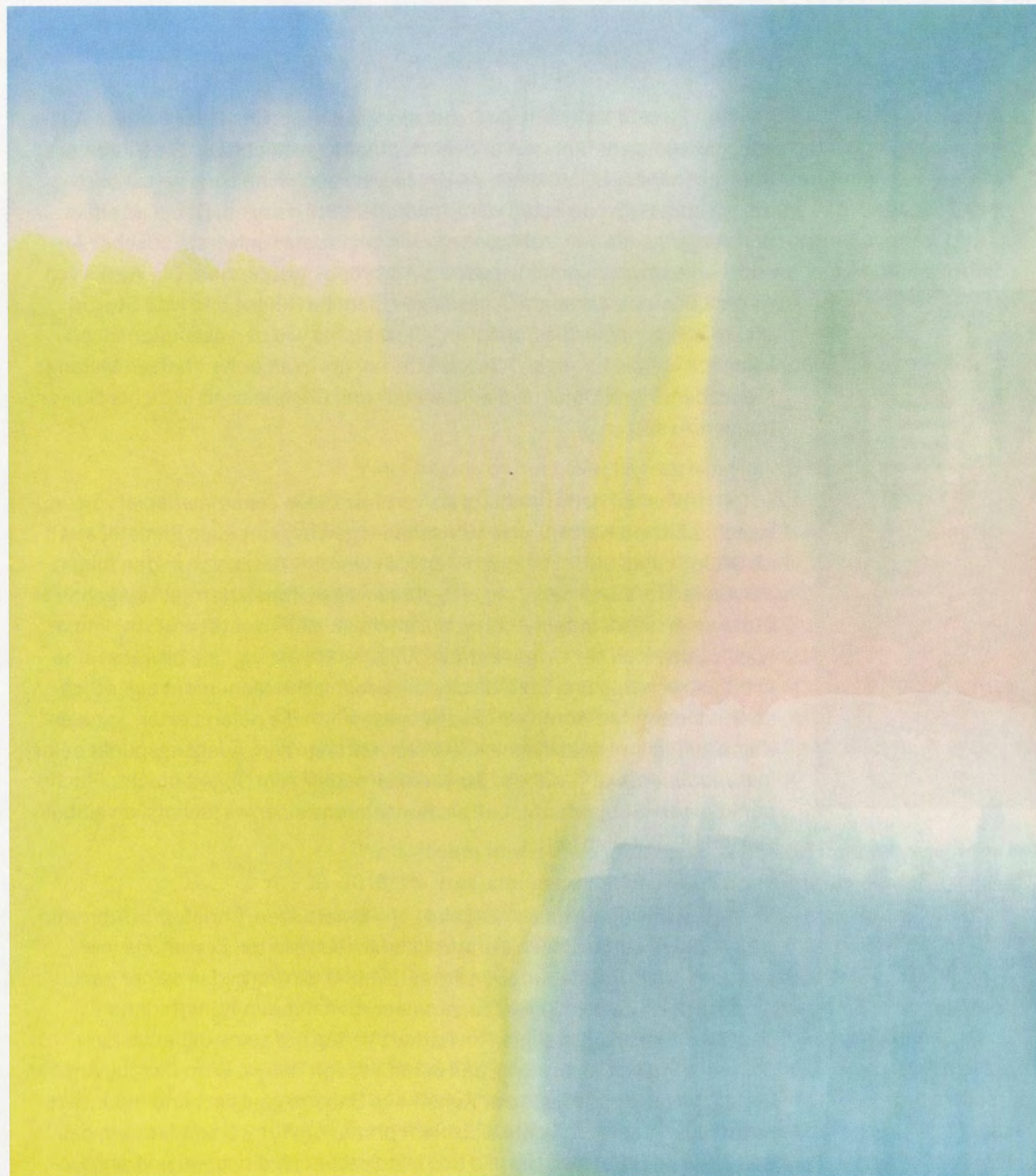
MARKUS DÖBELI, UNTITLED , 2014, acrylic on canvas, 121 1/4 x 107" / OHNE TITEL, Acryl auf Leinwand, 308 x 272 cm.