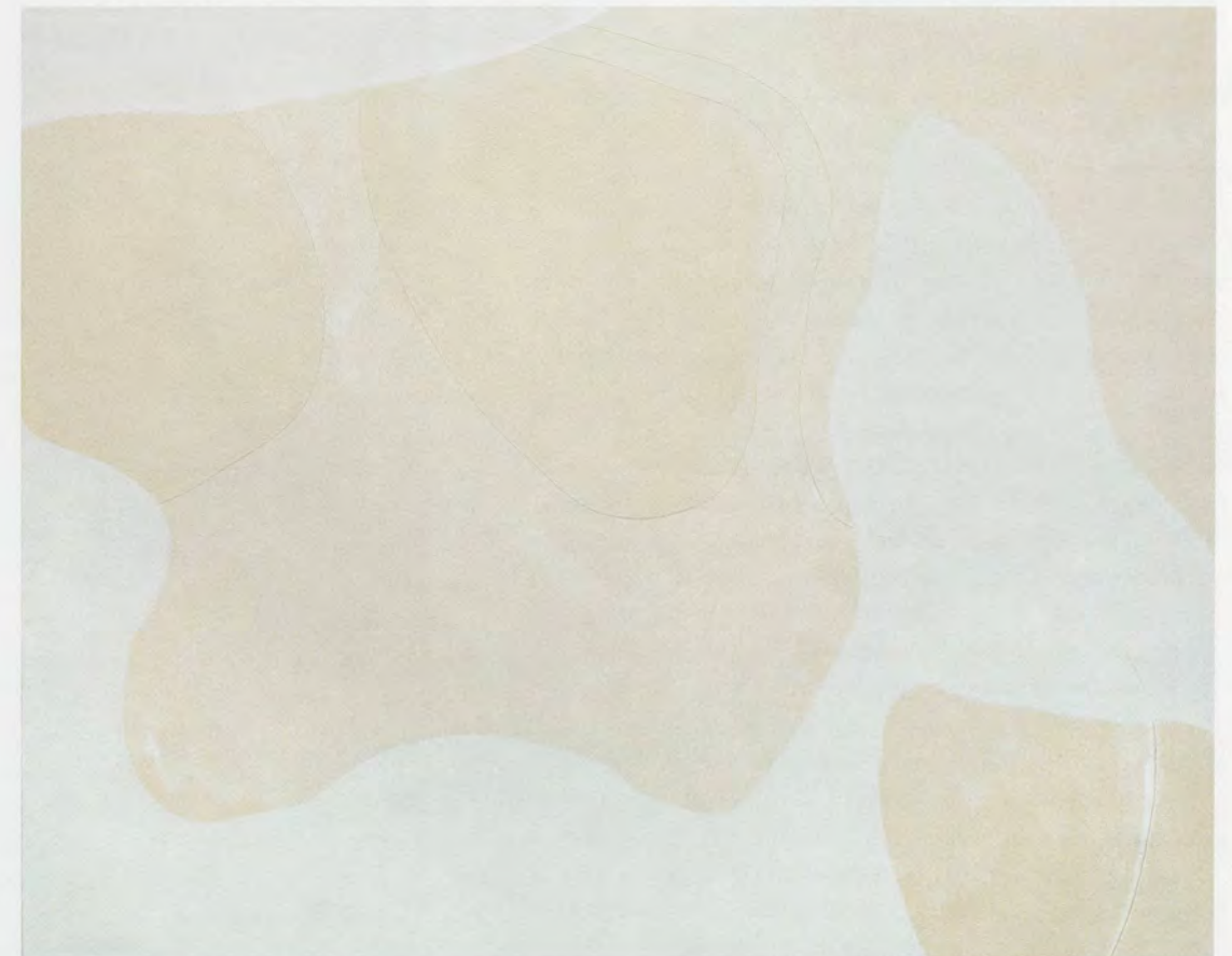
MARKUS DÖBELI, UNTITLED, 1990, acrylic on canvas, 78 3/4 x 98 1/2" / OHNE TITEL, Acryl auf Leinwand, 200 x 250 cm.

Diese affirmative Stellung zum Grundwesen der Malerei ist der Schlüssel zum Kosmos des Künstlers. Döbelis grossformatige, aquarellartige Werke oszillieren zwischen Wand- und Staffeleibild. Wenn man meint, sie wären nahe daran, die Wandflächen, an denen sie hängen, in sich aufzunehmen, heben sie sich unvermittelt wieder von ihnen ab. Das Gemälde