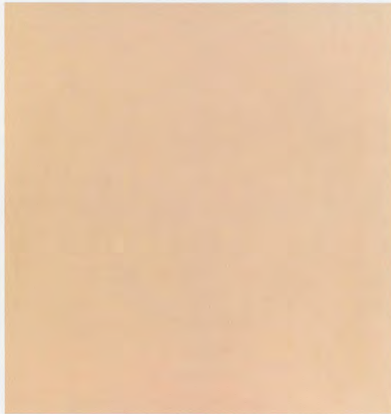
MARKUS DÖBELI, UNTITLED, 2002, acrylic on canvas, 128 x 120" / OHNE TITEL, Acryl auf Leinwand, 325 x 305 cm.

Wer über Döbelis Malerei schreiben will, muss ihrer Weigerung, in Worte oder Namen gefasst zu werden, Rechnung tragen. Der Künstler bezeichnet seine Werke schlicht als Gemälde und gibt ihnen sonst keine Titel, die Hinweise auf ihre inhaltliche Bedeutung enthalten könnten. Die Gemälde sind im Wesentlichen stumm – isolierte, nicht semantische Visionen, die ebenso nach innen wie nach aussen gewandt sind. Der Rezensent hat sich möglichst nahe an die Palette, die Technik, das Format und das Entstehungsjahr jedes einzelnen Werks zu halten. Erschwerend wirkt ausserdem der Umstand, dass sich Döbelis Produktion nicht in Zeitphasen unterteilen lässt: Eine Analyse des Gesamtwerks würde weder in technischer noch in stilistischer Hinsicht eine lineare Entwicklung zutage fördern. Man möchte meinen, Döbeli wurde als der Künstler, der er heute ist,