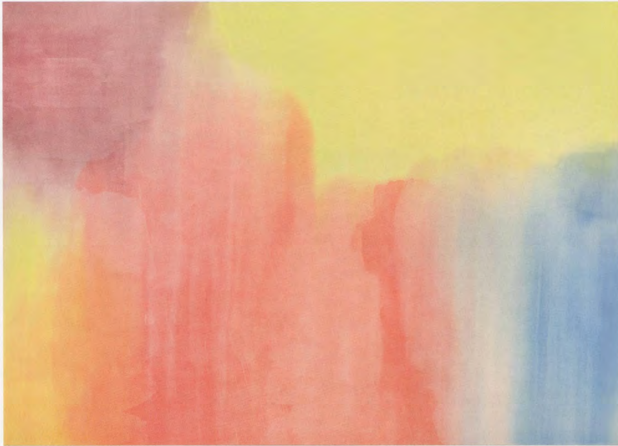
MARKUS DÖBELI, UNTITLED, 2011, acrylic on canvas, 106 1/4 x 149 1/2" / OHNE TITEL, Acryl auf Leinwand, 270 x 380 cm.

be reminded of Northern Romantic painting and the concept of the sublime. 3) Thinking of Döbeli's diffuse washes as clouds at once places his paintings outside the map of reason and within the confining context of art history, re-historicizing it.