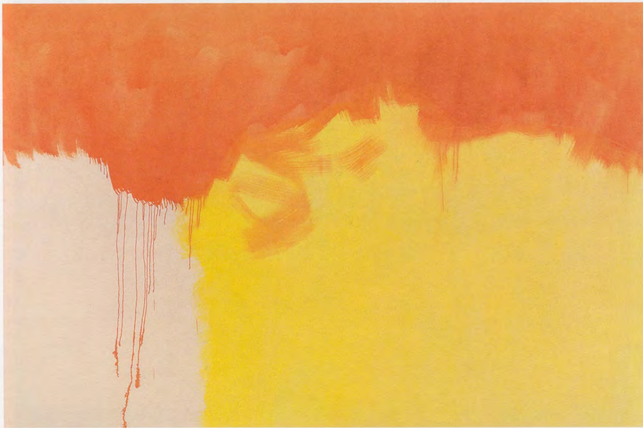
MARKUS DÖBELI, UNTITLED, 2005, acrylic on canvas, 98 1/2 x 149 1/2" / OHNE TITEL, Acryl auf Leinwand, 250 x 380 cm.