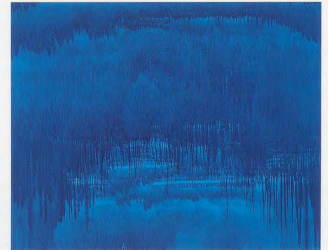
MARKUS DÖBELI, UNTITLED, 2004, acrylic on canvas, 103 1/2 x 113 3/8" / OHNE TITEL, Acryl auf Leinwand, 263 x 288 cm.

ORY DESSAU ist Kurator und Autor, er lebt und arbeitet in Berlin.