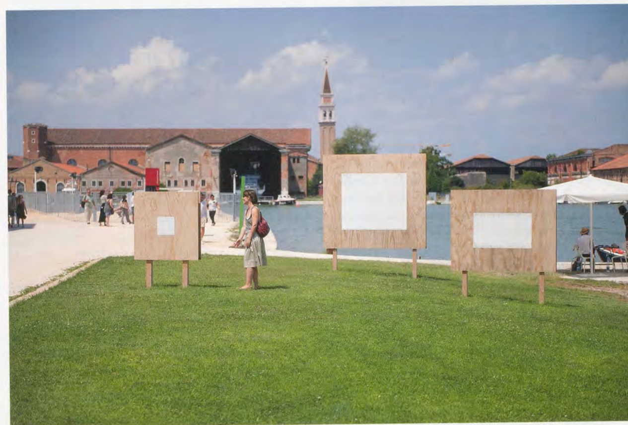
BRUNO JAKOB, BREATH, 2011, invisible painting, rain water, light, touch, air, brainwaves, various unknown techniques on canvas and wood, installation view, Venice Biennale, 2011 / ATEM, unsichtbares Gemälde, Regenwasser, Licht, Berührung, Luft, Gehirnwellen, mehrere unbekannte Techniken auf Leinwand und Holz, Installationsansicht.

Over the course of his career, Jakob has developed several methods of making invisible paintings. Besides using water to draw images that evaporate