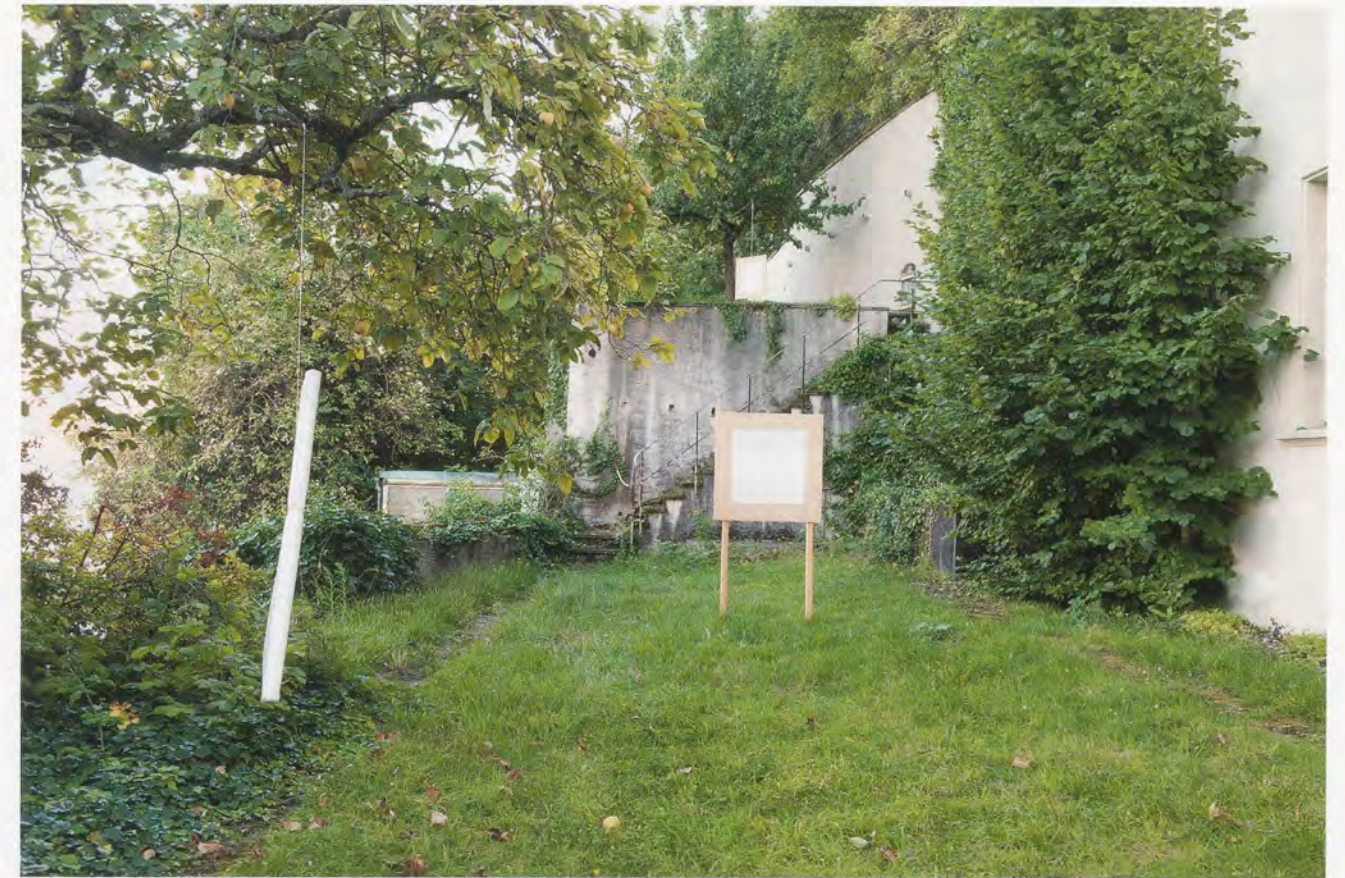
BRUNO JAKOB, FRAGILE IMAGES, SKY CELLS, VEGETATIVE STATE, FLOOD OF THOUGHT, SOMEWHERE NOW, UNTOUCHABLES, 2013, invisible paintings, nature, insects, humidity, sweat, tears, dust, smell, fire, earth, brainwaves, thought, light, air, pleasure, pain, fear, music, sound, echoes, memory, talk, love, live, death and the unknown, some are lost and have found freedom, various techniques on several materials and sizes in unexpected places, dimensions unknown, music: Hans Witschi, installation view, Basel / FRAGILE BILDER, HIMMELZELLEN, VEGETATIVER ZUSTAND, GEDANKENFLUT, IRGENDWO JETZT, UNBERÜHRBARE, unsichtbare Gemälde, Natur, Insekten, Feuchtigkeit, Schweiß, Tränen, Staub, Geruch, Feuer, Gehirnwellen, Gedanke, Licht, Luft, Vergnügen, Schmerz, Angst, Musik, Klang, Echos, Erinnerung, Gespräch, Liebe, Leben, Tod und das Unbekannte, einige sind verloren und haben Freiheit gefunden, verschiedene Techniken auf mehreren Materialien und Formate an unerwarteten Orten, Masse unbekannt, Musik: Hans Witschi, Installationsansicht.