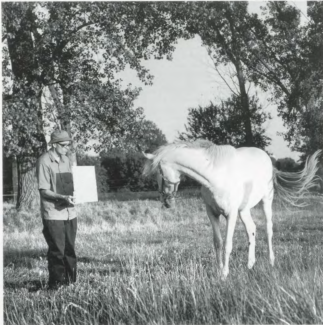
BRUNO JAKOB, UNTITLED (HORSE), INVISIBLE PAINTING, ENERGY, 2003, b/w photograph, 13\frac{3}{4} \times 13\frac{3}{4} \times 1\frac{1}{8} " , framed / OHNE TITEL (PFERD), UNSICHTBARES GEMÄLDE, ENERGIE, s/w Photographie 34,9 \times 34,9 \times 3 cm, gerahmt.