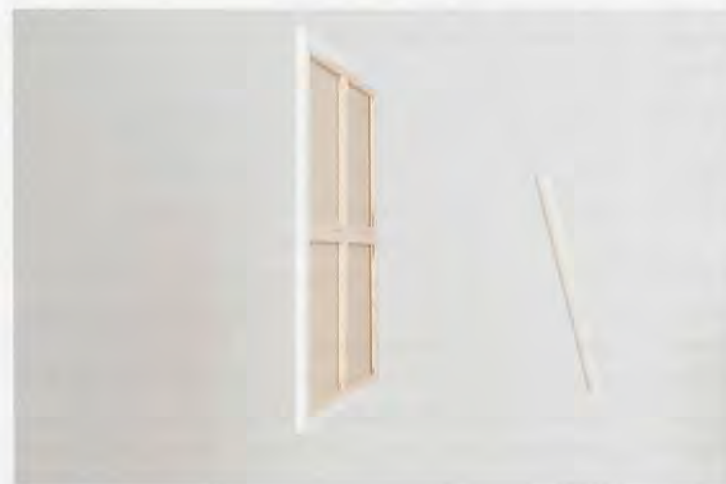
BRUNO JAKOB, UNUSUAL THINGS HAPPEN (IT'S ALL THERE), 2012, invisible paintings, brainwave energy, light, touch, air, hot steam, water, time, seasons, worries collecting and releasing, unknown technique on yellow primed (unseen) canvas and 1 roll; canvas: 31 1/2 x 31 1/2", roll: 24 x 2" / UNGEWÖHNLICHE DINGE GESCHEHEN (ALLES IST DA), unsichtbares Gemälde, Gehirnwellenenergie, Licht, Berührung, Luft, heisser Dampf, Wasser, Zeit, Jahreszeiten, gesammelte und losgelassene Sorgen, unbekannte Technik und gelb grundierte (ungesehene) Leinwand und 1 Rolle; Leinwand: 80 x 80 cm, Rolle: 61 x 5 cm.

Jakobs Gemälde aber sind nicht Landebahnen für Umgebendes, sondern für ungreifbare Energien, und die «White Paintings» sind deshalb als Vorläufer