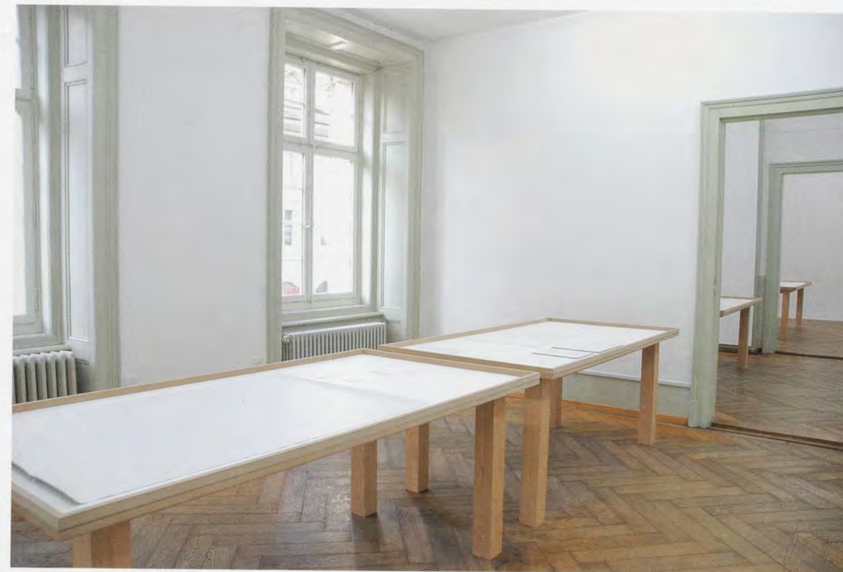
BRUNO JAKOB, HAPPY NOTHING: STILL COLLECTING, 1990/1998, lemon yellow, water, brain, energy, touch, light, installation with 2 canvases and 29 works on paper and mixed media on 4 tables, exhibition view, Kunsthau Langenthal, 2007 /

Wenn wir eine solche Beschreibung lesen, kann unsere Reaktion darauf vielerlei Formen annehmen; vielleicht fragen wir uns, ob der Künstler es wirklich ernst meint mit Materialien wie «Gehirnströmen» und, falls ja, ob er vielleicht unter Wahnvorstellungen leidet oder uns einfach kollektiv veralbert. Mit dem Hinweis auf Materialien wie Regenwasser und Licht aber bieten seine Bildlegenden einen Hinweis darauf, wie die verwitterten und delikat-filigranen Oberflächen der Gemälde zustande kamen. Wasser ist – zusammen mit einigen der oben erwähnten,