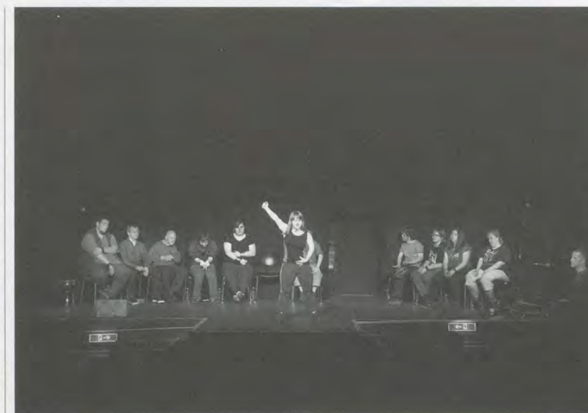
Jérôme Bel, Disabled Theater , 2012, performance view, Kassel.

Among the many performative encounters at documenta 13 (Theater Gates's jam sessions at the Hugenottenhaus, Tino Sehgal's jam sessions at the Grand City Hotel, Seth Price's trashy fashion show in the Friedrichsplatz parking garage), Jérôme Bel's Disabled Theater (2012) pululated most potently around the keywords and "abouts" fixing Christov-Bakargiev's themeless art festival.