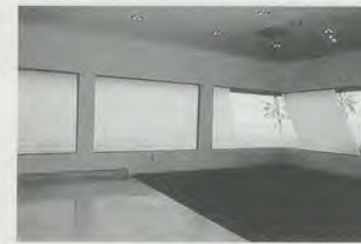
John Knight, Bienvenue , 1990, detail. Paint on glass, 28 x 240 ft.