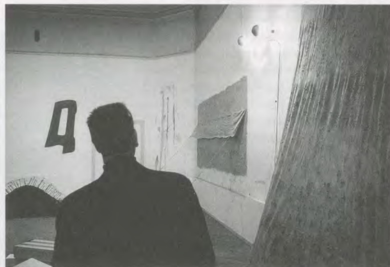
"When Attitudes Become Form," 1969, exhibition view / Ausstellungsansicht.