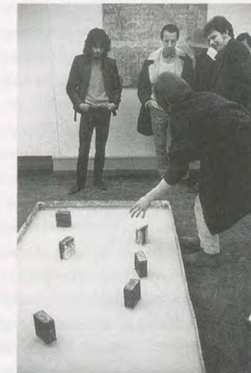
“When Attitudes Become Form,” 1969, exhibition view / Ausstellungsansicht.