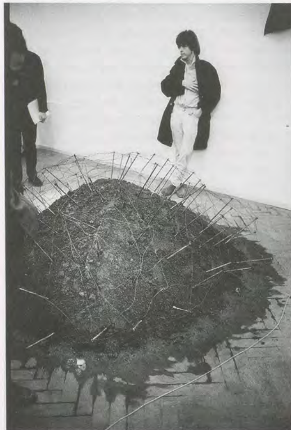
«When Attitudes Become Form», 1969, exhibition view / Ausstellungsansicht.

Ein Grund mag der Mangel an unabhängigen Wirkungsmöglichkeiten sein. Biennalen oder Triennalen waren bislang das wichtigste Betätigungsfeld für nicht amerikanische unabhängige Kuratoren, in den Vereinigten Staaten aber hat sich dieses Format nie richtig durchgesetzt, sieht man von einigen wenigen Ausnahmen ab wie etwa die weitblickende Biennale InSite in San Diego/Tijuana, und sogar die war bisher, wenn man so will, eher eine lateinamerikanische Angelegenheit. Im Gegensatz etwa zur Manifesta oder zu den Biennalen in Lyon und Berlin sind die Biennalen in Amerika in den meisten Fällen an Museen gebunden (allen voran die Whitney Biennial und die Carnegie International, zu denen demnächst die Triennale des New Museum hinzukommen wird) und gehorchen am Ende oft den gleichen Regeln wie jede andere Grossausstellung an solchen Stätten. Es mag noch andere, vielleicht tiefer liegende Gründe für die Kluft zwischen dem höchst subjektiven, politischen und kritischen Verständnis kuratorischer Praxis in Europa und der eher zahmen, institutionsgebundenen amerikanischen Praxis geben, die sich in stärkerem Masse auf kunsthistorische Forschung und die Zurschaustellung von Objekten konzentriert. Der