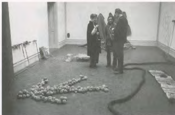
"When Attitudes Become Form," 1969, exhibition view / Ausstellungsansicht.