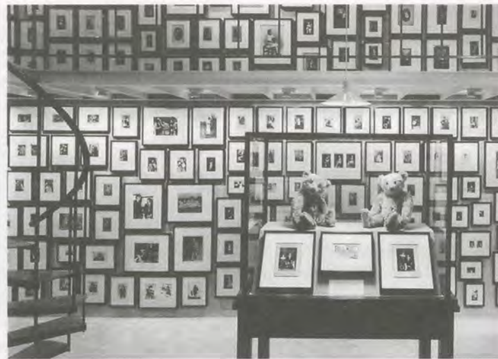
"Partners," 2003, exhibition view / Ausstellungsansicht.

tions and museum studies and director of exhibitions at the San Francisco Art Institute; not to mention my own move in 2007 from the Institute of Contemporary Arts in London to the CCA Wattis Institute of Contemporary Arts in San Francisco. The phenomenon of an exhibition space within an educational environment is largely unheard of in Europe and clearly provokes much interest in curators, with its potential for very practice-focused curatorial explorations within a fully developed, intellectually stimulating academic setting. This niche is a truly innovative American structure, allowing curators to participate in the educational process while continuing to develop experimental exhibitions, the success of which is judged not by their box office or audience numbers but purely by what takes place in the exhibition space. Perhaps this truly original invention of the US is the future for a differentiated, creative, and at times more political form of curatorial practice.