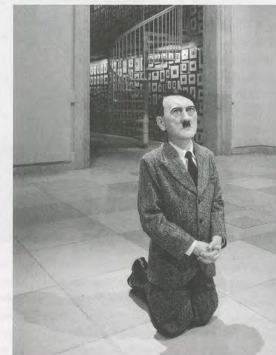
MAURIZIO CATTALAN, HIM, 2001, exhibition view / Ausstellungsansicht.

In den Vereinigten Staaten dagegen sind nur einige wenige Namen präsent. Ein Grund dafür mag das Fehlen einer