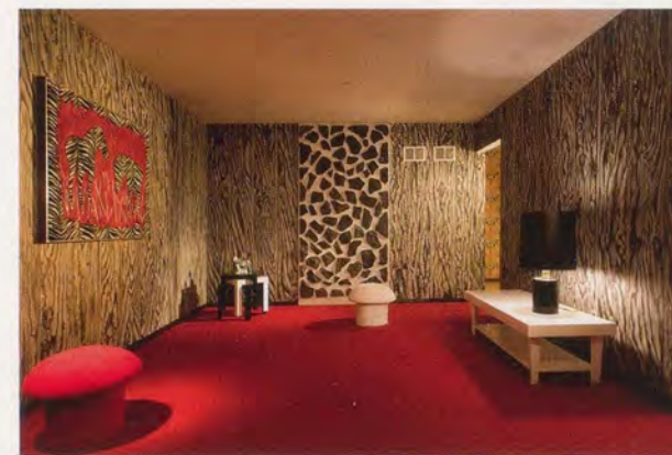
KEITH EDMIER, BREMEN TOWNE, 2007, family room with zebra painting; kitchen; family photograph / Wohnzimmer mit Zebra-Gemälde; Küche, Familienphoto.