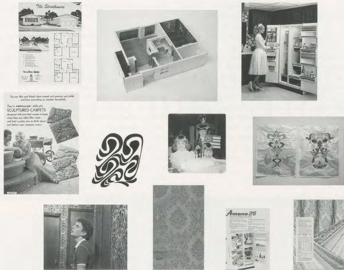
KEITH EDMIER, BREMEN TOWNE, from left to right, top to bottom: sales brochure with floor plan; model of house; reconstructed Amana 25 refrigerator; Sears carpet catalog, 1972; drawing of pattern repeat; family photograph; studies of pattern repeat; family photograph; vintage sample of Jacquard drapery; Amana catalog, ca. 1971; JC Penney catalog, ca. 1971 / von links nach rechts, von oben nach unten: Broschüre mit Grundrissplan; Hausmodell; rekonstruierter Amana 25-Kühlschrank; Sears-Teppichkatalog, 1972; Zeichnung eines Musters; Familienphoto; Zeichnung eines Wiederholungsmusters; Familienphoto; Muster der Jacquard-Draperie; Amana-Katalog, ca. 1971; JC Penney-Katalog, ca. 1971.

einfach irgendwie passiert, durch den Prozess des Machens. Bei bestimmten Dingen, die ich anfertige, geht es um die Erinnerung an das Objekt. Die Lampe beispielsweise ist offensichtlich kein präziser Gegenstand. Ich habe für sie nur begrenzt fotografische Quellen. Aber alles an ihr musste sich für mich richtig anfühlen. Solche Dinge beschäftigen mich sehr.» 2)