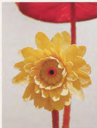
KEITH EDMIER, VICTORIA REGIA (FIRST NIGHT BLOOM), 1998, detail.

Mit VICTORIA REGIA (FIRST NIGHT BLOOM) und VICTORIA REGIA (SECOND NIGHT BLOOM), beide 1998, hat er eine monumentale Skulptur aus Kunstharz, Polyurethan, Acryl und Silikon geschaffen. Die Riesen-Wasserlilie, die er in Oregon abformte,