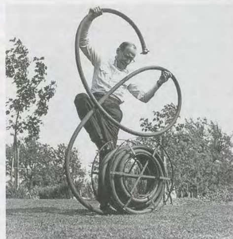
LEE MILLER, SAUL STEINBERG FIGHTS WITH THE GARDEN HOSE IN A MANNER ALL HIS OWN, 1952. (PHOTO: LEE MILLER ARCHIVES, ENGLAND, 2008, ALL RIGHTS RESERVED)

schen» Gemälden und Zeichnungen der 50er-Jahre hatte er der Linie viel Aufmerksamkeit geschenkt. Später, bei seinen linearen Skulpturen der 60er-Jahre, wurde die Linie dreidimensional, verkörpert durch Objekte wie hölzerne Speere, Haken und Stöcke oder durch die Verwendung von Seilen, Schnüren und Kabeln. Im Jahr 1968 entdeckte der Künstler ein neues Material: blaues Klebeband, das es ihm erlaubte, die Linie horizontal zu ver-