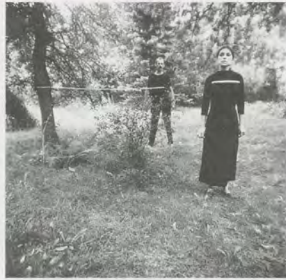
Edward Krasinski, first interventions with blue scotch, Zalesie, 1969 / Erste Versuche mit blauem Klebeband.

beteiligt sind oder aber den Aufbau ihrer fertigen Arbeit vor Ort beaufsichtigen. Indem er sich selbst als einen Arbeiter unter anderen inszenierte, unterstrich Krasinski die Ähnlichkeit künstlerischer und anderer Formen der Arbeit, oder besser gesagt, weil auf den Aufnahmen gar nicht gearbeitet wird, betonte er, wie wichtig es sei, ab und an eine Pause einzulegen.