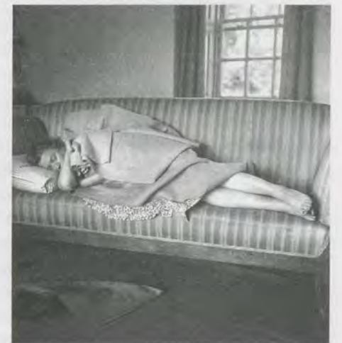
ROLAND PENROSE, LEE MILLER, THE HOSTESS TAKES IT EASY, 1953 / DIE GÄSTGEBERIN RUHT SICH AUS.