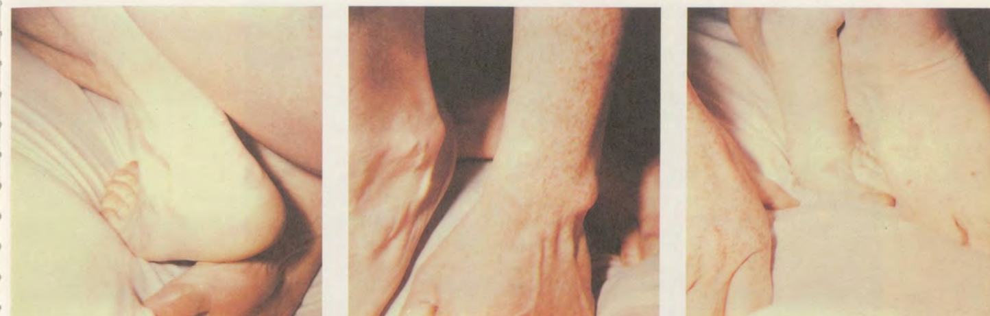
6 PHOTOGRAPHS BASED ON POLAROID PICTURES, MOUNTED ON ALUMINUM, 124 x 732 CM / 49 x 289"

Hannah Villigers photographische Korrespondenz mit einem Kastanienbaum (mit dem Titel VON DER TERRASSE, DER BAUM), die sie gleichzeitig mit der Arbeit am eigenen Körper begann, setzt jetzt neue Schwerpunkte. In den letzten Bildserien versucht sie das Sonnenlicht völlig auszuschalten, um das Volumen, die Architektur des Baumes herauszustellen. Der Betrachter, berauscht von der dunkelgrünen Blätterfülle, möchte eintauchen und ganze Tage in diesen Bäumen verbringen. Indessen flieht der Baum, es bleibt schliesslich das Gefühl, ihn gestreift, kurz berührt zu haben. Als lichtscheues Objekt bleibt der Baum existent. So scheu ist es, dass es zu sich selbst zurückfindet und dort verweilt.