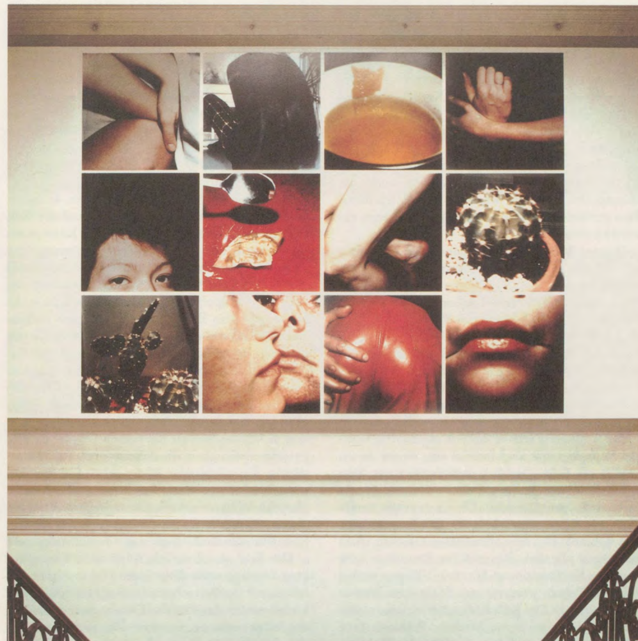
HANNAH VILLIGER, ARBEIT / WORK 1980-81, PHOTOGRAPHIEN NACH POLAROID-VORLAGEN, AUF ALUMINIUM AUFGEZOGEN / PHOTOGRAPHS BASED ON POLAROID PICTURES, MOUNTED ON ALUMINUM, 355 x 475 CM / 139 3/4 x 187 1/2"

Hannah Villiger arbeitet mit und gegen die Ro- mantik des eigenen Körpers, setzt den Betrachter anonymer und persönlicher Nähe aus. Die Folge der Arbeiten in der Kunsthalle Basel spielt dieses ambivalente Thema durch. Warmes Rotlicht streift