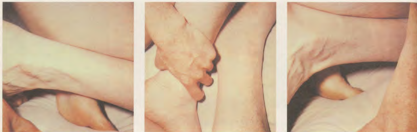
HANNAH VILLIGER, ARBEIT / WORK 1984, 6 PHOTOGRAPHIEN NACH POLAROID-VORLAGEN, AUF ALUMINIUM AUFGEZOGEN /

re Mitspieler sind nötig, um die riesigen Stäbe aus Holz zum Wurf zusammenzufassen. In ihren ungewöhnlichen Ausmassen bekommen diese Spielzeuge das Aggressionspotential von Kampfinstrumenten, spitzen Pfeilen, Speeren gleich, die beim Umfallen jedoch ihre Bedrohlichkeit, ihre Monumentalität wieder aufs Spiel setzen. Und auch das: Beim Werfen wird dieses Aggressionspotential in den öffentlichen Raum abgegeben, dort ausgetragen. Wie ich mich erinnere, waren Mikado-Spiele am Tisch äusserst fesselnd. Ganz unabsichtlich, so schien es mir, wurden Schaubilder von höchst komplexen seelischen Befindlichkeiten sichtbar. Diese Spiele forderten zur Konzentration und Anteilnahme aller Mitspieler heraus. Das leiseste Zittern der Hände entschied über den Ausgang des Spiels.