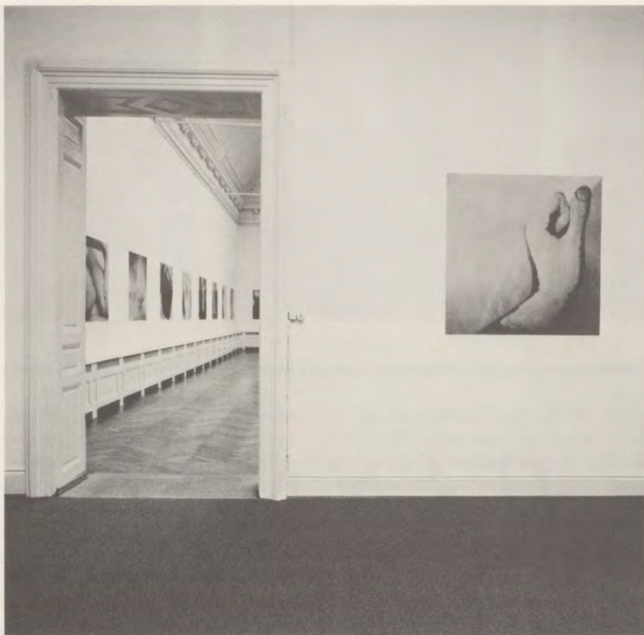
HANNAH VILLIGER, BILDHAUEREI / SCULPTURE 1984-85, PHOTOGRAPHIEN NACH POLAROID-VORLAGEN, AUF ALUMINIUM AUFGEZOGEN /

almost be painted compositions, sometimes even recalling Impressionistic techniques.