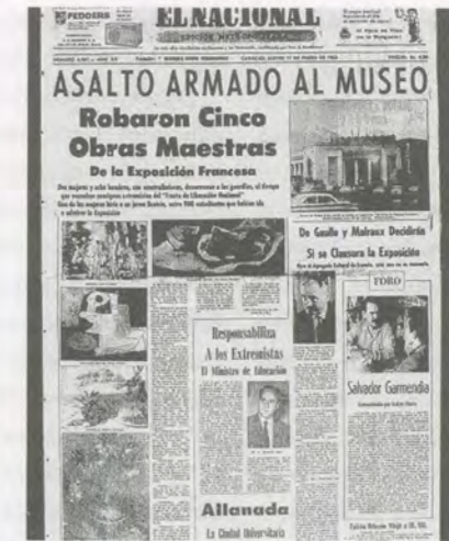
El Nacional, Thursday, January 17, 1963, headline: Armed Museum

Zwar gab es keinen unmittelbaren Zusammenhang zwischen diesen beiden Ereignissen, doch beide wären ohne das Museum der Schönen Künste in Caracas, der ältesten und damals einzigen der Kunst gewidmeten venezolanischen Institution, nicht denkbar gewesen. Bedenkenswerterweise fand der Wechsel von der Dissidenz als einer