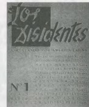
Los Disidentes, No 1, 1950, cover / Umschlag.