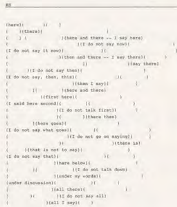
VITO ACCONCI, RE, 1969, type on paper / Schrift auf Papier.