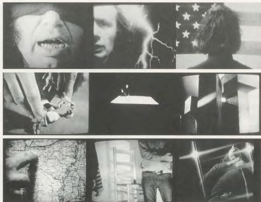
VITO ACCONCI, THE RED TAPES , 1976/1977, black-and-white video tape, sound / DIE ROTEN TONBÄNDER , schwarz-weißes Videoband, Klang.

«Winter», «Frühling», «Sommer», «Herbst» zusammenstellt und – ein merkwürdiges Clinamen – bestimmte Tage (an denen er nicht zu Hause war) auslöst, sodass auf die eine Vorhersage nicht die nächste folgt. Doch selbst wenn sie zeitlich aufeinanderfolgen, sind die Wettervorhersagen oft falsch. Und dann, im Frühling 2002, wird der Wetterbericht plötzlich aus Bagdad gesendet: Der Irakkrieg ist ausgebrochen. The Weather erweist sich somit als eine ironische Erzählung.