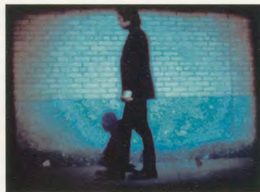
VITO ACCONCI, FILLING UP SPACE / DEN RAUM AUSFÜLLEND, 1970, Super-8 film.

MARJORIE PERLOFF ist Sadie D. Patek Professor of Humanities Emerita an der Stanford University. Sie hat zahlreiche Bücher über Dichtung und bildende Kunst verfasst, darunter The Futurist Moment: Avant-Garde, Avant Guerre, and the Language of Rupture (1986), Radical Artifice: Writing Poetry in the Age of Media (1992), und Poetry On & Off the Page (1998).