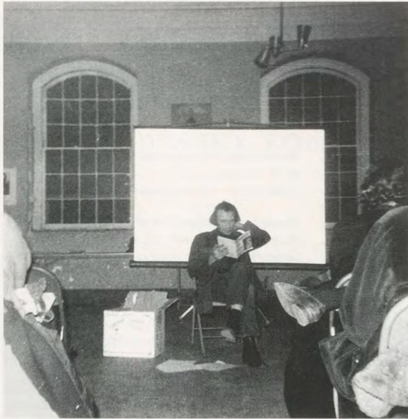
VITO ACCONCI, BUYING TIME, 1969, activity / ZEIT KAUFEND, Handlung.

Frühe Experimente wie dieses ebneten der Zeitschrift 0 TO 9 den Weg, die zwischen 1967 und 1969 von Acconci und der Dichterin Bernadette Mayer herausgegeben und von ihnen selbst vervielfältigt wurde. Mit ihren insgesamt sieben Ausgaben war die Zeitschrift ein Forum für Dichter wie Clark Coolidge und Ted Berrigan, Fluxus-Performer wie Dick Higgins und Emmett Williams und Künstler wie Sol Le Witt, Adrian Piper, Dan Graham und Robert Smithson. Jackson Mac Low veröffentlichte in 0 TO 9 die «Biblical Poems», seine ersten auf Zufallsoperationen basierenden Gedichte. Die kleine, aber zunehmend an Gewicht gewinnende Ugly Duckling Presse in Brooklyn hat die Bedeutung dieser Zeitschrift erkannt und eben erst einen Nachdruck sämtlicher Ausgaben in einem Band herausgebracht (736 Seiten; $ 45).