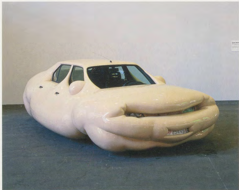
ERWIN WURM, FAT CAR, 2001, mixed media, 51 1/4 x 104 1/4 x 189" / FETTES AUTO, verschiedene Materialien, 130 x 265 x 480 cm.