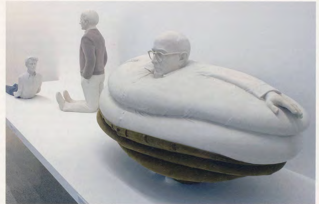
ERWIN WURM, from left to right: WITTGENSTEIN'S SPACE WARP, 2005 / DELEUZE KNEELING DOWN, 2006 / ADORNO AS OLIVER HARDY IN THE BOHEMIAN GIRL (1936), AND THE BURDEN OF DESPERATION, 2006 / von links nach rechts: WITTGENSTEINS RAUMKRÜMMUNG / DELEUZE NIEDERKNIEND / ADORNO ALS OLIVER HARDY IN THE BOHEMIAN GIRL (1936) UND DIE LAST DER VERZWEIFLUNG.

ne künstlerische Arbeit einzubeziehen. Es ging ihm darum, zu «provozieren», die bestehende Werteordnung in Frage zu stellen, dieses Anliegen war ihm so wichtig, dass etwas als «nicht korrekt» Empfundenes reichte, um das Interesse des jungen Künstlers auf sich zu ziehen. 3) Dieses Bemühen, genau die falsche Position – in Opposition zum Zeitgeist – zu beziehen, führte Wurm Mitte der 80er Jahre zu Arbeiten wie UNTITLED (1987, mit einer Skulptur aus Neuguinea) und UNTITLED (1987, mit einer Figur aus den ehemaligen französischen Kolonien). Bei diesen Arbeiten stehen Werke primitiver Kunst in einem nicht nachvollziehbaren Zusammenhang mit Behältern wie einem Ölkännchen oder einem Abfalleimer. Das entschiedene Primitivistische verweist weniger auf die Uranfänge der Kunst als auf die Epoche der Klassischen Moderne und war in diesem Zusammenhang negativ konnotiert: Es geht nicht so sehr um eine Antiästhetik als vielmehr um eine Ästhetik des «Gegen». «Mein Werk war als solches», so Wurm, «natürlich konservativ, ein Rückschritt, aber ein provokanter Rückschritt.» 4) Obwohl diese Werkgruppe noch nicht erkennen lässt, welche Grenzen der Skulptur sein späteres Schaffen in Fra-