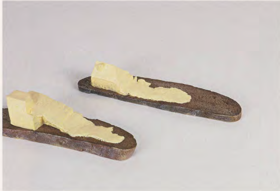
ERWIN WURM, BUTTERBROT I (Bread and Butter), 2006, aluminium, paint, 3 x 12 1/2 x 3" / bemaltes Aluminium, 7,5 x 32 x 7,5 cm / BUTTERBROT II, 2006, aluminium, paint, 2 1/2 x 12 1/2 x 3" / bemaltes Aluminium, 6,5 x 32 x 7,5 cm.

einer Trendwende und einer, wie der Künstler es nennt, «Welle der Nostalgie» das Figurative in der Kunst wieder an Wertschätzung gewann. 6) Im Fall der klassischen Avantgarde gälte ein solcher Moment als Triumph, als ein Coup, im Zuge dessen der Künstlerrebell sich ganz oben in der kulturellen Rangordnung etabliert, dort, wo er seiner Überzeugung nach hingehörte. Nicht so bei Wurm. Zu diesem Zeitpunkt vollzog er eine Abkehr vom Figurativen und wandte sich neuen Fragen zu, die er mit seinen Staub Arbeiten aufwerfen sollte. Er formalisierte seine ursprüngliche Geste des Zurücktretens vom Konsens und machte klar, dass es für ihn kein System gibt, welches er an die Stelle der bestehenden Ordnung setzen wollte: Es gibt nur Skepsis, die es, selbst angesichts scheinbaren Erfolges, rigoros beizubehalten gilt.