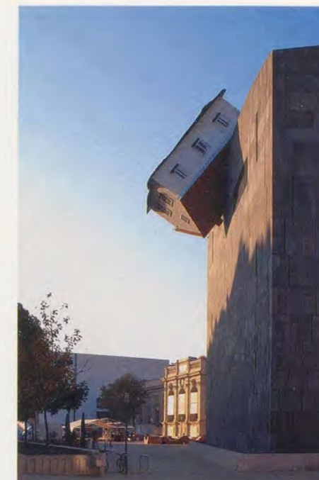
ERWIN WURM, HOUSE ATTACK, 2006, installation view at the Museum of Modern Art, Vienna / HAUS-ANGRIFF, Installationsansicht Museum Moderner Kunst, Wien.

Vielsagend ist, dass wir beim Blick auf Wurms zurückliegendes Schaffen eine ebenso grosse Verschiebung feststellen wie beim Blick nach vorne. Bevor er in der ersten Hälfte der 90er Jahre – vor