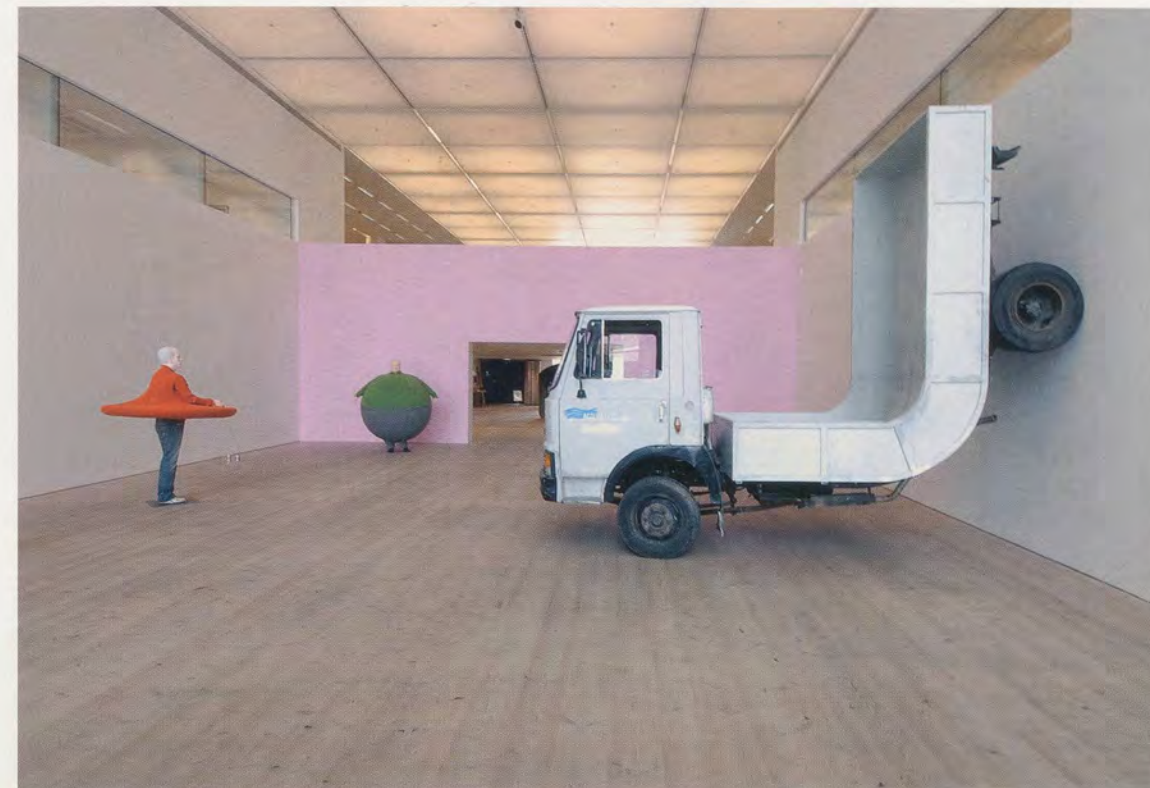
ERWIN WURM, from left to right: THE ARTIST WHO SWALLOWED THE WORLD WHEN IT WAS STILL A DISK , 2006 / THE ARTIST WHO SWALLOWED THE WORLD , 2006 / TRUCK , 2005 / von links nach rechts: DER KÜNSTLER, DER DIE WELT VERSCHLUCKTE ALS SIE NOCH EINE SCHEIBE WAR / DER KÜNSTLER, DER DIE WELT VERSCHLUCKTE / LASTWAGEN .

critical discourse—in the form of philosophy—as an object, thus declaring it other than art itself, but that the resulting work of art is so wholly un-rhetorical, so un-dialectical. Critique is mere rhetorical practice, bound to reason, ensnared by language. The work of art, by contrast—as this elegantly dumb piece shows us—cannot speak, but can only be. Art, then, may go where language may not; it may access life as discourse may not. A work like the pair of ARTISTS WHO SWALLOWED THE WORLD , seen in such a way, becomes Wurm's lyrical step away from the discourse of science. Again, these works do not amount to a constructed argument with science, which we are to "read" (for if it were, how bad it would be!); it is simply a distancing from that field, that kind of knowledge. The work's crucial, humor-