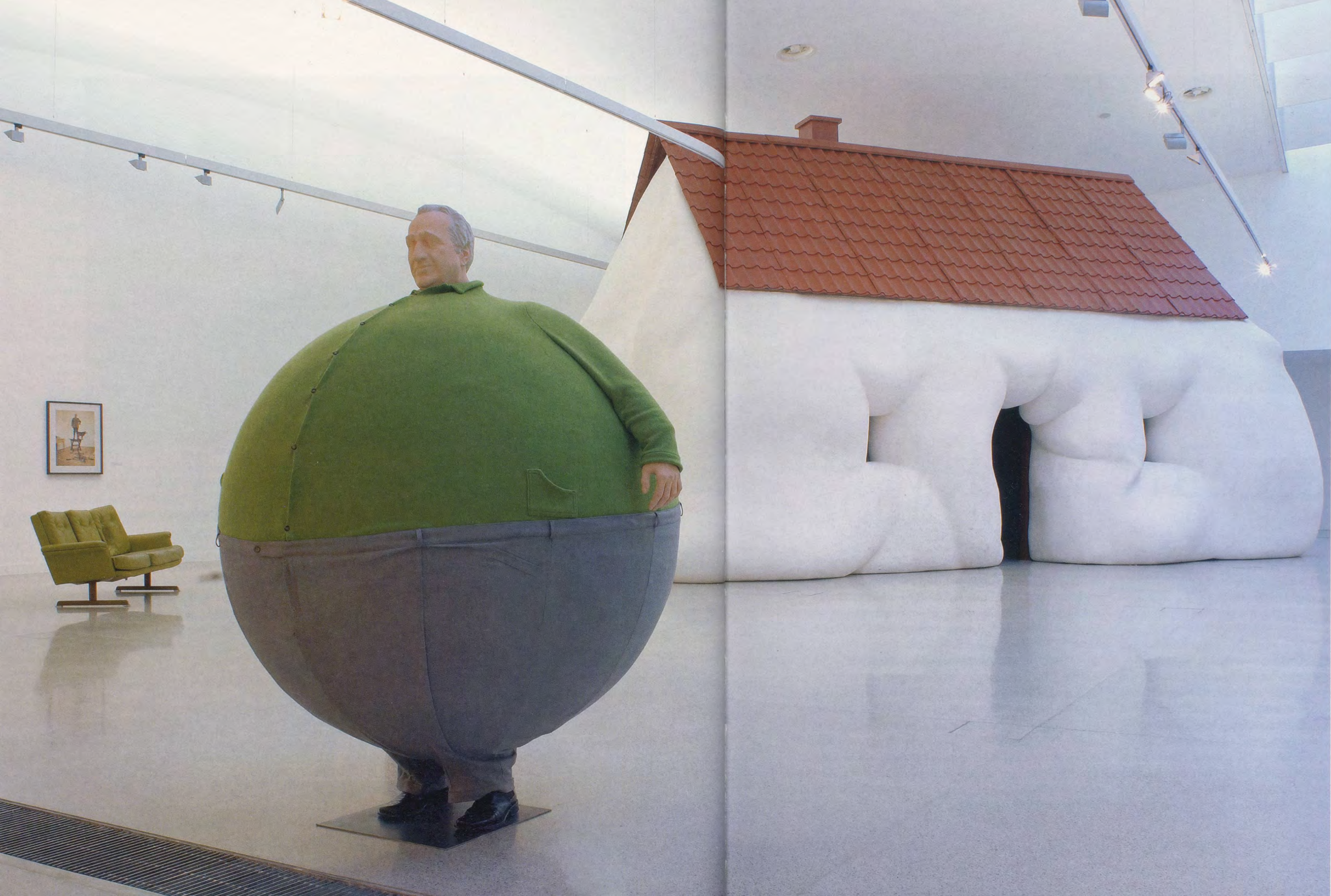
ERWIN WURM, THE ARTIST WHO SWALLOWED THE WORLD , 2006, mixed media, 74 3 / 4 x 55 x 55", FAT HOUSE , 2003, mixed media, 212 1 / 2 x 393 3 / 4 x 275 1 / 2 " / DER KÜNSTLER, DER DIE WELT VERSCHLÜCKTE , verschiedene Materialien, 190 x 140 x 140 cm, FETTES HAUS , verschiedene Materialien, 540 x 1000 x 700 cm.