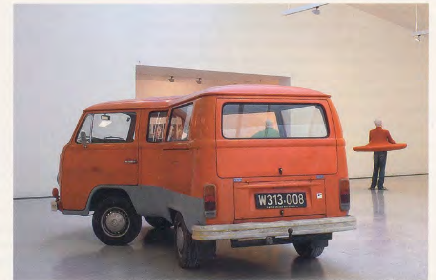
ERWIN WURM, TELEKINETICALLY BENT VW-VAN, 2006, 82 3/4 x 90 1/2 x 173 1/4" / TELEKINETISCH GEBOGENER VW-BUS, 130 x 230 x 440 cm.