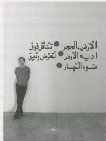
DOUGLAS GORDON, A FEW WORDS ON THE NATURE OF RELATIONSHIPS / EINIGE WORTE ÜBER DIE NATUR VON BEZIEHUNGEN, 2006.

Wunder geben) und Ian Hamilton Finlays kleines Gedicht aus den Worten «Revolution, Virtue, Eloquence, Transparency» (Revolution, Tugendhaftigkeit, Beredtheit, Transparenz).