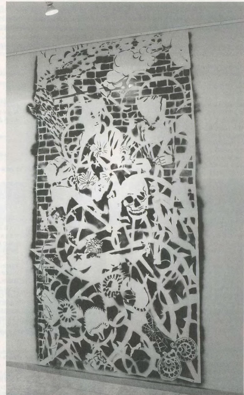
SIMON PERITON, YOUR LOVE, MY WAR / DEINE LIEBE, MEIN KRIEG, 1996 / 2006.

Für die hier Lebenden ist das Erlebnis einer solchen Kunstaussstellung Welten entfernt von dem des von Land zu Land reisende Biennalenbesuchers.