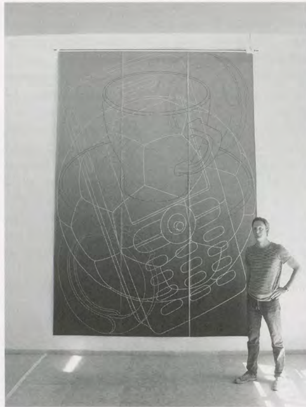
MICHAEL CRAIG-MARTIN, SIMPLE LIFE / EINFACHES LEBEN, 2006.

«Für uns», so drückte es ein örtlicher Künstler aus, der von Ramallah zur Eröffnung der Ausstellung anreiste, «ist Kunst kein Luxus, sondern Linderrung.» Für die Anreise mit dem Bus aus dem lediglich zehn Kilometer entfernten Ramallah hatte er fast zwei Stunden gebraucht. Eine Ausstellungseröffnung ist in diesen Regionen nicht etwas, wo man einfach mal kurz hereinschauen kann. Es ist nicht einmal sicher, dass man es schafft, hinzukommen. Und dieses Mal schaffte es tatsächlich nicht jeder: Suleiman Mansour, der angesehene palästinensische Künstler, wurde am Kontrollpunkt an der Mauer wegen «ungeeigneter Papiere» zurückgewiesen.