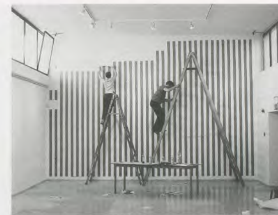
DANIEL BUREN, UNTITLED / OHNE TITEL, 2006.

If you saw these works in the cozy confines of your workaday white cube or public space, some of them might even seem a little, well, one-liner-ish. Here, however, context is everything. One local described Buren's work as "a flag done in Hamas green." Was Buren's choice of color deliberate? Martin Creed's dark black lines looked like the beginnings of a more ominous kind of wall being built—like a black-out in progress. Gordon's work took on a less poetic, more descriptive mean-