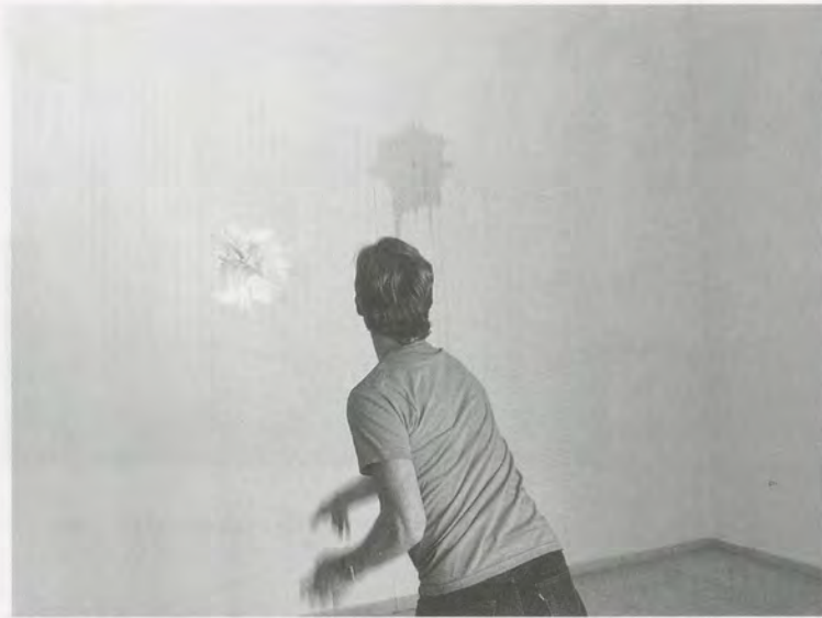
ANDREAS SLOMINSKI, UNTITLED / OHNE TITEL, 2006.