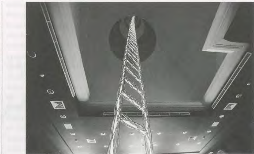
YAYOI KUSAMA, LADDER TO HEAVEN , 2006, installation view Singapore Biennale / HIMMELSLEITER, Installationsansicht.

For example, while attention is paid to artistic practices and the burgeoning art market in Asia, there are few articles in the Western press (and even