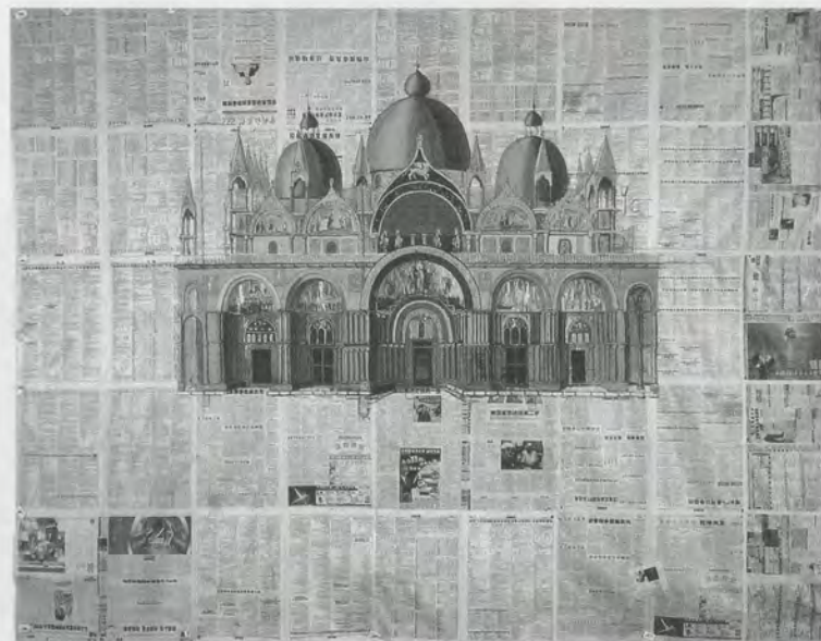
ZHOU TIEHAI, VENICE - ST. MARCO SQUARE , 2005, mixed media on paper, 102 1/4 x 131 3/4" / VENEDIG MARKUSPLATZ , verschiedene Materialien auf Papier, 260 x 335 cm.

Such frenetic activity is also fanning interest in the question of who will run these spaces, quite apart from the issue of where the funds will come from in order to maintain programming. Academies are now setting up arts management and curating courses, of which the first was established at the Central Academy in Beijing. Now with over one hundred students enrolled and pilot programs running in Shanghai, the curriculum has the task of providing both management and curatorial training that is not only relevant to needs in the national context, but that also reflects the burgeoning international exchange. In talking with curators and