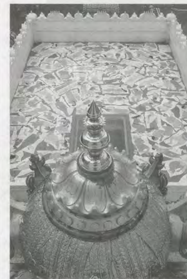
N.S. HARSHA, COSMIC ORPHANS , 2006, installation view Singapore Biennale / KOSMISCHE WAISENKINDER, Installationsansicht.

KATE FOWLE leitet das MA-Studienprogramm «Curatorial Practice» am California College of the Arts in San Francisco.