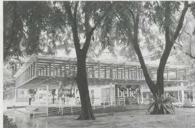
SHIGERU BAN, Paper House / Papierhaus , 2006, Singapore Biennale.

Auch der Radikalismus nimmt im asiatischen Kontext eine andere Gestalt an. Es ist allgemein bekannt, dass Kuratoren und Künstler seit Jahren mit Zensurmassnahmen der chinesischen Regierung leben müssen; das berühmt-berüchtigtste Beispiel ereignete sich 1989, als die Ausstellung China/Avant Garde in der Nationalgalerie in Beijing nur wenige Stunden nach der Eröffnung geschlossen wurde. Diese Situation hält nach wie vor an, auch wenn sie sich verbessert hat. In amerikanischen und europäischen Kunstzeitschriften wird nur wenig darüber berichtet. Im letzten Jahr wurden in Shanghai zwei Ausstellungen von den Behörden geschlossen; zunächst war das neu eröffnete Zendai Museum betroffen und später das alternative BizArt Centre. In beiden Fällen wurde die Schliessung mit dem Vorwurf der Pornographie begründet. In China ist es nicht üblich, dass ein Kurator aus Protest gegen solche Zensurmassnahmen zurücktritt. Ein solcher Rücktritt