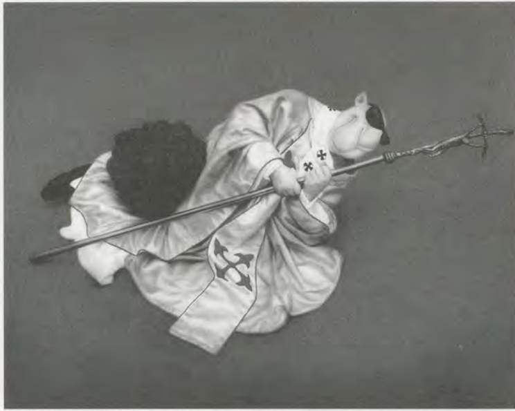
ZHOU TIEHAI, MAURIZIO CATTELAN, 2006, airbrush on canvas, 78 3/4 x 59" / Airbrush auf Leinwand, 200 x 150 cm.

Kurator stellt, entscheidend mitbestimmt haben. Szeemann starb 2005. Wie keinem Kurator zuvor wurden ihm in zahlreichen Zeitungen und Zeitschriften Nachrufe gewidmet – ein Zeichen dafür, dass die Medien in Kuratoren inzwischen «Celebrities» sehen, die für ein breites Publikum ausserhalb der Kunstwelt interessant geworden sind.