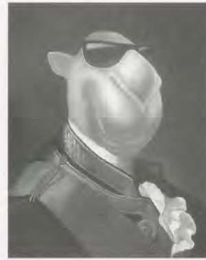
ZHOU TIEHAI, ADMIRAL LORD GEORGE BRYDGES RODNEY BRYDGES , 2006, airbrush on canvas, 23 3/4 x 20 1/2" / Airbrush auf Leinwand, 60 x 52 cm.

könnte weder kurzfristig etwas bewirken, noch nachhaltige Diskussionen in Gang setzen, zumal in den weit verbreiteten Online- und Print-Medien nicht darüber berichtet werden würde. Stattdessen suchen die Kuratoren nach Wegen, mit den Behörden zu verhandeln; sie lavieren sich durch das politische System, um die Sache der zeitgenössischen Kunst zu fördern und eine lebensfähige Kunstszene aufzubauen.