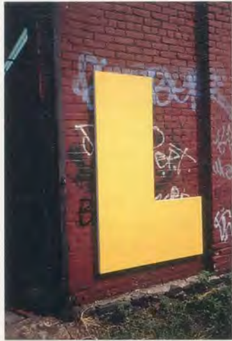
OLIVIER MOSSET, L-SHAPE, 1996, acrylic on canvas, 71 x 47 1/4" / L-FORM, Acryl auf Leinwand, 180 x 120 cm.

Format und den Farben der drei monochromen Gemälde von Alexander Rodtschenko aus dem Jahr 1921 – die letzten Bilder der Geschichte (vor den später folgenden), als wolle er ihnen nachträglich einen Gebrauchswert verleihen. «Malewitsch und die anderen wollten gleichzeitig malen und sich der Malerei entledigen. In dieser Tradition hiess für mich der nächste Schritt, ein monochromes Tafelbild zu schaffen, das nützlich sein musste, ohne dabei seine malerischen Qualitäten zu verlieren: Warum also nicht eine Fussmatte? Auf dem Boden wäre sie vielleicht nützlicher als ein Carl Andre.» 8)