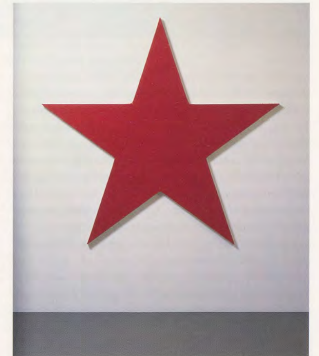
OLIVIER MOSSET, RED STAR, 1990, acrylic on canvas, 80 3/4 x 80 3/4" / ROTER STERN, Acryl auf Leinwand, 5 x 205 cm.

VINCENT PÉCOIL is an art critic and curator. He lives in Dijon.