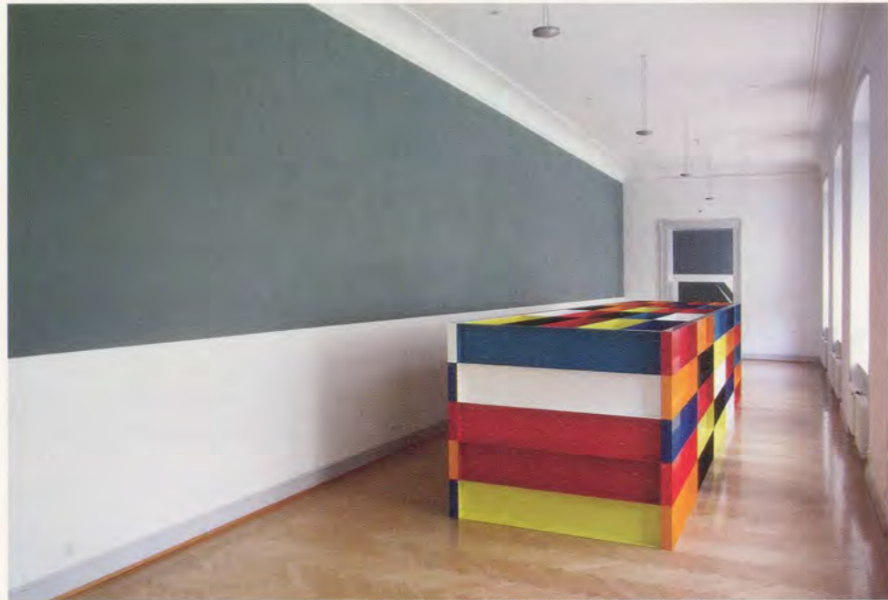
OLIVIER MOSSET, B4 , 2003, wall painting, and DONALD JUDD, UNTITLED, 1989 / B4 , Wandmalerei, and OHNE TITEL, exhibition view / Ausstellungsansicht, Kunstmuseum, St. Gallen.

dismissed the possibility of operating outside any historical, political, or socio-economical contexts as an illusion. Still, their collaborative work from that period (though the four artists had developed their own minimal vocabulary separately) and the conversations around it were, for Mosset, a first paradoxically negative assertion of what painting is not. They represented the first step towards a relative autonomy of painting: painting is not about illusion, composition, the representation of objects, women, sexuality, or the Vietnam War.