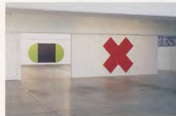
OLIVIER MOSSET, BLACK SQUARE , 1990, oil and acrylic on canvas, 84 x 168 1/4", RED CROSS , oil on canvas, 85 x 85" / SCHWARZES QUADRAT , Öl und Acryl auf Leinwand, 213 x 427,5 cm, ROTES KREUZ , Öl auf Leinwand, 215,5 x 215,5 cm, exhibition view / Ausstellungsansicht Galerie Susanna Kulli, St. Gallen.

Are we therefore to conclude that Mosset's trajectory has been erratic? No. Mosset doesn't fool around: he proceeds one step at a time, with circumspection, adjusting his work to situations and cultural contexts that are, by definition, constantly shifting. He retraces his steps if necessary, or abandons a path that a particular context has turned into an impasse. His practice only appears to be chaotic. As