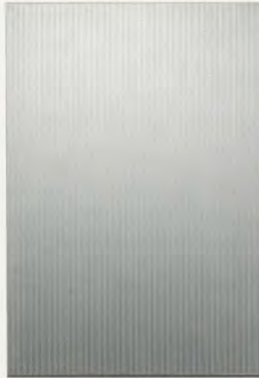
OLIVIER MOSSET, SECONDARY MARKET , 1988, acrylic on canvas, 121 1/2 x 83" / SEKUNDÄRMARKT, Acryl auf Leinwand, 304 x 211 cm.

Muss man daraus schliessen, dass Mossets Weg unsterblich verläuft? Nein, nur spielt Mosset nicht den Schlaumeier. Er schreitet gemessenen Schrittes voran, umsichtig, und er passt seine Arbeit der jewei-