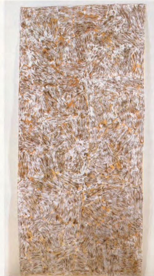
TANIA BRUGUERA, UNTITLED (18), 1998–99, coffee, cotton, linen paper, 118 x 47 1/4" / Kaffee, Baumwolle, Leinenpapier, 300 x 120 cm.

und 2002 verübt wurden, während auf einer erhöhten Plattform auf der gegenüberliegenden Seite des Raums zwei im Dunkel kaum erkennbare Schauspieler mit geschulterten Gewehren zackig auf und ab marschierten. Das gleissende Licht liess alle Eintretenden instinktiv die Hände schützend vor die Augen halten und machte so unversehens die Betrachter zu Akteuren.