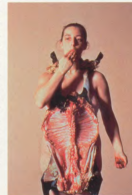
TANIA BRUGUERA, THE BURDEN OF GUILT, 1997–1999, performance scenes; decapitated lamb, rope, water, salt / DIE LAST DER SCHULD, Szenen aus der Performance mit enthauptetem Lamm, Strick, Wasser, Salz.