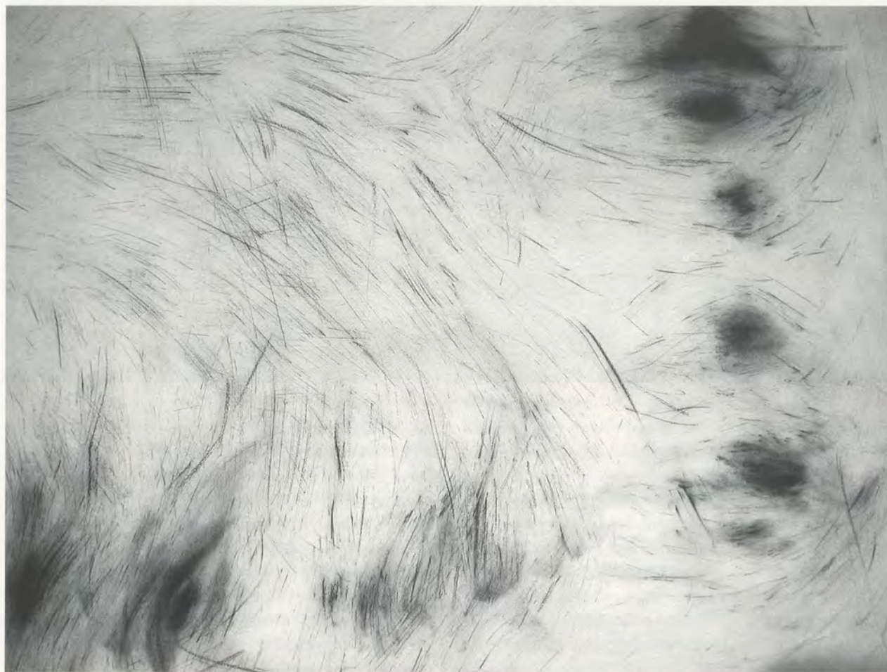
TANIA BRUGUERA, EYE STUDY FOR UNTITLED (KASSEL 2002), 2002, charcoal on paper, 40 x 60" / AUGENSTUDIE ZU OHNE TITEL (KASSEL 2002), Kohle auf Papier, 101,6 x 152,4 cm.

which she presented at Documenta 11, confronts the problem head-on; its ominous pitch-black room and alternating bright white lights, and its earsplitting amplification of marching footsteps and guns being cocked, speaks just as plainly of violence and terror in Cuba as it does of countless other countries where massacres have occurred in the name of politics, whether by government or freedom fighters. A video projection on one wall showed the names of towns and the years from 1945 until 2002 where such atrocities occurred, while on a raised platform on the opposite side of the room, two gun-toting performers, barely visible in the blackout, marched back and forth with military gaits. The blinding light caused all who entered to instinctively raise their hands to shield their eyes, initiating an unexpected action performed by the viewers.