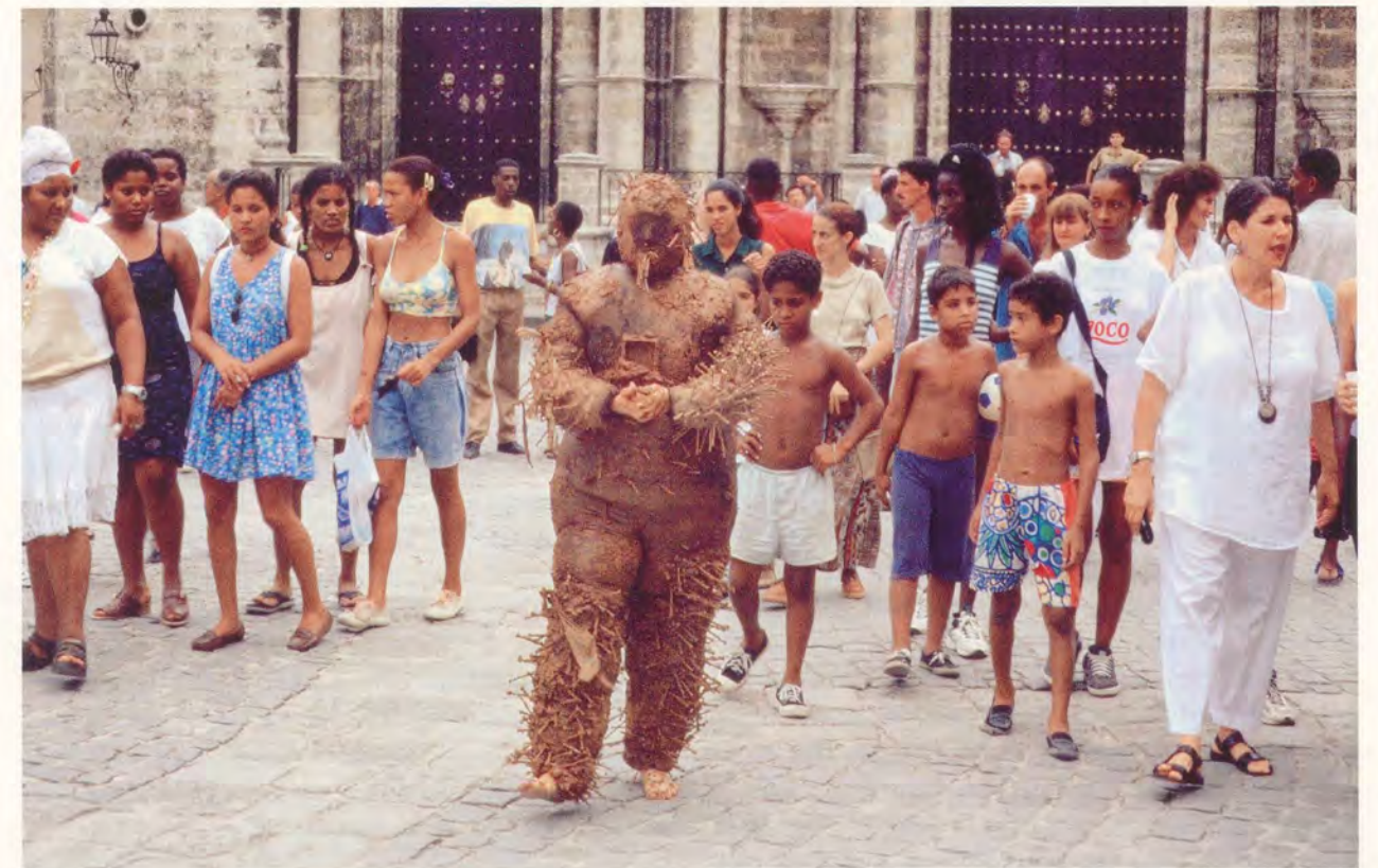
TANIA BRUGUERA, DISPLACEMENT, 1998–1999, performance, soil, glue, nails, fabric / VERTREIBUNG, Performance, Erde, Klebstoff, Nägel, Stoff.

gezeigte Performance BURDEN OF GUILT (Last der Schuld, 1997) gipfelte in einer Reihe überwältigend schöner Bilder, auf denen Bruguera, nur mit einem Lammkadaver bedeckt, die Hand zum Munde führt und ihn mit Erde füllt. Doch auch dieses schockierende Selbstporträt beruht auf einer politischen und menschlichen Tragödie, was BURDEN OF GUILT in ein bildhaftes Symbol für die Künstlerin und ihre Zeit verwandelt. Die Arbeit entstand in den späten 90er Jahren, einer Zeit, in der die wirtschaftlichen Zustände auf Kuba besonders erdrückend waren und «die Unterwerfung [unter das System] eine Frage des Überlebens». Bruguera musste vor einem Zensurkomitee erscheinen und Fragen über eine von ihr publizierte Kunstzeitschrift beantworten, die sie danach wieder einstampfen lassen musste. «Es war eine traumatische Erfahrung und eine Zeit lang hab ich überhaupt keine Kunst mehr gemacht, weil ich nicht