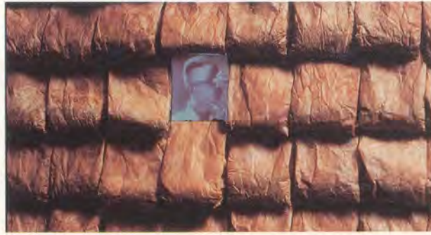
TANIA BRUGUERA, POETIC JUSTICE, 2002–2003.

Installation detail with LCD monitor, for over-all view see page 155 / POETISCHE GERECHTIGKEIT, Detail mit LCD-Monitor, ganze Installation Seite 155.