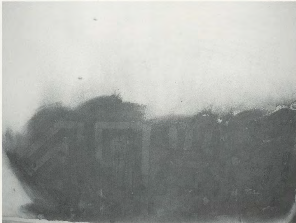
TANIA BRUGUERA, VIDEO STUDY III FOR UNTITLED (KASSEL 2002), Documenta 11, charcoal on paper, 40 x 60" / VIDEOSTUDIE FÜR OHNE TITEL (KASSEL 2002), Kohle auf Papier, 101,6 x 152,4 cm.