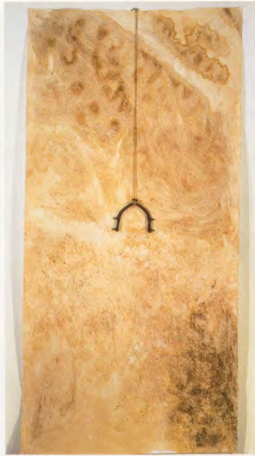
TANIA BRUGUERA, UNTITLED (16), 1998–99, coffee, iron, linen paper, 118 x 47 1/4" / Kaffee, Eisen, Leinenpapier, 300 x 120 cm.