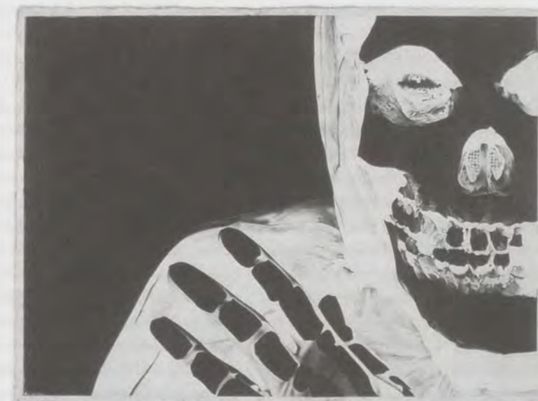
BANKS VIOLETTE, MISFITS (X-RAY), 2002, graphite on paper, 23 x 30" / Graphit auf Papier, 58,4 x 76,2 cm.

A rallying cry amongst purists in the heavy metal music scene is "death to false metal." This motto, while reeking a bit too much of sober rules, is nonetheless helpful in defining what is metal orthodoxy. It keeps fans and bands constantly on the alert for suspect motivations and tourists. A similar instinct could be helpful in the art world. Categorical knowledge of the history of any subject isn't necessary to derive influence from it, but in the case of mining subcultures for ideas, it just may approach prerequisite to at least be a flâneur about it—to have it naturally cross the radar of your everyday life and to not be a butterfly collector for the academy.