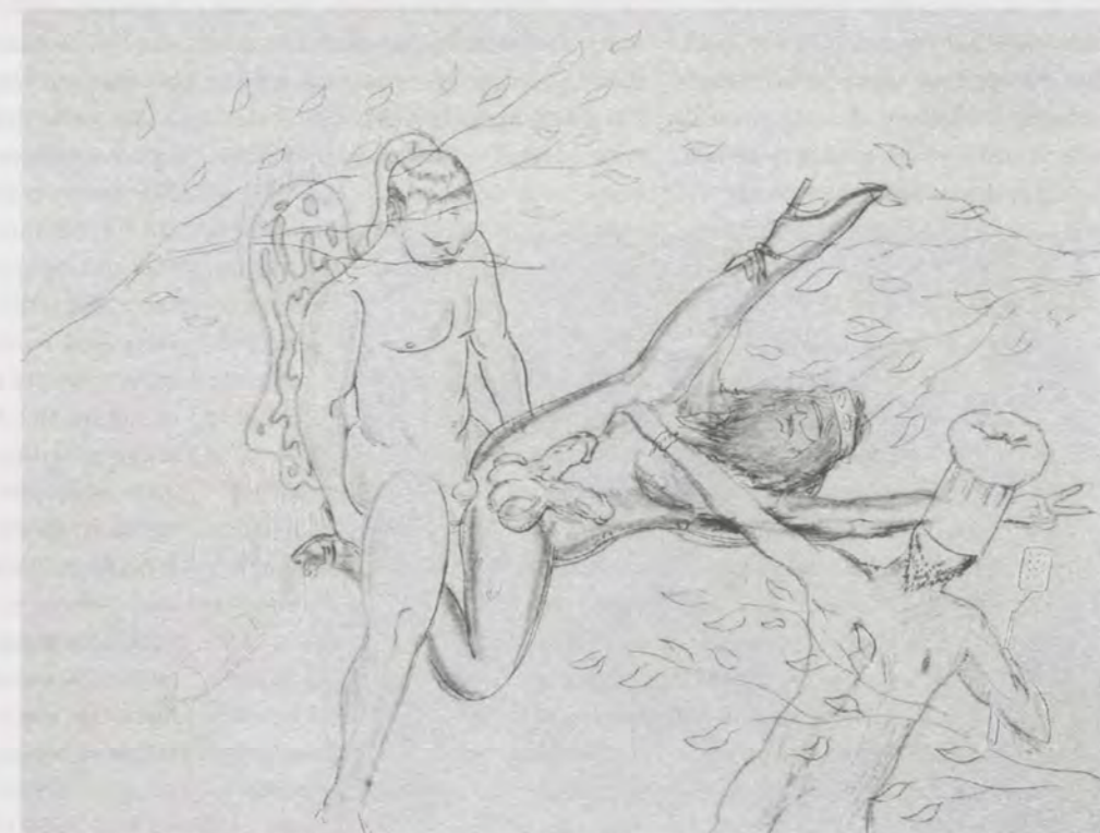
SPENCER SWEENEY, UNTITLED, 2003, colored pencil on paper, 11 x 13 1/2" / Farbstift auf Papier, 28 x 34,3 cm.

The tradition of personality embraced by Spencer Sweeney is much