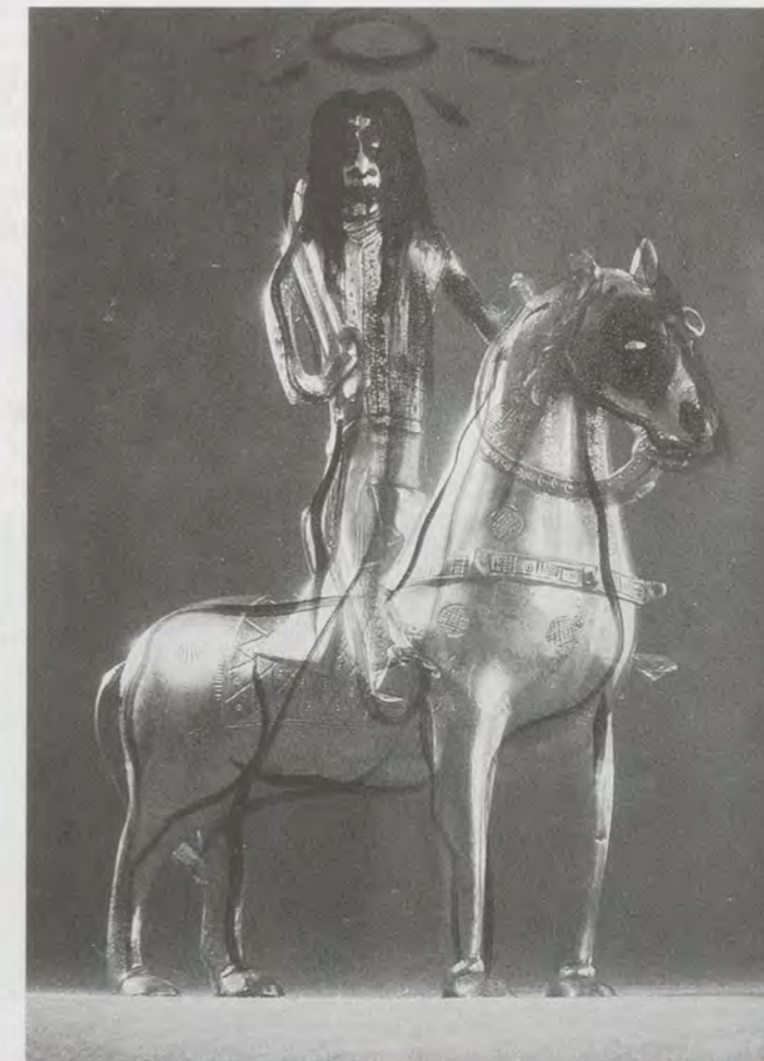
BJARNE MELGAARD, UNTITLED, 2001, oil on digital print on canvas, 27 1/16 x 19 1/16" / Öl auf Digitaldruck auf Leinwand, 70 x 50 cm.

reich. Authentizität – in dem Sinn, dass man von einer Sache nur sprechen darf, wenn man einen bestimmten Hintergrund hat und wirklich etwas dazu sagen kann – war in den 80er und 90er Jahren eine beliebte Waffe der Verfechter der political correctness . Der Begriff tendierte dahin, jeden Dialog und die reine Kunst sowieso von vornherein auszuschliessen. So viel dazu. Nun ist Heavy-Metal allerdings ein Lebensstil (Punk Rock wäre ein anderer), von dem man besser die Finger lässt, wenn man nicht wirklich damit vertraut ist und ihn über alles liebt.