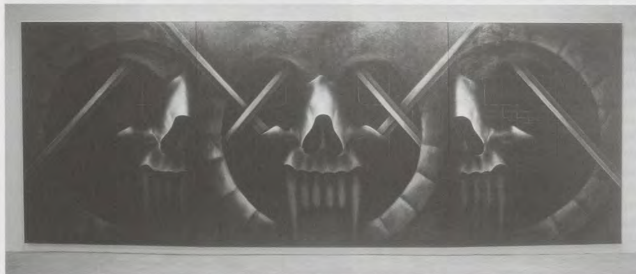
BANKS VIOLETTE, GONE (JOSEPH, FIORELLA, JACOB DELASHMEUTT, ROYCE CASEY), 2001–2002, oil on canvas, 76 x 204" / Öl auf Leinwand, 193 x 518 cm.