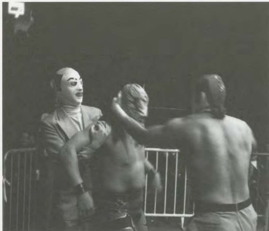
CARLOS AMORALES, MY WAY, Auditorio de Tijuana, 19.1.01, video still.

tunes; he expects the transient image of certain passions. Wrestling therefore demands an immediate reading of the juxtaposed meanings, (...) while on the contrary a boxing-match always implies a science of the future." 1)