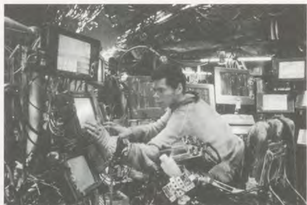
THE MATRIX, 1999, film still.

Einer meiner Photographiedozenten erzählte mir, er habe William Eggleston's Guide , einen 1976 veröffentlichten Katalog des Museum of Modern Art in New York – der mit dem riesigen Dreirad auf dem Einband –, neben dem Bett liegen und schaue ihn sich jeden Abend an und versuche etwas zu verstehen. 4) Damals war das neu. Es war anders. Aufgrund seines bisherigen Wissens ergab es nicht ohne weiteres einen Sinn. Doch irgendetwas daran hatte ihn berührt.