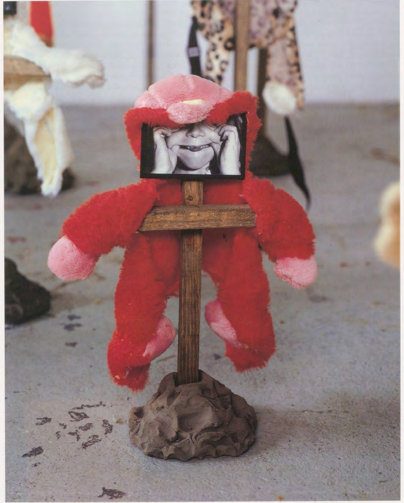
ANNETTE MESSAGER, 2 CLANS, 2 FAMILLES , 1997-98, detail, mixed media.