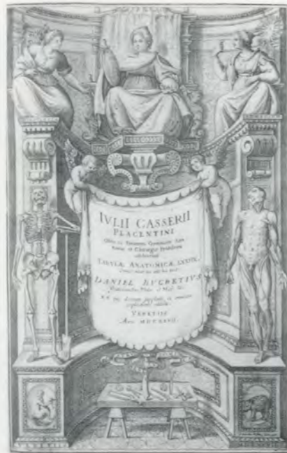
Title page from: Julius Casserius, "Tabulae Anatomicae," 1627 / Titelseite.

Neben der Vorliebe für «Rachedramen» ergötzte sich die Kultur des Barock bezeichnenderweise noch