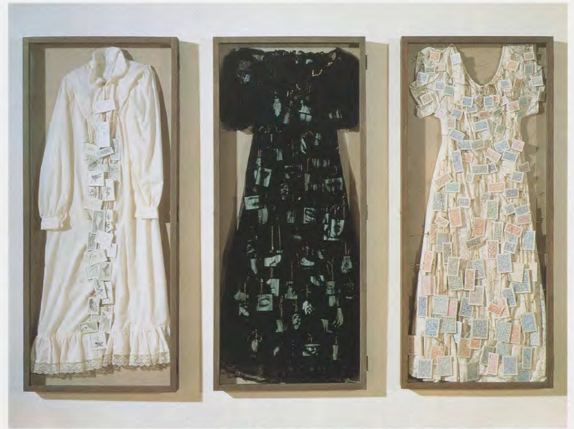
ANNETTE MESSAGER, HISTOIRE DES ROBES / DRESS HISTORY, 1990, dresses, drawings, photos in 3 display cases, 59 x 88 7/8 x 3" over all / GESCHICHTE DER KLEIDER, Kleider, Zeichnungen, Photos in drei Vitrinen, insgesamt 150 x 225 x 7,5 cm.

an einer weiteren theatralischen Präsentation der Vergänglichkeit des menschlichen Körpers: dem anatomischen Theater. Seziert vor einem Publikum gelehrter und wissbegieriger Männer, wurde der geöffnete, zwischen Tod und Leben «suspendierte» menschliche Leib zum Memento mori für die Lebenden. Auf einer berühmten Radierung des Leidener Anatomiesalls aus dem Jahr 1608 sehen wir im Publikum, das sich um die Bühne, auf der ein Anatom seine Kunst vorführt, versammelt hat, vereinzelt menschliche und tierische Skelette. Sie halten Bücher mit Inschriften, die vor der Vergänglichkeit der menschlichen Existenz und der Strafe warnen, welche die Menschheit am Tag des jüngsten Gerichts erwartet, während der Anatom den aufgeschnittenen weiblichen Körper mit einem Form und Anordnung der Organe beschreibenden Text vergleicht, den er dem Publikum sogleich erklären wird. Zur Unterstreichung der heiklen Verknüpfung von materialistischer und allegorischer Lesart des dargebotenen seziierten Körpers wird oben auf der Radierung nicht