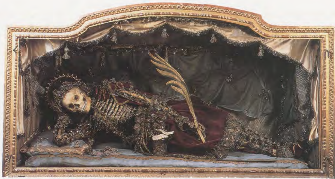
SAINT PROSPER / SANKT PROSPER, 1790, Tavel, Musée d'Art et d'Histoire, Fribourg.

allegorically as an emblem of the true meaning of human existence. Putting death on display performs a reference to man's sinful fall from paradise and his concomitant mortality, for which the cultural celebration of relics is a small antidote.