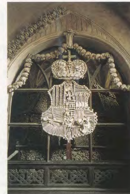
Two views of the chapel of Sedlec in Kutna-Hora, Czech Republic / Zwei Ansichten der Kapelle von Sedlec in Kutna-Hora, Tschechien.