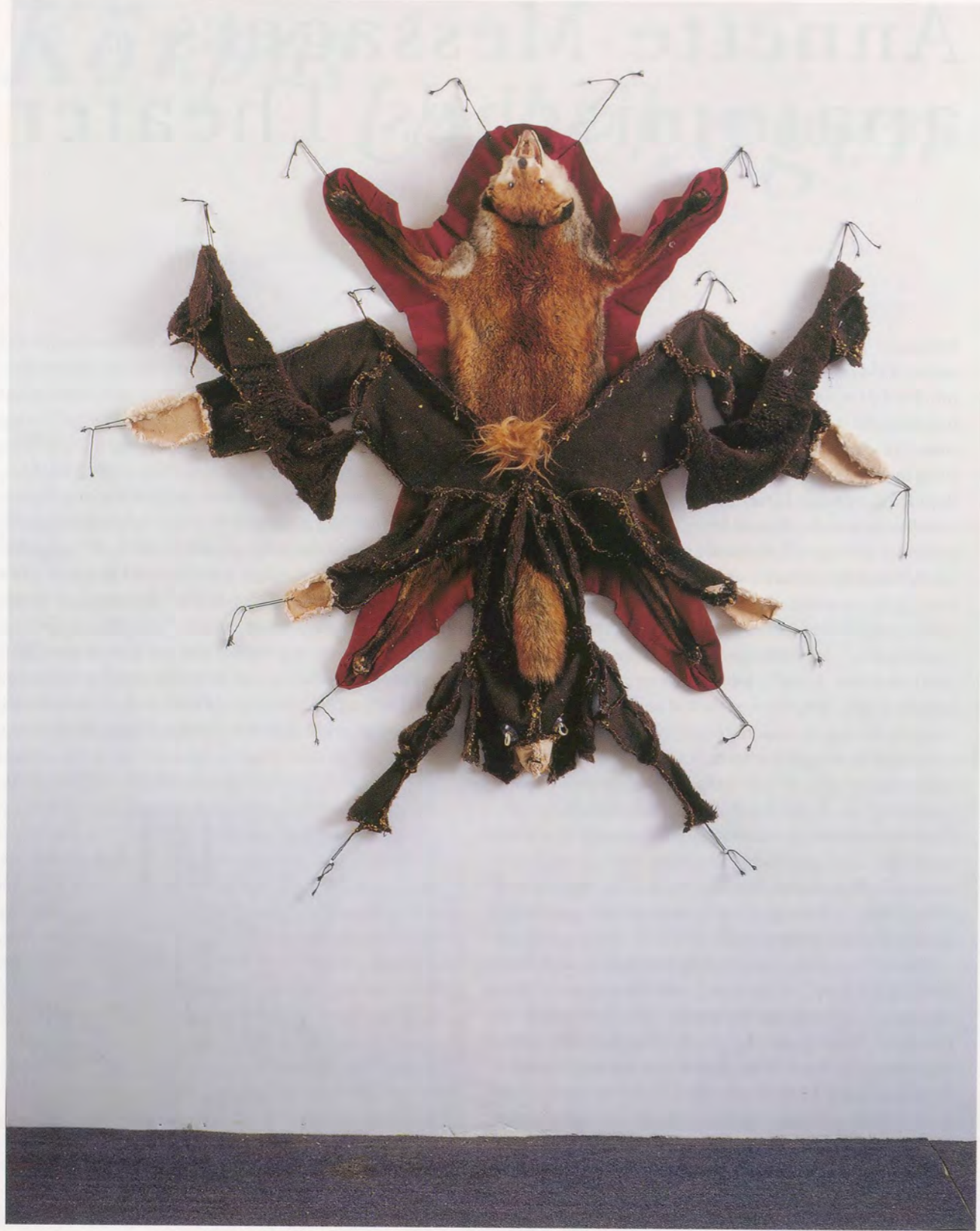
ANNETTE MESSAGER, ENSEMBLE , 1998, mixed-media, 59 x 61" / 150 x 155 cm.