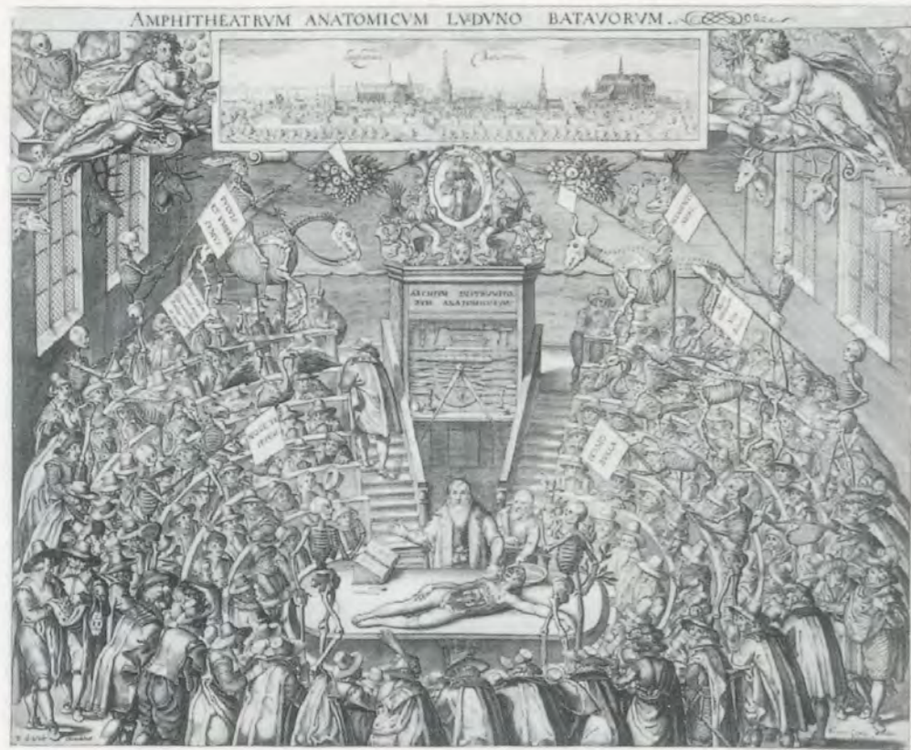
View of the Leiden anatomy theater, 1609 / Ansicht des Leidener Anatomiesalles von 1609. Beide Abbildungen stammen aus / Both images are taken from: Jonathan Sawday, "The Body Embazoned" (London/New York: Routledge, 1995).

erspiels vertritt Walter Benjamin die These, dass der Hang zum Emblematischen im Zeitalter des Barock auf der Überzeugung beruhte, das Organische müsse zerschlagen werden, damit «in seinen Scherben» die wahre Bedeutung «aufgelesen» werden könne. 1) Ausgestopfte menschliche Relikte und fragmentierte Körperteile werden genau deswegen bedeutsam, weil sich der menschlichen Gestalt in diesem Zustand der Auflösung eine zweite allegorische Bedeutung zuschreiben lässt, durch die der Körper eine allegorische Wiederauferstehung erfahren kann. Benjamin zufolge lässt sich die entscheidende Denkfigur des Barock wie folgt zusammenfassen: Die wahre Bedeutung der menschlichen Existenz beruht auf einer ästhetischen Inszenierung des – ausgestopften, ausgeweideten, zerstückelten – menschlichen Leichnams, die seine Erhebung zum Emblem der Sterblichkeit feiert: «Produktion der Leiche ist, vom Tode her betrachtet, das Leben.» 2)