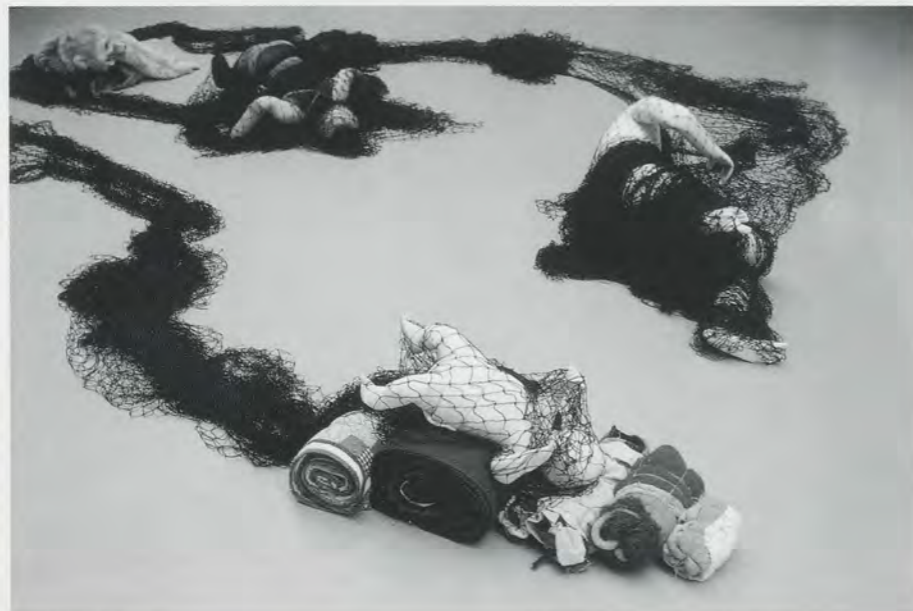
ANNETTE MESSAGER, LES REPLIQUANTS / THE REPLICANTS, 1999-2000, mixed-media series, ca. 16 1/2 x 16 1/2" / DIE REPLIKANTEN, aus der gleichnamigen Serie, 500 x 500 cm.

Die Künstlerin entwirft mit ihren säkularen Reliquien neue Geographien des Körpers und verweist dabei – auch wenn sie Gebilde herstellt, die sich als