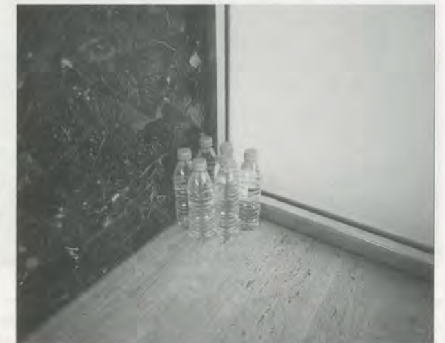
DOMINIQUE GONZALEZ-FOERSTER, TROPICALE MODERNITÉ, 1999, installation view / Detail der Rauminstallation.