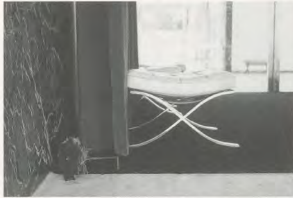
JEFF WALL, ODRADEK, 1999, installation view / Installation.

seiner Frustration schrieb er die folgenden Worte direkt auf eine der grossen Fensterscheiben: «Hier auf dieser Stelle sieht meine Zeichnung auf einmal wie eine Graffiti-Zeichnung aus. Was ich mir zu Hause mühevoll erarbeitet habe, wirkt hier wie fehl am Platz. Z.B. einfach SEX würde besser passen. Auf «Nummer Sicher» gehen und alles wieder wegwischen? (...) Aber mit meiner Handschrift sieht es immer gut aus. Doch dann mittelmässige Kunst? Aber kann, wenn man etwas auf der Scheibe des Pavillons Mies v.d.R. macht, kann das Kunst werden? Ohne Respekt drauflos?»