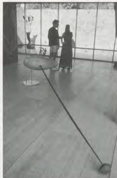
PANAMARENKO, NORDZEE , 1997, installation.