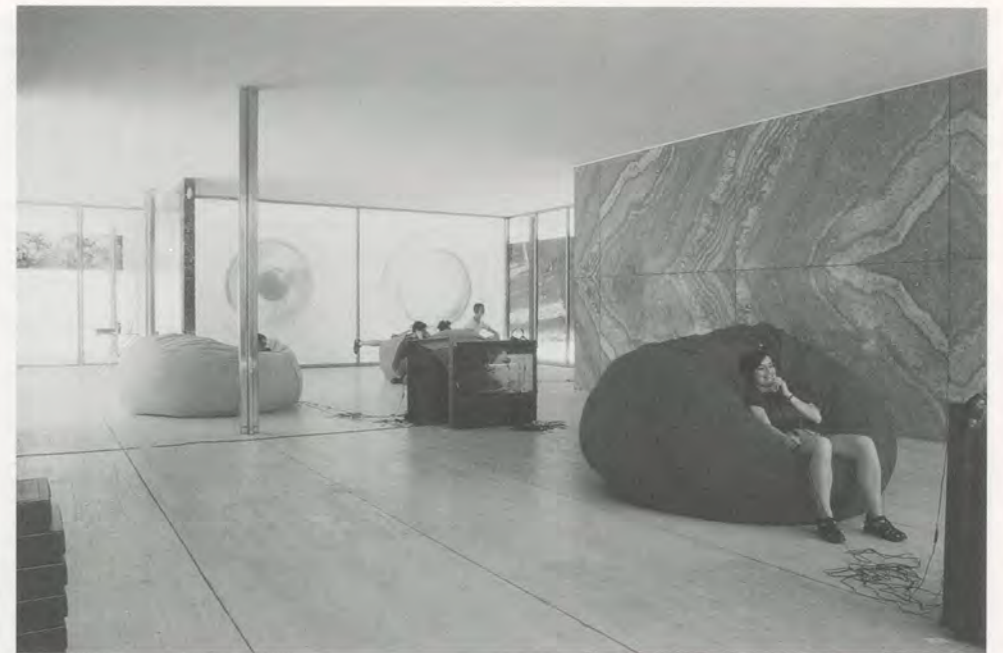
ART CLUB BERLIN, installation, 1998, with 2 large photos by Joachim Grommek, video library, and beanbags by Angela Bulloch / mit 2 grossen Photos von Joachim Grommek, Videothek und Sitzsäcken von Angela Bulloch.

Monuments like the Barcelona Pavilion undoubtedly need the input of contemporary interventions in order to remain "alive." We would all be sorry to see a symbol of avant-garde art and modern thinking turned into a sad, boring building, disconnected from the real world.