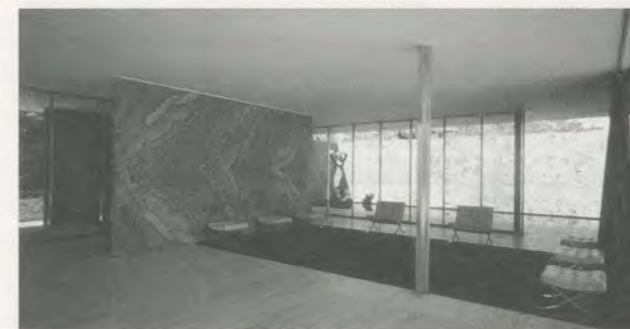
Fundació Mies van der Rohe, Barcelona: the building / das Gebäude.

capable of competing with the perfection of the building. People want more than a personal viewpoint; they are looking for a statement that can be compared to Mies’s famous declaration: “Less is more.” As a result, the artists feel a strong sense of responsibility. They know that they are confronting one of the most important architectural sites of the twentieth century. However, this is not completely true since the Pavilion as we know it today is a “model”—a contemporary copy. Never-