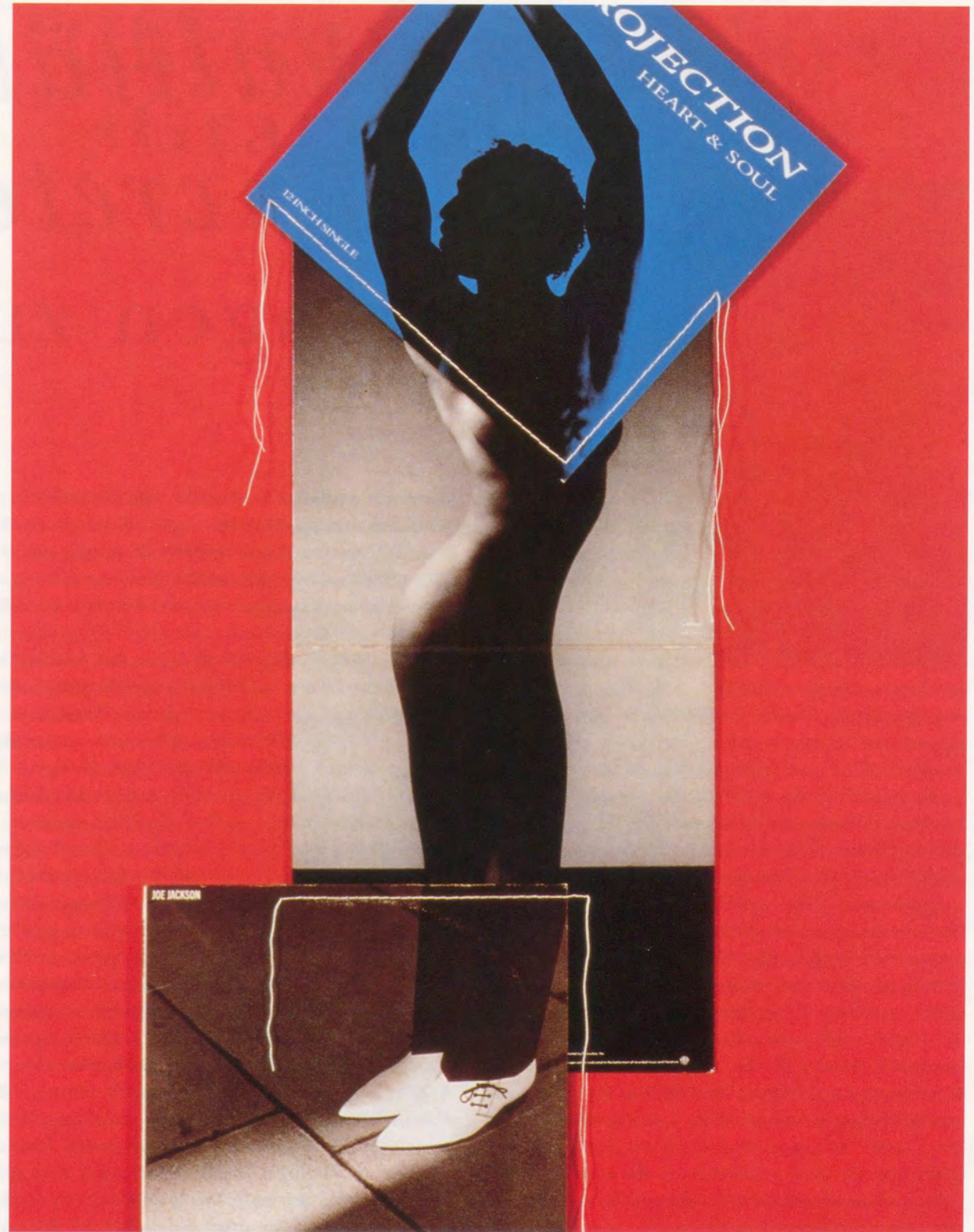
CHRISTIAN MARCLAY, LOOK SHARP, 1991, record covers and thread, 40½ x 20" / HEISS AUSSEHEN, Plattenhüllen und Bindfaden, 102,9 x 50,8 cm.