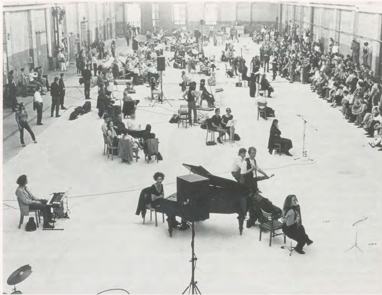
CHRISTIAN MARCLAY, BERLIN MIX, 1993, performance / BERLINER MIX, Performance im Strassenbahndepot, Berlin.

wollten, wie es klingt, wenn man eine Platte zerbricht, werden fasziniert sein von dem enormen Reichtum an rhythmischen, beinahe schon fugenähnlichen Beispielen dieser transgressiven Geste, die den dramatischen Höhepunkt der Performance darstellt. Weniger augenfällig ist, dass diese Geste, wenn auch unter strikteren Bedingungen, jene der Produktionsweise von Marclays Serie der Recycled Records (Rezyklierten Platten) aus den frühen 80er Jahren ist. Es handelt sich dabei um phonographische Montagen aus zerbrochenen und anschließend sorgfältig zurechtgeschnittenen und zu einem mosaikartigen Ganzen zusammengeklebten Platten. Auf eine Art, die an Milan Knizaks in den 50er Jahren angewandte Fluxus-Methoden erinnert, an das Versengen, Zerkratzen, Bemalen, Zerschneiden und Zusammenset-