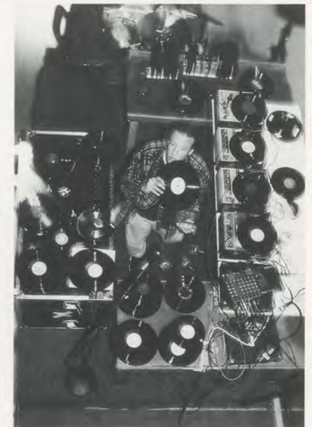
Christian Marclay, Art at the Anchorage, Creative Time, 1997.

Grammophon als Medium und Ort alternativer akustischer und visueller Experimente, unabhängig von den Jubiläumsfeiern, eine lange, bemerkenswerte, wenn auch oft unbeachtete Geschichte hat. Das erfreulich Unkonventionelle dieser kreativen Erforschung der Techno-Logiken des mechanisch reproduzierten Klangs durch verschiedenste künstlerische Verfahren – visuelle und akustische Performance, skulpturale und graphische Elemente (gelegentlich auch kombiniert) – mag zu ihrer Nichtbeachtung beigetragen haben; teilweise ist diese wohl auch auf ihre Unvereinbarkeit mit dem Hang zur Ausgrenzung einer in rigiden Kategorien denkenden Kunst- und Kunsthistoriker-Szene zurückzuführen. Doch trotz der Vernachlässigung durch die Kritik ist die kreative «Grammophonie» (in Ermangelung einer besseren Bezeichnung) ein erstaunlich vitaler und je länger, je mehr auch anerkannter Bereich der zeitgenössischen Kunst. Man könnte in diesem Zusammenhang über ein breites Spektrum