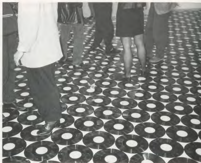
CHRISTIAN MARCLAY, FOOTSTEPS , 1989, 3500 vinyl records, installation, Shedhalle Zurich / SCHRITTE , 3500 Vinylschallplatten.

his "live" and his artefactual practices as performative presentations of the central semiotic signature of gramophonic inscription—that is the index.