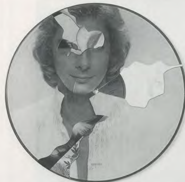
CHRISTIAN MARCLAY, RECYCLED RECORDS , 1984, collage / REZYKLIERTE SCHALLPLATTEN , Collage.

reflections on the techno-pragmatics of gramophonic vs. CD error production, see the discussion between Marclay and Tone in Music (NYC) No. 1 (1997), pp. 39–46.