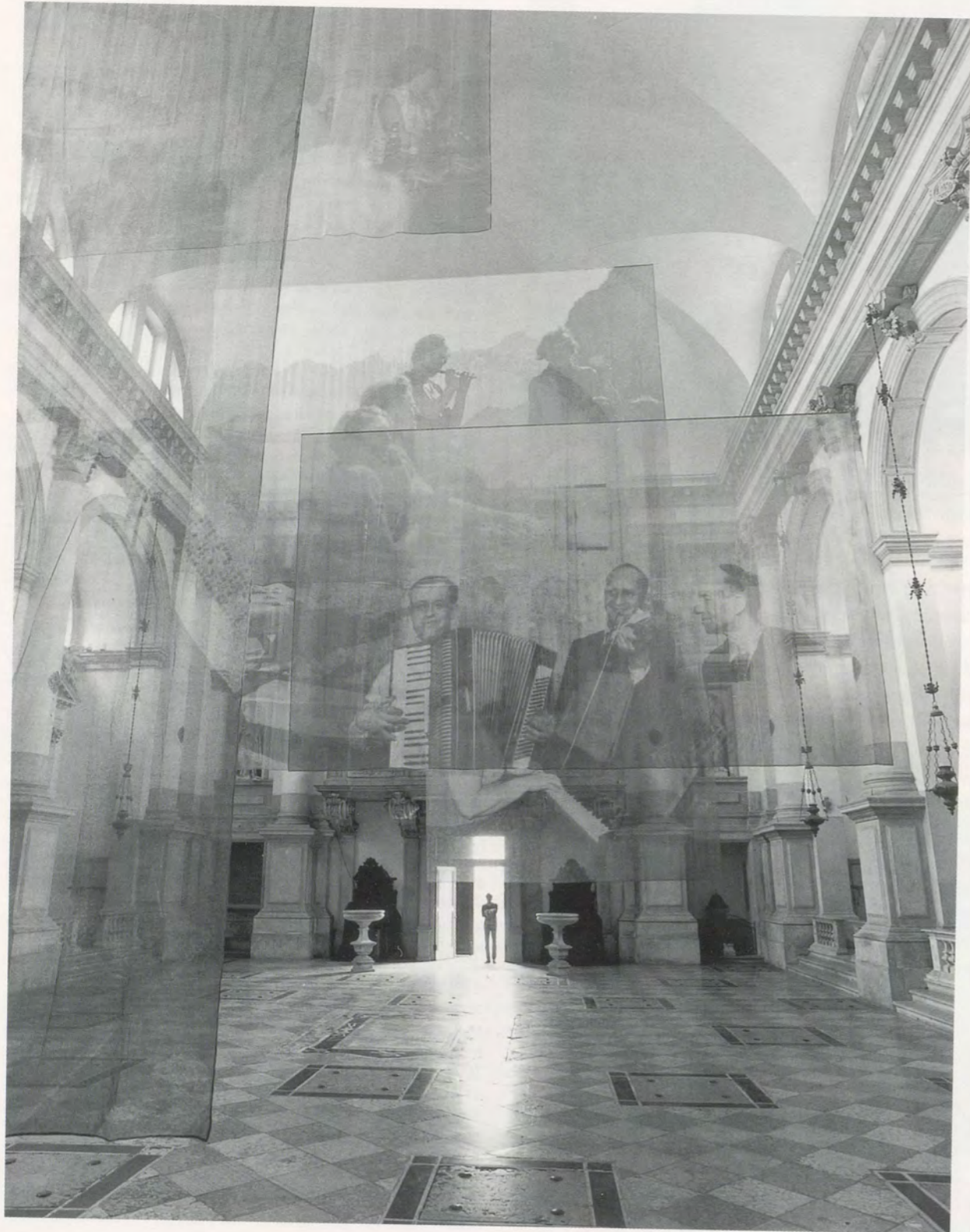
CHRISTIAN MARCLAY, AMPLIFICATION, 1995, mixed media installation with 6 found photographs and 6 photographic enlargements on serim, San Stäi, Venice Biennale 1995 / VERSTÄRKUNG, 6 gefundene Photos und 6 Vergrößerungen auf Baumwollgaze.