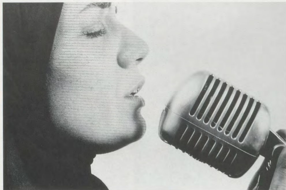
SHIRIN NESHAT, TURBULENT , 1998, video still.