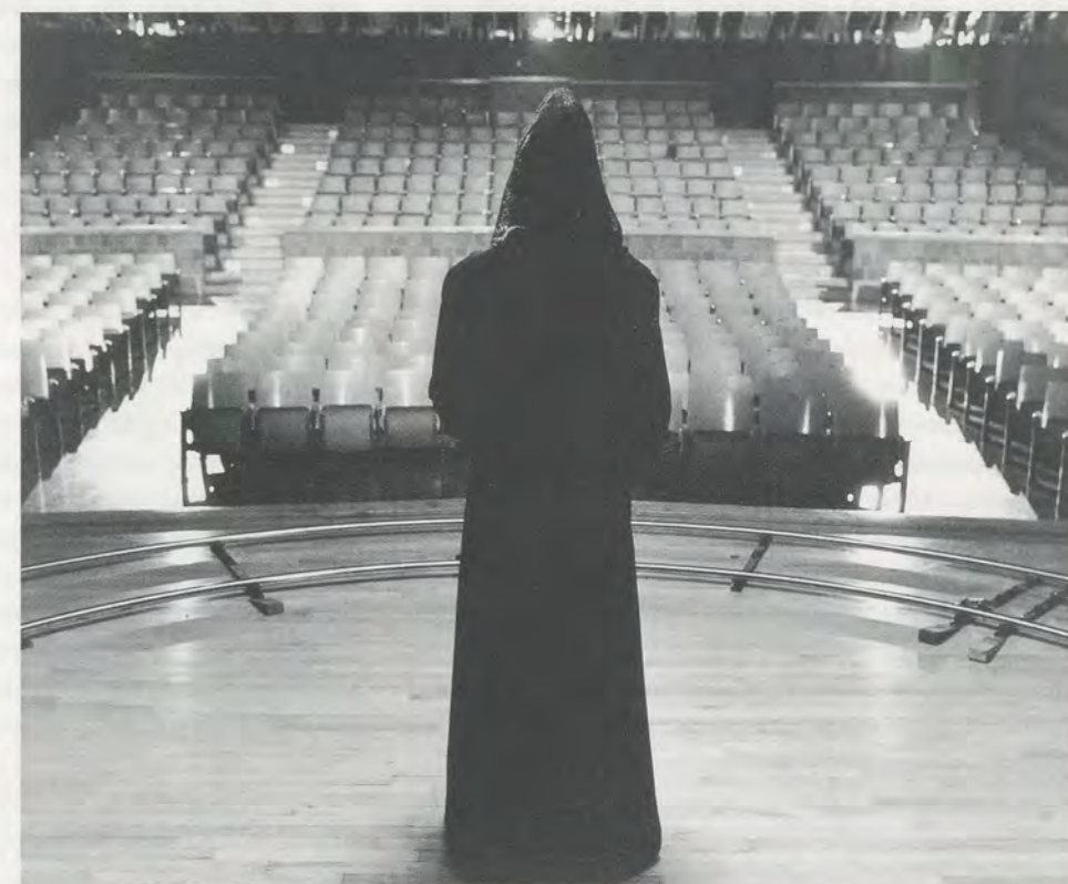
SHIRIN NESHAAT, TURBULENT , 1998, production still / Standaufnahme während der Produktion.

On the two screens, several of confluences make themselves felt. Free to act, the man is bound to repeat what is known and identifiable within the given musical traditions of his culture, whereas the woman, driven by a history of prohibition, is compelled to invent a form which expresses, explodes, and reconfigures sound in a visceral stream of abstract and universal potential. Historical and contemporary issues of mysticism in Islam, namely the denial of woman's mystical potential in Sufi thought, and the phenome-