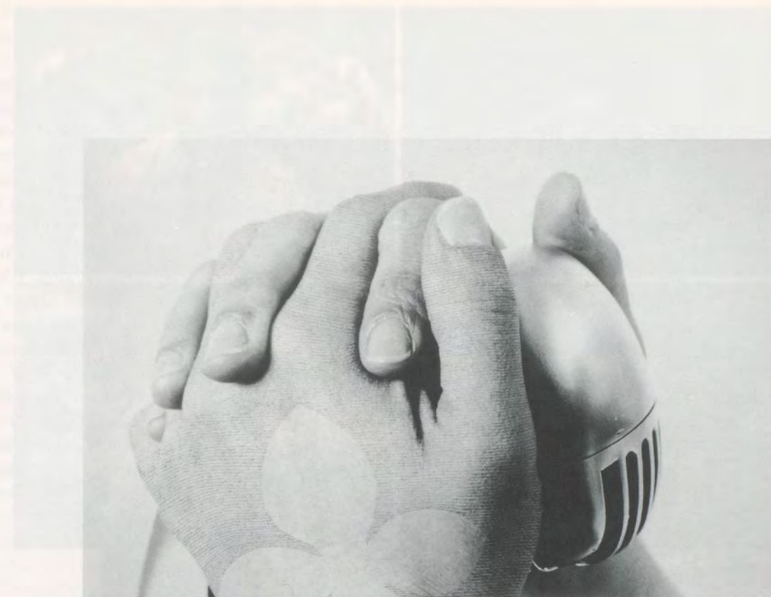
SHIRIN NESHAT, ON GUARD , 1998, black-and-white photograph from the series of the same title / AUF DER HUT , Schwarzweissphoto aus der gleichnamigen Serie.