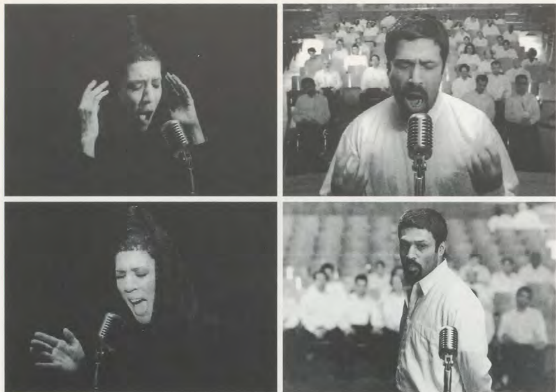
SHIRIN NESHAAT, TURBULENT , 1998, 3 video stills, 1 production still / 3 Videostills, 1 Standaufnahme während der Produktion.

In TURBULENT , permutations, codes of conduct, and cycles of representation find themselves in a state of charged indeterminacy. The formal placement of Neshat's observations of Iranian women in a world of culturally inscribed limitations and their subsequent transcendence from their milieu become the foundation of an esthetic based on a negotiation between the different screens. Invocations of masculine and feminine, presence and absence, sight and sound—all are tenuous links in a game of spectral projection. Neshat's scenario offers a kind of suspended intrigue between two protagonists: A man and a woman, two singers, two symbolic vectors, face the viewer's space from opposite sides of the room. The man performs a classical love song based on the Persian poet Rumi's concept of divine love before an appreciative all-male audience; the woman performs—which in Iran is strictly prohibited—to an empty theater, which fills with the shards of her astonishing voice. In TURBULENT there is no solid ground. All perception, actions, and meanings take