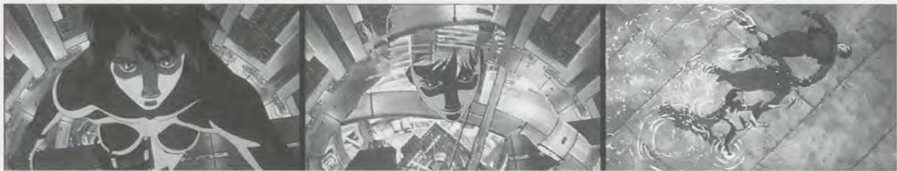
GHOST IN THE SHELL, 1995, computer animation stills.

In Thomas Bayle’s computer animation SUPERSTARS (1993), we see the most elevated of birthmarks (the face) as a surface to be mapped by elision. Animated loops of pop iconism (the Worldwide Wrestling logo, porno, airplanes) create the cellular structure for a series of human faces. The macro-to-micro modulations of the images are a real-time function, with distortion built into the matrix as a signal not of photo-realism but of the surface play of constantly reshuffled ones and zeroes. In