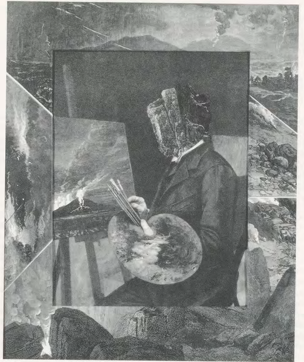
BRUCE CONNOR, PORTRAIT, 2/19/92, engraving-collage with Yes Glue 14 \frac{1}{2} x 12" / PORTRÄT, 19.2.92, Radierungscollage mit Leim, 36,8 x 30,5 cm.