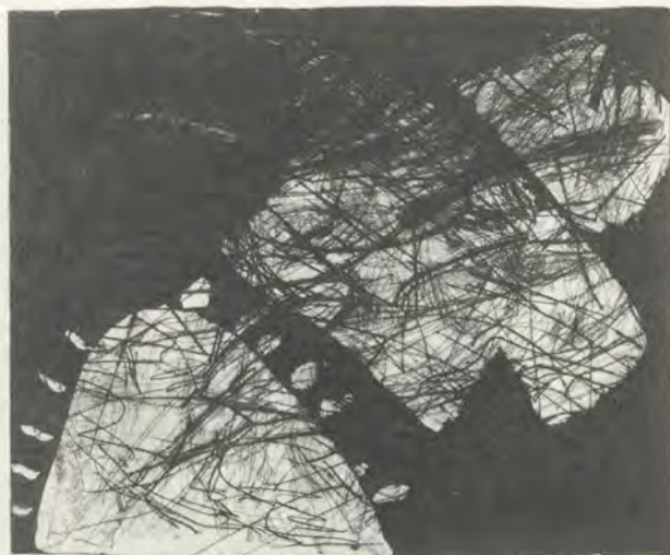
Ein Blatt aus dem Buch «Prototyper» (Auflage 19 Exemplare, erschienen bei Niels Borch Jensen und Susanne Ottesen, Kopenhagen 1983, mit 18 Graphiken, 38 x 28 cm). Auf alte Kaltnadelradierungen, die wie ein Netz die Kupferplatte überziehen, legte Kirkeby später eine zweite Ätzung in Zuckeraquatinta, welche die stark stilisierten Motive seiner Prototypen hervortreten lässt.

Darin eröffnet sich zweifellos die bezeichnende Überzeugung, dass geistige Offenheit und Zurückhaltung in der Aussage der Wahrheit näherkommen als die Einspurigkeit logischen Denkens. «Um die Mehrdeutigkeit des Geistes und der Natur zu wahren und die Fallen des Denkens zu vermeiden.» ( Bravura )