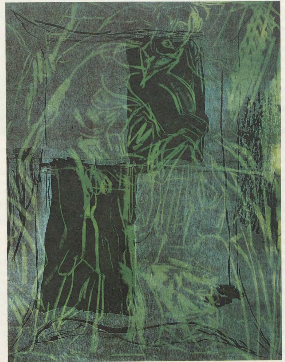
Per Kirkeby, Figur und Baum, Radierung und Holzschnitt, 88 x 66,6 cm, aus der Mappe Per Kirkeby, 6 Kupferdrucke/Linolschnitte/Holzschnitte, Kopenhagen 1983.

Per Kirkeby, Still-life in Tree, woodcut and linocut, 35 2/5 x 27 1/2 ", from the portfolio «Per Kirkeby, 6 Copperplate Etchings/Linocuts/Woodcuts» Copenhagen, 1983.