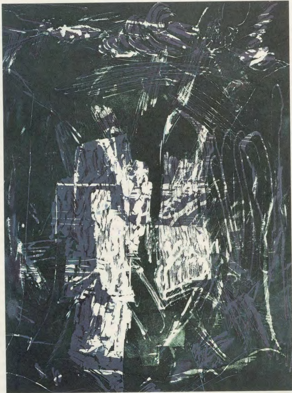
Per Kirkeby, Stilleben im Baum, Holz- und Linolschnitt, 90 x 70 cm, aus der Mappe Per Kirkeby, 6 Kupferdrucke/Linolschnitte/Holzschnitte, Kopenhagen 1983.

Per Kirkeby, Still-life in Tree, woodcut and linocut, 35 2/5 x 27 1/2 ", from the portfolio «Per Kirkeby, 6 Copperplate Etchings/Linocuts/Woodcuts» Copenhagen, 1983.