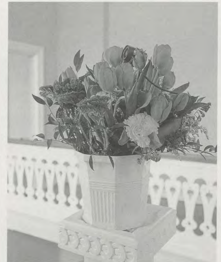
TONY OURSLER, Versteckte Videokamera in Blumenstrauß / Hidden video camera in bouquet of flowers, Installation in «Privat», 1993, Moss, Norwegen / Norway.