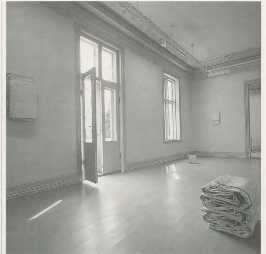
LAWRENCE CARROLL, Installation in «Privat», 1993, Moss, Norwegen / Norway

Eine Möglichkeit ist, das Grandiose durch das Bescheidene, Intime und Private zu ersetzen. Und was ist das Pri-