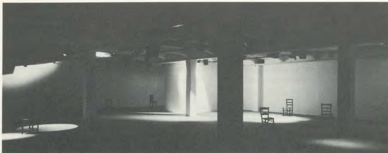
JOHN CAGE, ESSAY , FUNDACIÓ ESPAI POBLENOU, BARCELONA, 1991, (PHOTO: MASSIMO PIERSANTI)

world without references, such as ours, this imperative – unable to support either “agitation” or the desperate search for “difference” – rather sustains something as elementary as the libertarian affirmation of knowledge and creation, today apparently within everyone’s reach. However, the present-day atmosphere of discursive liberty – which, rather than having been deliberately sought, has come into being in an unforeseen manner – has revealed an unanticipated general impoverishment of the creative will which takes the form of an absenteeism bordering on frivolity when it comes to assuming the most natural implications of the human condition. This defeatism has solid footholds in the socio-cultural structure that enlightened modernity has been constructing laboriously for over two centuries, almost to the critical point of invalidating its own achievements.