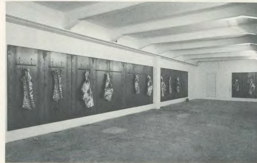
JANNIS KOUNELLIS, FUNDACIÓ ESPAI POBLENOU, BARCELONA, 1989, (PHOTO: GASULL)

pulse ihrer Ausdrucksformen dazu, sie fortbestehen zu lassen. Diese unauffhaltsame Fortsetzung erfolgte durch die Institutionalisierung der Trennung zwischen der Kunst und ihren natürlichen Instrumenten – Individuen –, nicht aufgrund der verunglimpften «Laientheologie» früherer Zeiten, sondern aufgrund der Befehle ihrer mächtigen direkten Nachfahren, seien es Märkte oder politische Bürokratien, die beide miteinander verbunden sind und um die «Struktur» wissen, die zur