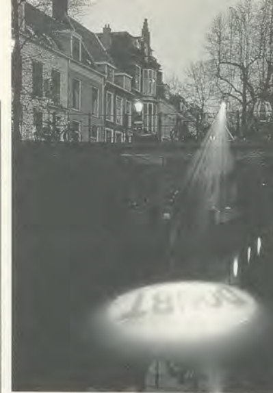
EXHIBITION NIGHT LINES, UTRECHT, 1991. NANCY DWYER, SHADOW OF A DOUBT/ SCHATTEN EINES ZWEIFELS.

Two other significant reasons for the project's success were the city's highly accessible scale and the relatively small number of artists included. Of the total twenty-five artists who actually took part in Night Lines , only three of these produced work to be shown within museum spaces. Of the remaining twenty-two projects, virtually all came about as a result of the artists' visiting the city at least once, several months in advance, to secure the sites and develop their proposals.