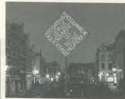
EXHIBITION NIGHT LINES, UTRECHT, 1991, IAN HAMILTON FINLAY, IT'S IN THE MARKET PLACE THAT ONE MORE OFTEN MEETS RECLUSED PEOPLE / AUF DEM MARKTPLATZ TRIFFT MAN DIE ABGESCHIEDENEN LEUTE AM HÄUFIGSTEN.

Sjarel Ex, der Direktor des Centraal Museum, scheint dem Beispiel von Jan Hoet zu folgen, wenn er seine Projekte von einer Kommission organisieren lässt; noch mehr scheint er aber darauf bedacht zu sein, nicht sich selbst, sondern das Projekt ins Rampenlicht zu stellen. Sowohl das Konzept für Night Lines – um Sprache kreisende, standortspezifische Installationen, die nur nachts zu sehen waren – wie auch die Auswahl der Künstler sind der Verdienst von Ex und seinen Mitarbeitern. Ex teilte die Verantwortung für Night Lines mit vier anderen Leuten und vermied dadurch das unerfreuliche (aber immer häufigere) Vorkommnis, dass