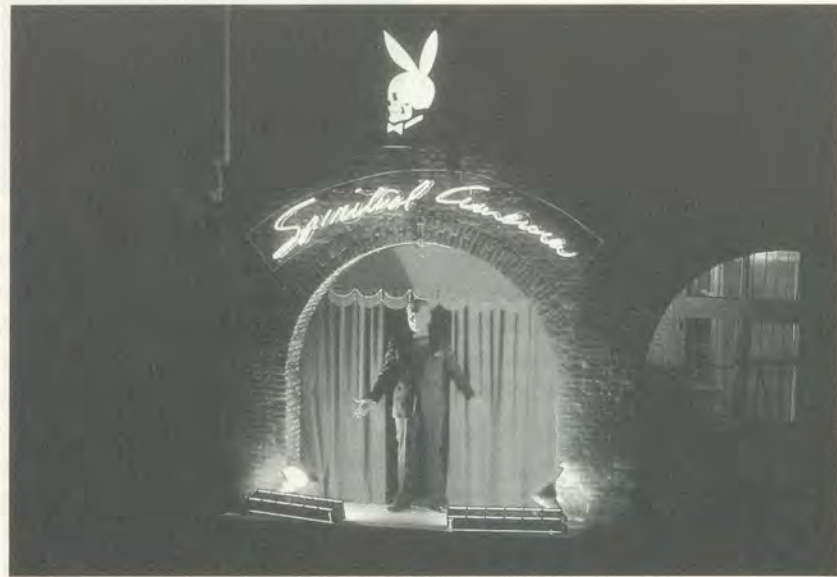
EXHIBITION NIGHT LINES, UTRECHT, 1991.