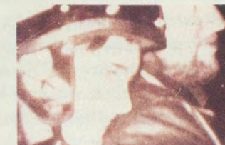
RICHARD PRINCE, LIVE FREE OR DIE, 1986, Ektaacolor print, 86 x 48 "/>