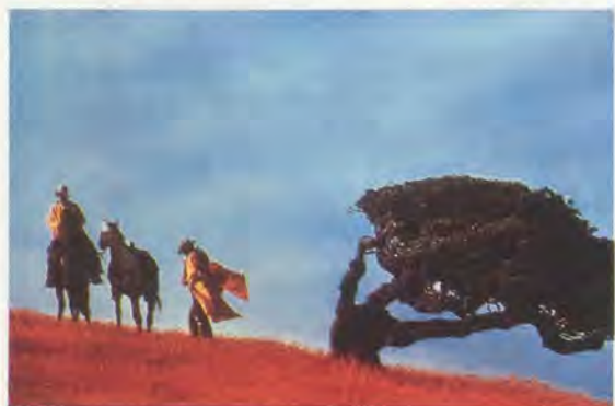
RICHARD PRINCE, UNTITLED (COWBOYS), 1989, Ektacolor print, 47 3 / 8 x 71 1 / 2 x 121,3 x 180 cm.

ers a mechanism for producing a very specific and enormously powerful sense of self — of one's place in time, in relation to others, and in relation to pleasures — and details its effects.