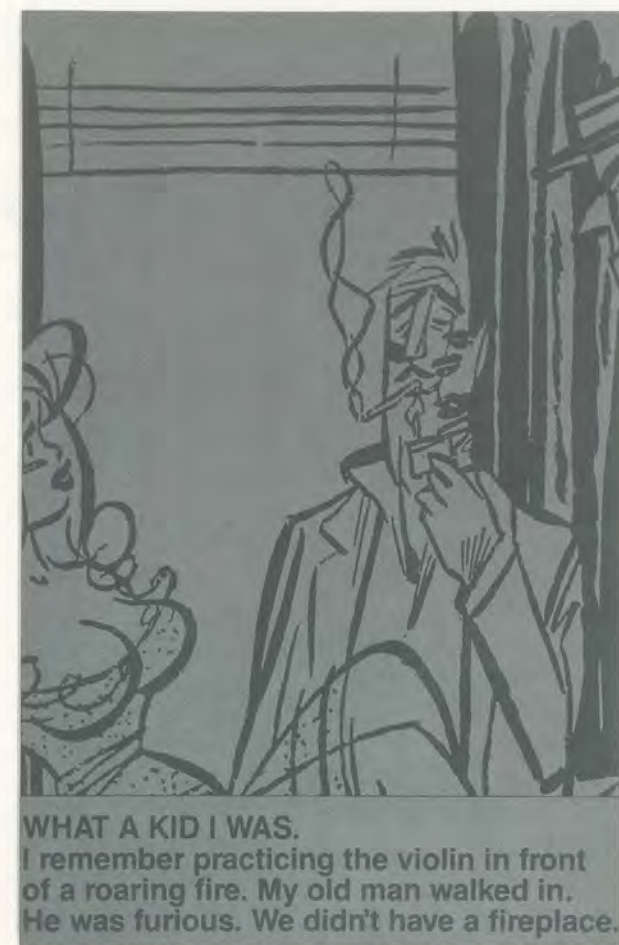
WHAT A KID I WAS. I remember practicing the violin in front of a roaring fire. My old man walked in. He was furious. We didn't have a fireplace.

Jaques, in As You Like It , begins his speech on the seven ages of man by noting that all the world's a stage. So it is, at least as soon as art is made: that is the fiction that is always left, that is inescapable. De Niro (like Caulfield, like Prince) is a character, the bullet a prop, the movie an artifact, and the acting carefully tailored to create an effect of the real. Indeed, few effects within the framed space of the narrative arts are more exacting, more crafted than those which