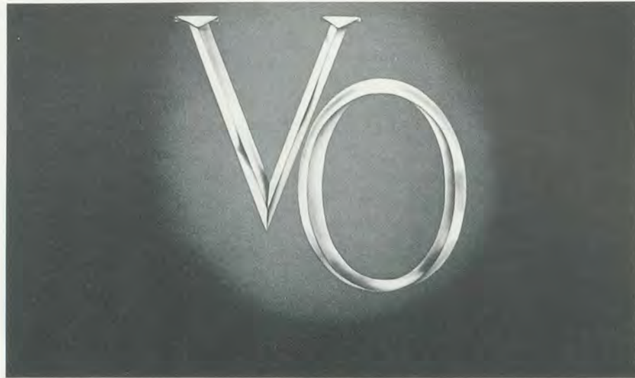
RICHARD PRINCE, UNTITLED (LABEL), 1977, Ektacolor print, 20 x 24"/OHNE TITEL (LABEL), 1977, 51 x 61 cm.

Privatschul-Rebell dar. Beiden gelingt ein bemerkenswerter Realismus, doch dieser Realismus ist ein Effekt, eine Negierung der Fiktion innerhalb der fiktionalen Literatur ( Der Fänger im Roggen beginnt mit einer Anspielung auf «all dieses David Copperfield-Zeug»), ein Paradox, demzufolge Literatur Realität anstreben sollte (genau diese Aufgabe erfüllt gemäss Wallace Stevens die Höhere Fiktion). Princes Pseudointerview mit J.G. Ballard – letzterer stellt die Fragen – ist ein kleines Meisterwerk in diesem Bereich, eine Art schriftstellerisches Trompe-l'œil . So ist selbst der leicht süffisante, neunmalklugen Ton von Princes Arbeiten eine sublimale Leistung; er trifft nämlich genau die Stimmung eines Teenagers, der sich zu angewidert fühlt, um den Lockungen der Kultur seiner Eltern auf den Leim zu gehen, und zu intelligent ist, um auf diejenigen seiner eigenen Kultur hereinzufallen. An einer kürzlich durchgeführten Ausstellung von Gemälden, verworrenen Bildern, die von hingekritzelteten Witzzeichnungen, Filmschnipseln und Songtexten der Gruppe Jane's Addiction umrahmt waren, konnte man auch die folgenden schockierenden Zeilen lesen: «Warhol war ein langweiliger Scheisskerl, genauso wie seine beschissenen Freunde und doofen Arschlöcher von Fans. Ich bin froh, dass er tot ist.» Doch Prince befin-