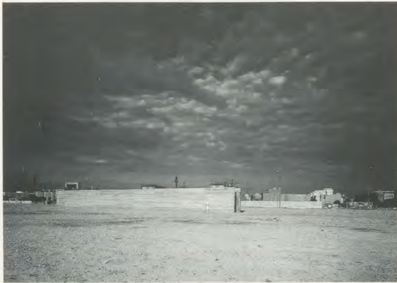
ILYA KABAKOV, ZWEI ERINNERUNGEN AN DIE ANGST / TWO MEMORIES OF FEAR, POTSDAMER PLATZ, 1990.

die auch in ästhetischer Hinsicht eine Begegnung herstellt zwischen dem seelenlosen Materialismus der westlichen Wegwerfgesellschaft und der puren Not des materiell noch unterversorgten Ostens.