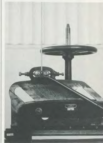
REBECCA HORN, DER RAUM DES VERWUNDETEN AFFEN / THE ROOM OF THE WOUNDED MONKEY, BERLIN, 1990.

ing aware of its own finiteness and beginning once more to take stock of its social context.