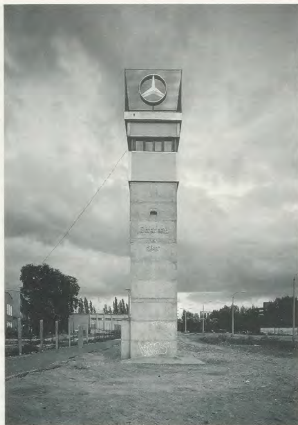
HANS HAACKE, DIE FREIHEIT WIRD JETZT EINFACH GESPONSERT - AUS DER PORTOKASSE / NOW FREEDOM IS SIMPLY SPONSORED - OUT OF THE PETTY CASH, BERLIN, 1990.

Boltanski's and Kabakov's installations are intended not only for