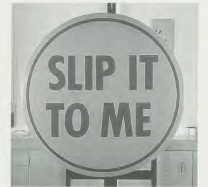
RICHARD HAMILTON, EPIPHANY, 1964, cellulose on aluminium, 45"/EPIPHANY, Cellulose auf Aluminium, 114 cm.

Im nachhinein lässt sich Hamiltons Werk nicht ganz so leicht einordnen: das Pop-Etikett ist nicht nur zu eng, sondern auch unzutreffend geworden. Im Zentrum seiner Arbeit liegt eine unerschütterliche, wenn auch paradoxe Treue zu einem Begriff von Malerei, der sie den Schönen Künsten zurechnet und der für Hamilton den ehrgeizigen Glauben an die Möglichkeit beinhaltet, ihre dahindämmernde Fähigkeit zu unüberhörbaren Aussagen über die Wirklichkeit wiederzubeleben, eine Fähigkeit, die eng mit ihrem mythenschaffenden Potential zusammenhängt. Das mag insofern paradox klingen, als viele seiner künstlerischen Aktivitäten sich stets über Kanäle geäussert haben, die nicht eigentlich der Malerei zugerechnet werden, also nicht bloss über verschiedene Formen der Druckgraphik, sondern über Photographie, verschiedene Typen von multi-ple s, Schreiben und selbst Industriedesign; paradox