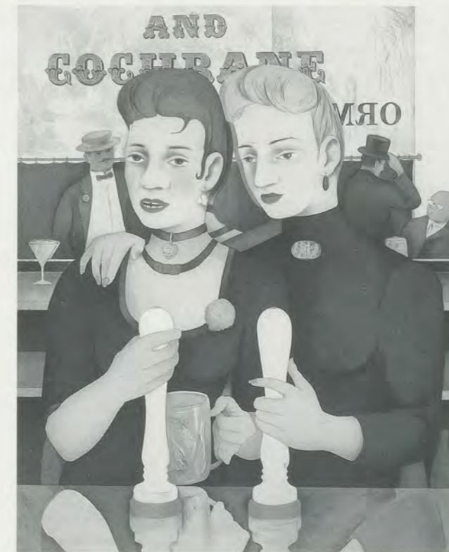
RICHARD HAMILTON, BRONZE BY GOLD , 1985–87, colour etching in 23 colours from 5 plates, 20 3 / 4 x 19 3 / 4 ” (PLATES); 30 x 22” (SHEET)/ BRONZE MAL GOLD, Radierung aus fünf Platten in 23 Farben, 53 x 42,5 cm (PLATTE); 76 x 56 cm (BLATT).

to invoking art’s highest aspirations as they are traditionally manifest in the conventions of history painting. The impetus for this comes partly from the recognition that while the traditional genres have a revered lineage in Western art many of them have lately become all but redundant: to grapple with them becomes therefore a challenge to update them, to render them, however temporarily, viable, and, equally