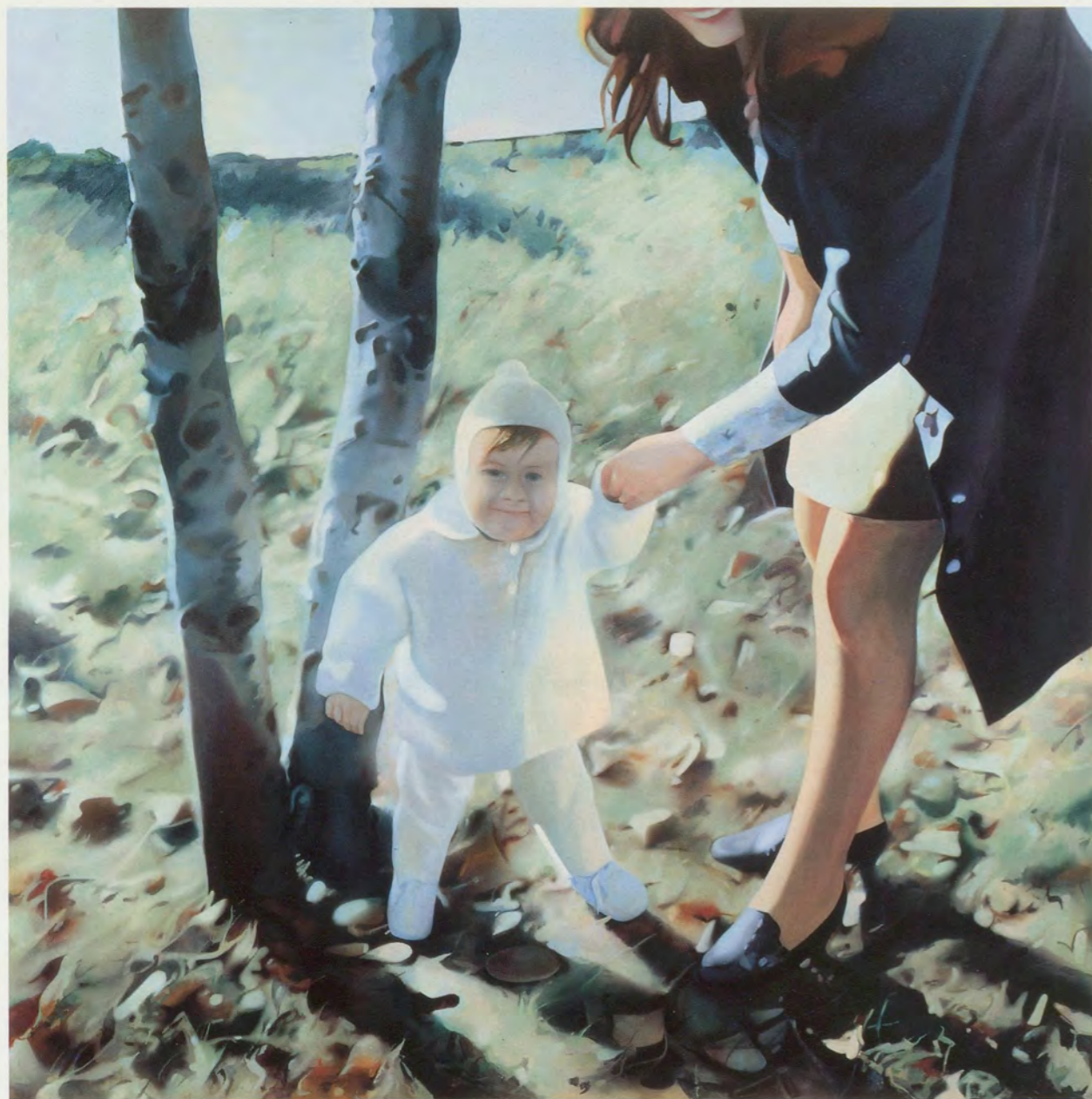
RICHARD HAMILTON, MOTHER AND CHILD, 1984-85,

oil on canvas, 59 x 59"/MUTTER UND KIND, Öl auf Leinwand, 150 x 150 cm.