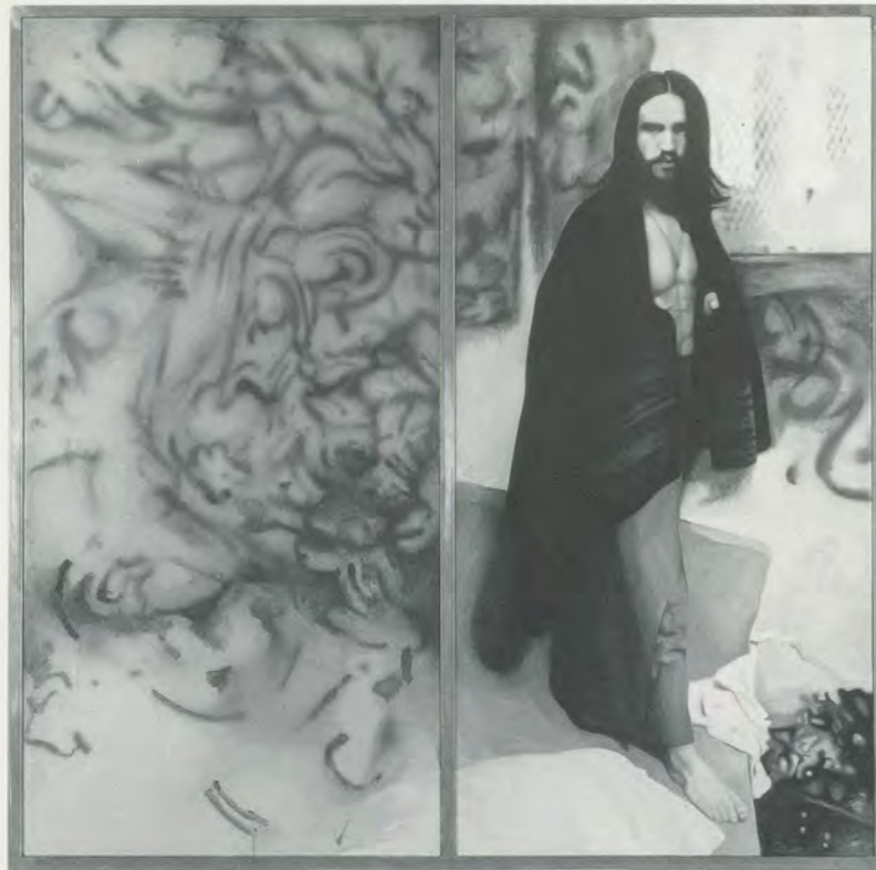
RICHARD HAMILTON, THE CITIZEN , 1982–83, oil on two canvases, each 78 3 / 4 x 39 1 / 4 ”/DER BÜRGER, Öl auf zwei Leinwänden, je 200 x 100 cm.

genres and activities, Hamilton did not see the creative process as significantly or qualitatively different from one sphere to the next: for him, “Domestic appliances, audio equipment, chairs, automobiles, planes, computers have been submitted to some of the best and most inventive minds of our time; for me to place the achievement of a few industrial designers above that of most practitioners in the fine arts