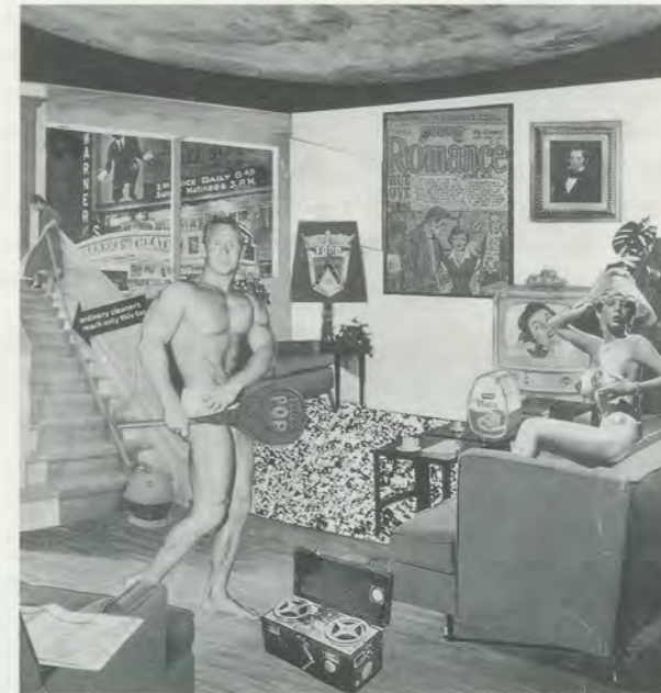
RICHARD HAMILTON, JUST WHAT IS IT THAT MAKES TODAY'S HOMES SO DIFFERENT, SO APPEALING?, 1956, collage, 10 1/4 x 9 3/4" / WAS IST ES NUR, DAS HEUTZUTAGE DAS HEIM SO ANDERS, SO ANSPRECHEND MACHT?, Collage, 26 x 25 cm.

His preoccupation with contemporary visual modes has a two-fold character: it embraces the unprecedented range of newly available imagery, especially that found in the rapidly expanding realm of the mass media but, equally, it is concerned with codes of perception, with innovations in the languages and processes by which these novel subjects take on two-dimensional form. An enthusiastic yet astutely analytical response to the pervasive transformative character of this proliferating reproductive technology became the hallmark of the discussions, exhibitions, and other communal activities that engaged Hamilton and his peers in the Independent Group in Britain in the mid-fifties. 3) It contributed in turn to his being considered a founding figure of the Pop movement. Indeed his collage, JUST WHAT IS IT THAT MAKES TODAY’S HOMES SO