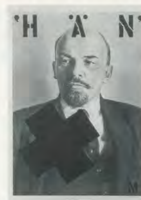
KIMMO SARJE, "HE" FROM THE SERIES NOSTALGIA FOR AVANT-GARDE / "ER" AUS DER SERIE SEHNSUCHT NACH DER AVANTGARDE, 1989, ACRYLIC ON POSTER, ACRYL AUF PLAKAT, 35 1 / 2 x 23 1 / 2 "/90 x 60 cm.

Auch in meinen eigenen Werken habe ich alte finnische Mythen kommentiert. «Birke und Stern» heisst eine kleine geometrische Collage von mir aus dem