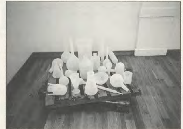
TONY CRAGG, SILICATE, 1988,

SAND BLASTED GLASS/SANDGESTRAHLTES GLAS.