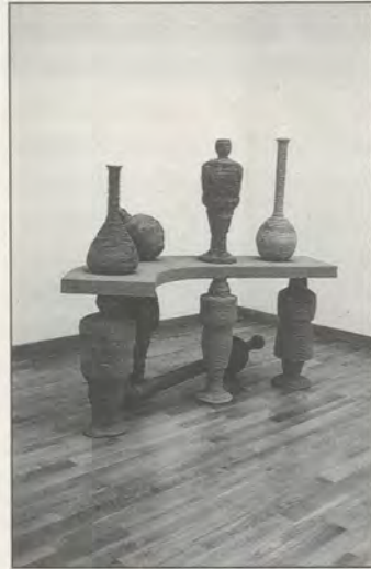
TONY CRAGG, BENCH / BANK , 1988, TURNED SANDSTONE / GEDRECHSELTER SANDSTEIN .