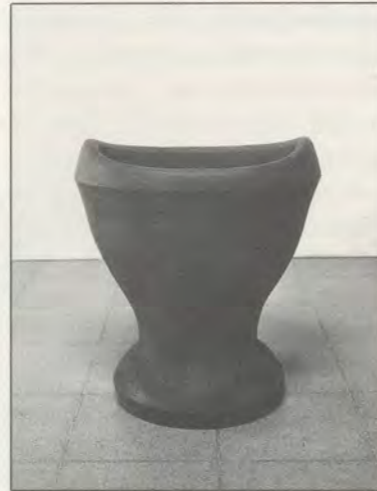
TONY CRAGG, EYE BATH / AUGENBAD , 1986, CAST IRON / GUSSEISEN , 21 x 22 x 17 3/4" / 53,3 x 55,9 x 45 cm.