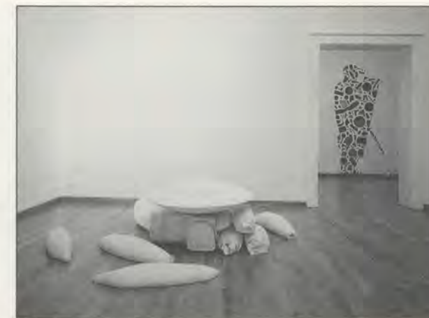
TONY CRAGG, FOREGROUND / VORDERGRUND: GENERATIONS , 1988, PLASTER / GIPS, BACKGROUND / HINTERGRUND: POLICEMAN , 1988, BLUE PLASTIC OBJECTS.

Kürzlich antwortete er in einem Interview auf die Frage, ob er irgendwelche bedeutsamen Veränderungen in seiner Kunst der letzten zehn Jahre sehe, mit dem Hinweis auf jenen Punkt, an dem er begann, Objekte herzustellen, anstatt sich gänzlich auf vorgefundene Materialien zu verlassen. Daraus ergab sich ein Wandel nicht nur im Erscheinungsbild der Arbeit