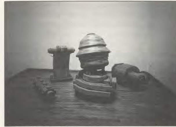
TONY CRAGG, LOCO, 1988,

Für die Darstellung von Lebensformen, Genesis, Energie und Materie postulieren die Wissenschaftler inzwischen einen Anteil des Zufalls, der Willkür und unbestimmten Wahrscheinlichkeit, mithin der Unerklärbarkeit. Diesen unbegreifbaren, unvorhersagbaren Faktor, der den meisten primären wie essentiellen Elementen innewohnt, mag man als Entsprechung zu jenem Element des «Lebens», nicht eines Mechanismus auffassen, das für Newton das Herzstück aller Dinge war. In diesem Sinne verkörpert Newton den