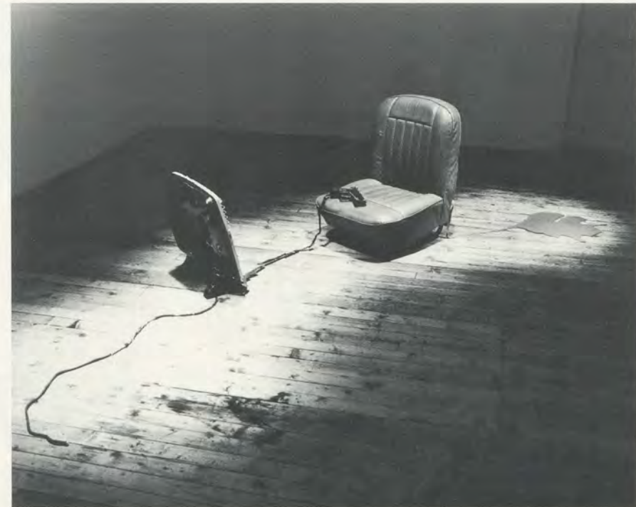
BILL WOODROW, ELECTRIC FIRE, CAR SEAT AND INCIDENT / ELEKTRISCHER OFEN, AUTOSITZ UND UNFALL , 1981. (Southampton Art Gallery)

This analogy with the fabulist, amongst whom Jorge Luis Borges is a supreme exemplar, is per-