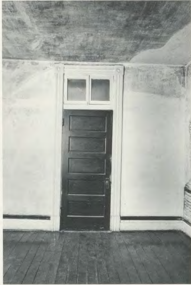
BILL WOODROW, SHIP OF FOOLS: DISCOVERY OF TIME