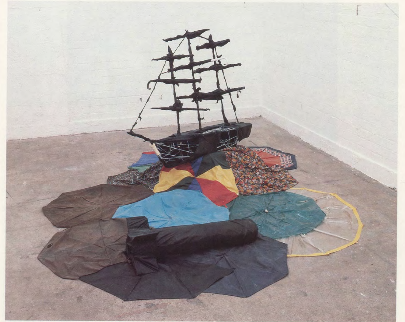
BILL WOODROW, SHIP OF FOOLS: COLOUR OF NIGHT / NARRENSCHIFF: FARBE DER NACHT, 1984, UMBRELLAS / SCHIRME, 53 x 78 3 / 4 x 98 1 / 2 " / 135 x 200 x 250 cm.

Up to the second half of the fifteenth century, or even a little beyond, the theme of death reigns alone. The end of man, the end of time, bears the face of pestilence and war. What overhangs human existence is this conclusion and this order from which nothing escapes... Then in the last years of the century this enormous uneasiness turns in on itself; the mockery of madness replaces death and its solemnity. From the discovery of that necessity which inevitably reduces man to nothing, we have shifted to the scornful contemplation of that nothing which is existence itself... The substitution of the theme of madness for that of death does not mark a break, but rather a torsion within the same anxiety. What is in question is still the nothingness of existence, but this nothingness is no longer considered an external, final term, both threat and conclusion; it is experienced from within as the continuous and final form of existence.» 5