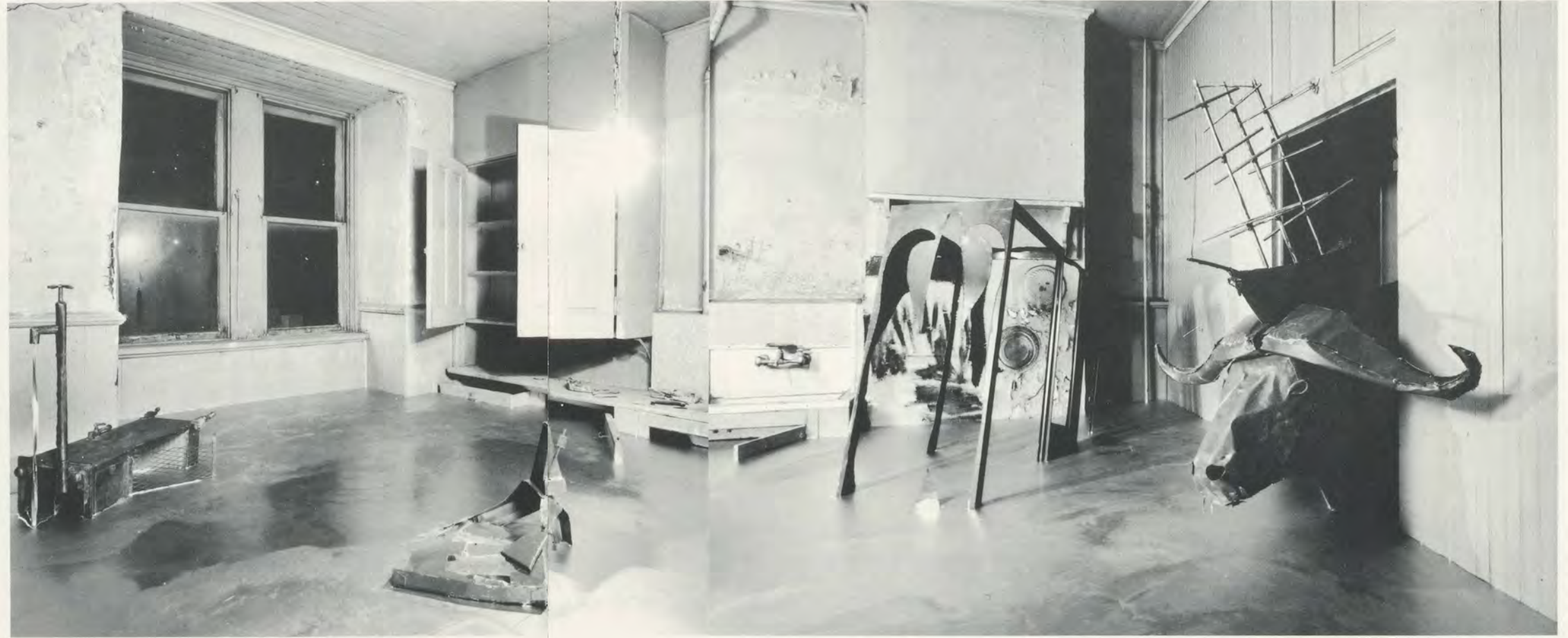
NARRENSCHIFF: ENTDECKUNG DER ZEIT, 1986, INSTALLATION, MATTRESS FACTORY, PITTSBURGH.

zur häufigen Wiederkehr dieser Thematik, bestritt Woodrow jegliche obsessive Faszination und erklärte statt dessen: «Was als bewusste Auseinandersetzung mit dem Tod erscheint, habe ich meinerseits nicht bewusst angestrebt. Alles, was mit dem Tod zu tun hat, beunruhigt uns zutiefst. Nicht ich beschäftige mich besonders mit dem Tod, sondern die ganze Welt ist damit beschäftigt. Wenn man einen Abend lang fernsieht, dann taucht als häufigstes Thema immer wieder der Tod auf, direkt oder indirekt, ob nun im Western oder in den Nachrichten.» 3 Viele spätere Arbeiten vermitteln – zum Teil durch den Umgang mit Vanitas-Symbolen – eine andere Vorstellung von Tod: er erscheint dort als allgegenwärtige Unvermeidbarkeit. Obgleich die Memento-mori-Thematik in zeitgemässe