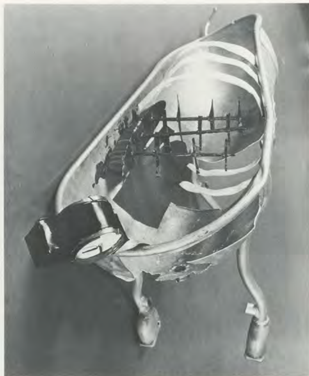
BILL WOODROW, SHIP OF FOOLS: BELLY OF THE BEAST / NARRENSCHIFF: BAUCH DES UNGEHEUERS, 1986. ALUMINIUM BATH TUB, ENAMEL PAINT / ALUMINIUM-BADEWANNE, EMAILFARBE, 25 x 74 x 37" / 64 x 190 x 95 cm.

seits über komprimierte Metaphorik und weist andererseits auch eine ebenso klare und durchdachte Komposition wie SHIP OF FOOLS: COLOUR OF NIGHT auf. Ein auf der Seite liegender, ausrangierter Industriezuber wird zum fragmentarisch skeletthaften Kadaver, dessen Blut, vermischt mit Gold, das Modellschiff überströmt. Eine doppelseitige Wohnzimmer-Uhr ist stummer Hinweis auf die verrinnende Zeit. Mit ihren leuchtenden Zifferblättern erinnert die Form auf seltsam suggestive Weise an lebendige Augen im Kopf des plumpen Tiers. Wie schon in früheren Versionen haben auch hier gewisse Formen von Übertragung und Verlagerung stattgefunden: So wird beispielsweise das Blut aus dem einen Komplex zum Bestandteil eines anderen. Und auf anderer Ebene wird das vertraute Symbol des Wals (eines Meeresbewohners), der einen Landbewohner in sich aufnimmt, auf schlaue Art verkehrt. Fast beiläufig und ohne Nachdruck hindern derlei Anspielungen den Betrachter nicht daran, die Skulptur als physischen Gegenstand in einem bestimmten Raum zu erfahren. Woodrow