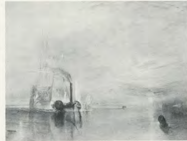
WILLIAM TURNER (1775–1851), THE FIGHTING 'TEMERAIRE' TUGGED TO HER LAST BERTH TO BE BROKEN UP / DAS KAMPFSCHIFF 'TEMERAIRE' WIRD AN SEINEN LETZTEN ANKERPLATZ GESCHLEPPT ZUM ABBRUCH, 1838 , OIL ON CANVAS / ÖL AUF LEINWAND, 35 4/5 x 48" / 91 x 122 cm. (London, The National Gallery)

LYNNE COOKE teaches art history at the University College of London University and works as a freelance critic.