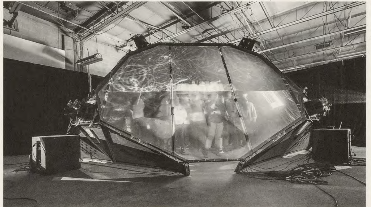
COMPLEX MOVEMENTS, BEWARE OF THE DANDELIONS, 2016, performance view / HÜTE DICH VOR DEM LÖWENZAHN, Performance-Ansicht.

This kind of activism is central to the Raiz Up, a Chicano, Latino, and indigenous collective based in southwest Detroit, home to the Mexicantown neighborhood. Founded in 2012, the group uses