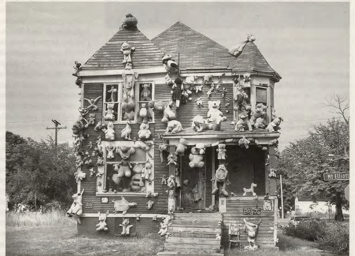
THE HEIDELBERG PROJECT, PARTY ANIMAL HOUSE, Detroit.