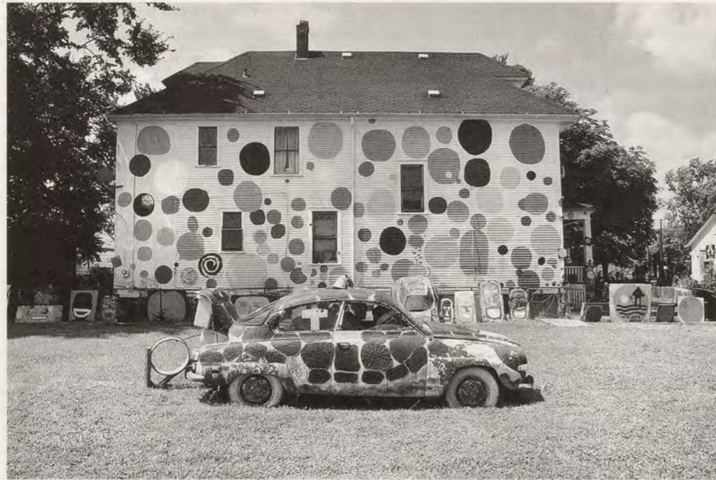
THE HEIDELBERG PROJECT, DOTTY WOTTY HOUSE, Detroit.

von ONE Mile allmählich Ladenfronten an der Oakland Avenue in Kunst- und Gemeinschaftsräume um: Bisher wurde ein ehemaliger Frisörladen in ein Begegnungszentrum umfunktioniert, im Farm-and-Market-Gebäude wurde ein kleines Kino eingerichtet und eine Garage ist in einen Aufführungsraum verwandelt worden. Letztes Jahr lancierte ONE Mile ein Printmagazin, das sich schwerpunktmässig mit «Community Artists» befasst.