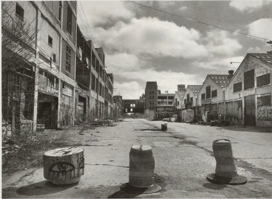
The former Packard automotive plant, constructed 1903–10, Detroit / Die frühere Packard-Automobilfabrik.

was home to one of the largest black middle-class communities in the nation. However, its members were reliant on the automotive industry, and when it declined in the 1970s, their fortunes did as well. More recently, the 2008 economic crisis hit Detroit hard, and the city filed for bankruptcy in 2013.