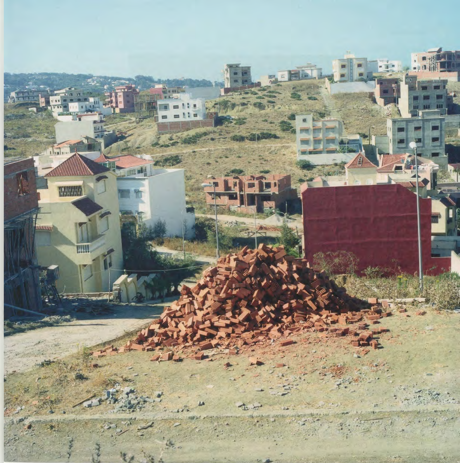
YTO BARRADA, BRIQUES (BRICKS) , 2003/2011, C-print, 59 x 59" / ZIEGELSTEINE , C-Print, 150 x 150 cm.

In an age when millions of images circulate—and are ceaselessly reappropriated and resignified—on the internet, Barrada undertakes a mode of operation that restores the photographic image as an enduring composition, an instrument of reflection, and a way of reading the configuration of the world. “To make the order of the reality external to the image visible through the order of the image” was one of the aims put forth in the 1930s by photographers such as August Sander, Walker Evans, and Albert Renger-Patzsch, who wanted to go beyond “objectivity” to find a more active form of legibility in the presentation of the world. 1) Barrada indisputably partakes of that tradition although she tends to show us the disorder of life in images that confront us with a less exoticized vision of reality than that provided by television or advertising. COLLINE DU CHARF, LIEU-DIT DU TOMBEAU DU GÉANT ANTÉE (Site of the Tomb of the Giant Antaeus, 2000), ROUTE DE LA UNITÉ (Unity Road, 2001/2002), and BRIQUES (Bricks,