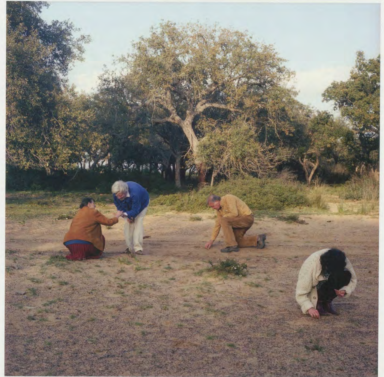
YTO BARRADA, CHASSE AUX MICROLITHES DANS LA FÔRET DIPLOMATIQUE, TANGER (LOOKING FOR MICROLITHS IN THE DIPLOMATIC FOREST, TANGIER), 2012, C-print, 31 1/2 x 31 1/2" / SUCHE NACH FEUERSTEINWERKZEUGEN IM FÔRET DIPLOMATIQUE, C-Print, 80 x 80 cm.

Lange Zeit hat Barrada solche unbewussten Verläufe, Hinterlassenschaften und Spuren fotografiert. Sie richtet ihre Linse auf Plakate, Stücke bemalten Papiers, Stilleben, Fassaden, Tafeln und Wände. Diese frontalen, flachen Kompositionen scheinen die rohen Tatsachen wiederzugeben, Ausschnitte aus der Wirklichkeit, ohne Erklärungen und ohne vorbestimmte Bedeutungen. 4) Sie sind Gestaltungen der Wirklichkeit, aufgedeckt von einem Auge, das es gewohnt ist, im Alltäglichen die Brüche und die bedeutungsvollen Momente zu erkennen. Eine Kerbe in einer Wandtapete mit der Darstellung einer idyllischen Gebirgslandschaft in PAPIER PEINT (Tapete, 2001) ist eine Geste der Ungehorsamkeit, ein Bekenntnis, dass das Paradies nur eine Fata Morgana ist. Überall sind diese Symbole des Bruchs in Barradas Werk: Leerstellen in der Landschaft, Gebäude im Verfall, Treppen, die nirgendwohin führen, aufgerissene Zäune. Wenn das Leben sich dau-