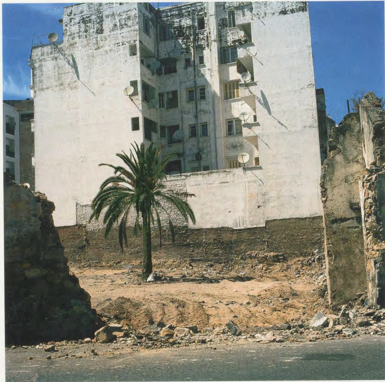
YTO BARRADA, TERRAIN VAGUE N°2 (VACANT LOT NO 2) , 2009, C-print, 31 1/2 x 31 1/2" / BRACHLAND , C-Print, 80 x 80 cm.

are displaced, and another empty lot lies like an open wound, awaiting another speculator.