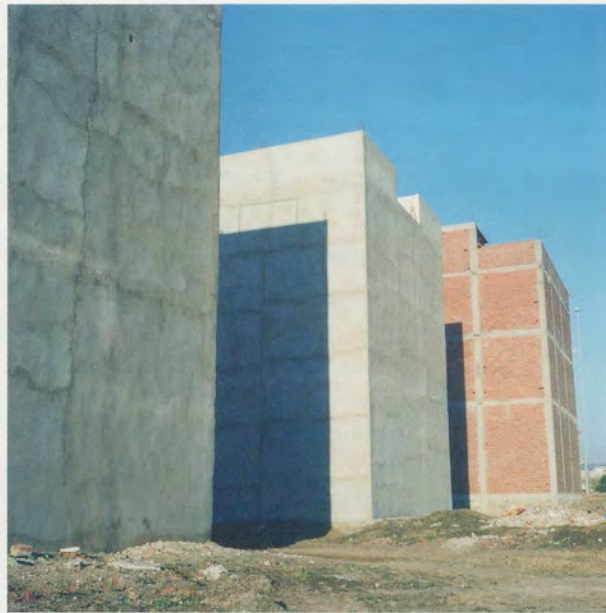
YTO BARRADA, MURS ROUGES FIG. 5

(RED WALLS FIG. 4), 2006, C-print, 39 3/8 x 39 3/8" / ROTE MAUERN, FIG. 4, C-Print, 100 x 100 cm.