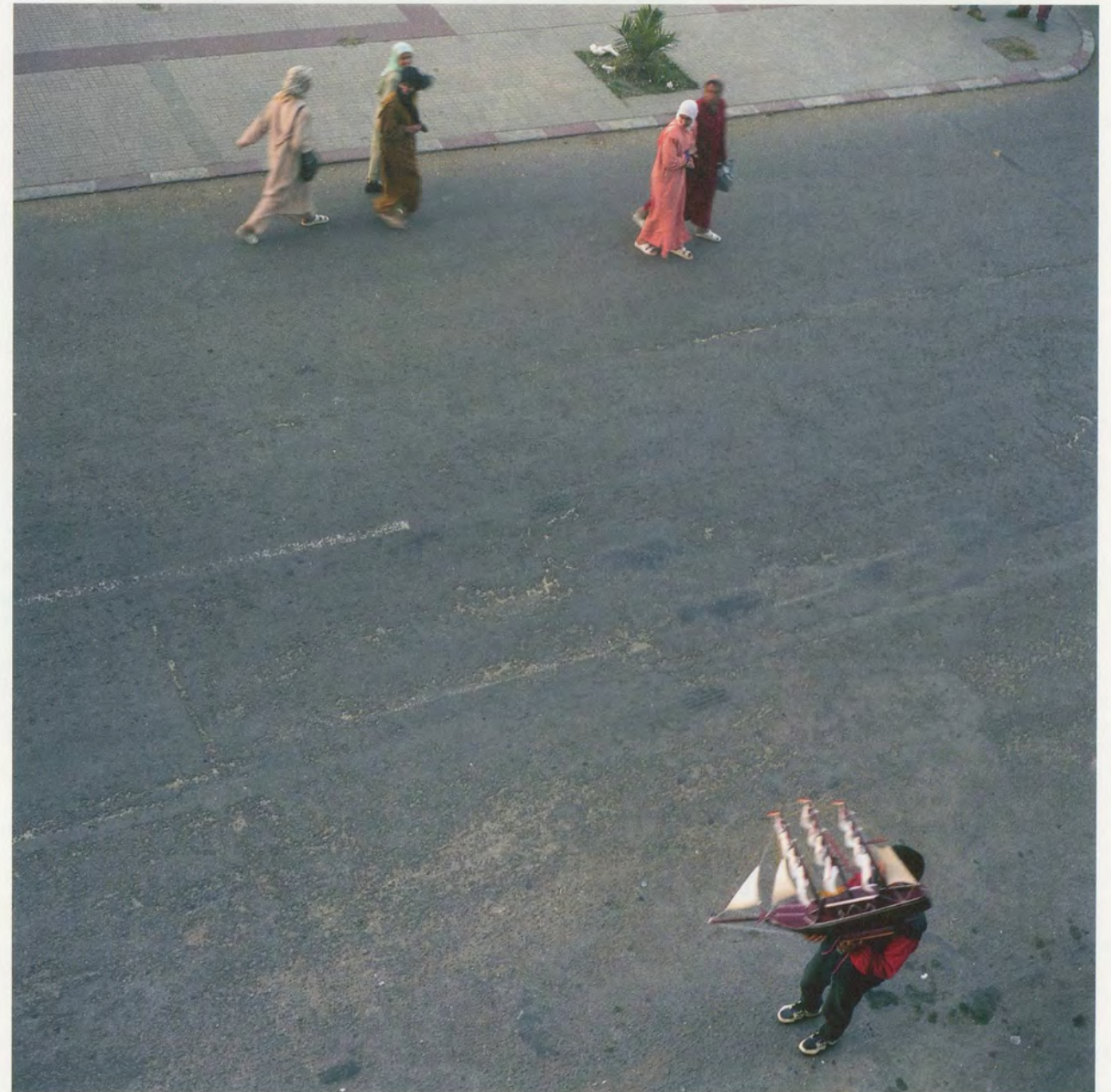
YTO BARRADA, LE DÉTROIT – AVENUE D'ESPAGNE, TANGER, 2000/2003, C-print, 23 3/8 x 23 3/8" / C-Print, 60 x 60 cm.

4) Eric De Chassey, Planitudes. Historia de la fotografía plana . Ediciones Universidad de Salamanca/Focus 10, Salamanca 2009, S. 211.