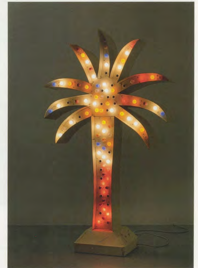
YTO BARRADA, PALM SIGN, 2010, aluminum, steel, color light bulbs, 99 x 59 2/3 x 20" / PALMEN-SIGNAL, Aluminium, farbige Glühbirnen, 251,5 x 152 x 51 cm.

Barradas Photos reflektieren ein Verständnis von Landschaft, wie es 1930 vom deutschen Geographen Nikolaus Creutzburg beschrieben wurde, «der sensibelste und objektivste Ausdruck einer Gesellschaft, der auf jede Veränderung des kulturellen Milieus wie ein empfindliches Instrument reagiert», und da sie sich nahezu «unbewusst» forme, seien die Auswirkungen auf sie tief greifender und dauerhafter. 2) Die Palme, ein Leitmotiv in Barradas Werk, ist das Symbol von Tangers Selbst-Exotisierung und Folklore: Ursprünglich dort nicht heimisch, wurde sie in der ganzen Stadt angepflanzt und hat das Erscheinungsbild des städtischen Raums homogenisiert. In zahlreichen Bildern, wie etwa VISITE OFFICIELLE, GÉRANIUMS ROUGES (Offizieller Besuch, rote Geranien,