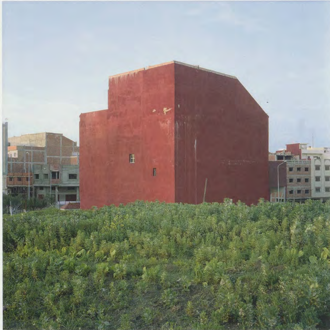
YTO BARRADA, IMMEUBLE ROUGE (RED BUILDING), TANGER, 2008, C-print, 31 1/2 x 31 1/2" / ROTES GEBÄUDE, C-Print, 80 x 80 cm.

nung der äusseren Welt mittels der Bildanordnung im Bild sichtbar machen», lautete in den 30er-Jahren eines der Hauptziele von Photographen wie August Sander, Walker Evans und Albert Renger-Patzsch. Sie wollten die «Objektivität» hinter sich lassen, um ihren Darstellungen der Wirklichkeit eine aktivere Lesbarkeit zu verleihen 1) . Ohne jeden Zweifel knüpft Barrada an diese Tradition an, auch wenn sie uns lie-