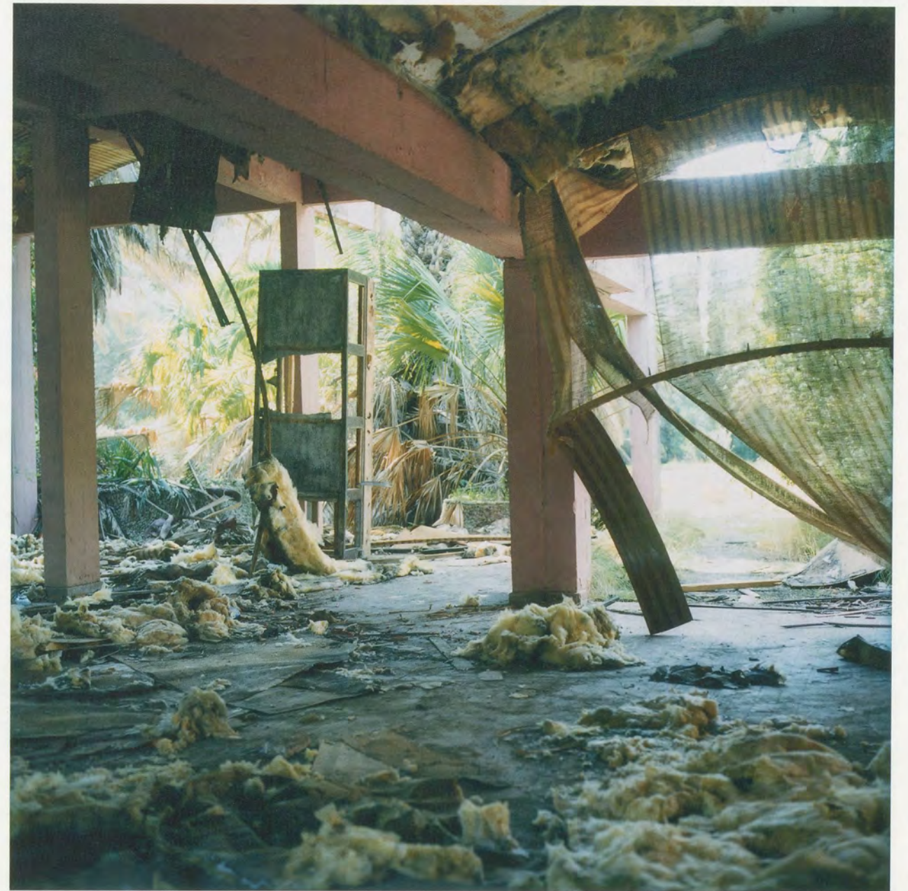
YTO BARRADA, RESTAURANT, VILLA HARRIS, FIG. 1, 2010, C-print, 49 1/4 x 49 1/4", diptych / C-Print, 125 x 125 cm, Diptychon.