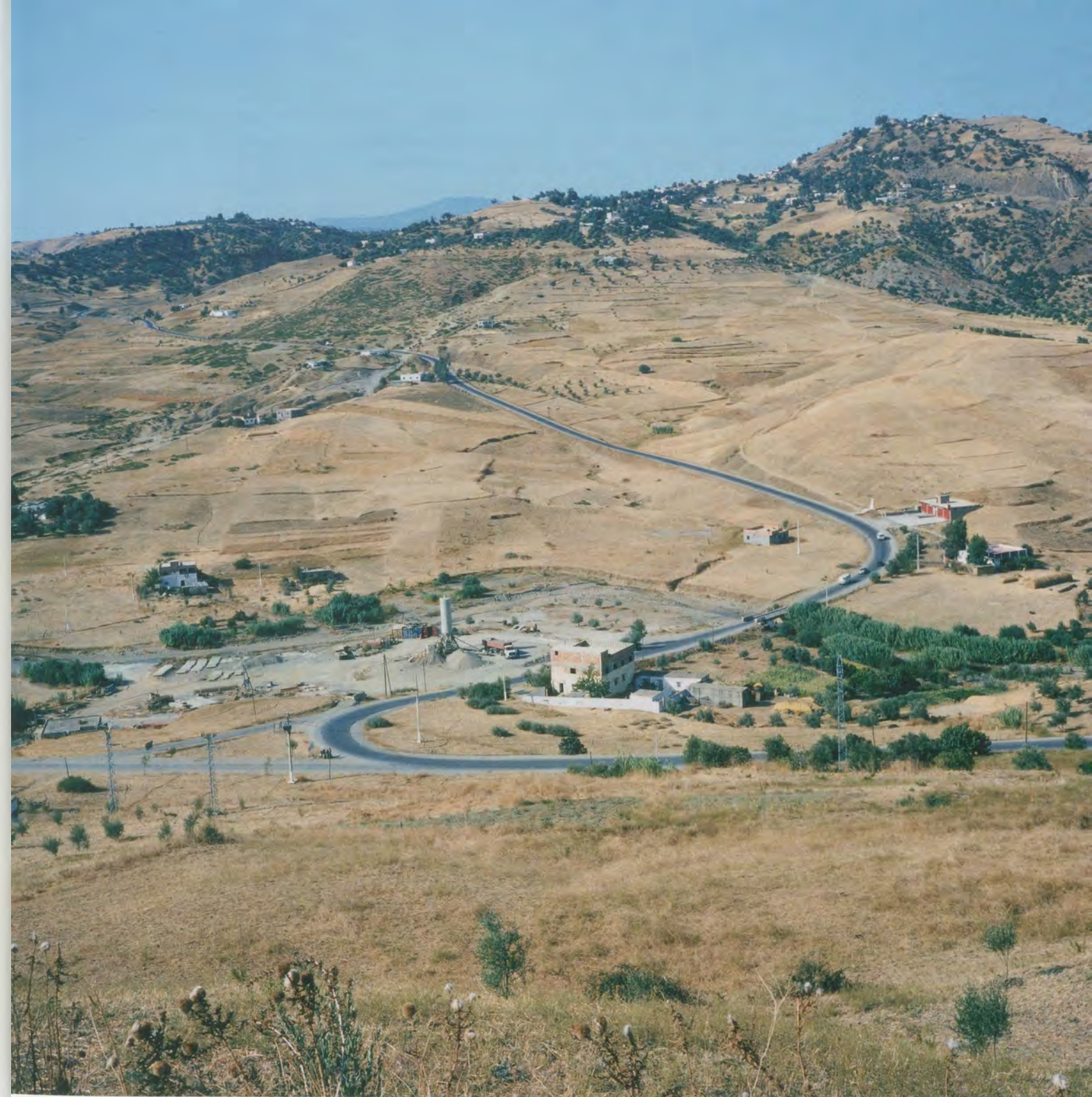
YTO BARRADA, ROUTE DE L'UNITÉ (UNITY ROAD), 2001, C-print, 31 1/2 x 31 1/2" / STRASSE DER EINHEIT, C-Print, 80 x 80 cm.

In einem vom Bild beherrschten Zeitalter mit seinen Abermillionen im Netz zirkulierenden, stets aufs Neue umgewandelten und umgedeuteten Aufnahmen wendet Barrada Methoden an, die das photographische Bild wieder zu einer bleibenden Komposition machen, zu einem Instrument der Reflexion, auch über die Beschaffenheit dieser Welt. «Die Ord-