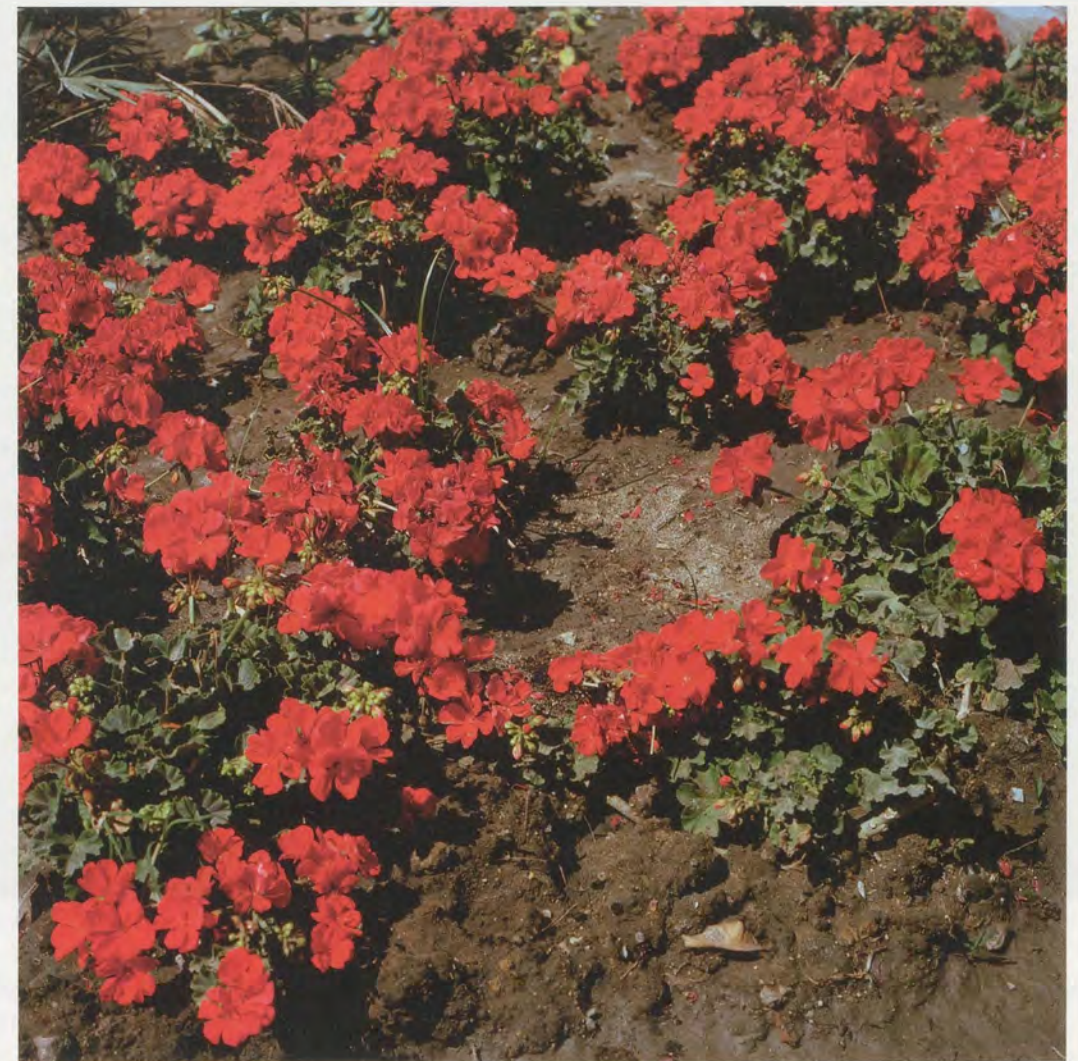
YTO BARRADA, VISITE OFFICIELLE, GÉRANIUMS ROUGES TANGIER (OFFICIAL VISIT, RED GERANIUM, TANGER), 2007, C-print, 23 5/8 x 23 5/8" / OFFIZIELLER BESUCH ROTE GERANIEN, C-Print, 60 x 60 cm.

of land with a tree. In recent years, Barrada has photographed a great many empty lots. While the unbridled urbanization of the past decade in southern Europe and northern Africa has meant the disappearance of the non-urban outskirts of cities, once the home of vagrancy and the forbidden—as in the films of Michelangelo Antonioni and Pier Paolo Pasolini—the downtown areas of these cities have grown increasingly deserted. Buildings are torn down, people