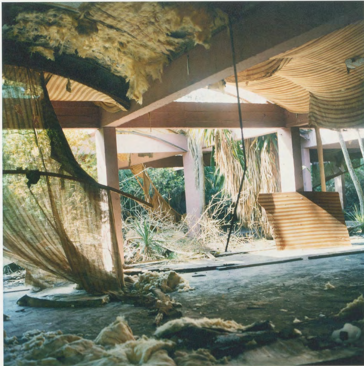
YTO BARRADA, RESTAURANT, VILLA HARRIS, FIG. 2, 2010, C-print, 49 1/4 x 49 1/4" / C-Print, 125 x 125 cm.