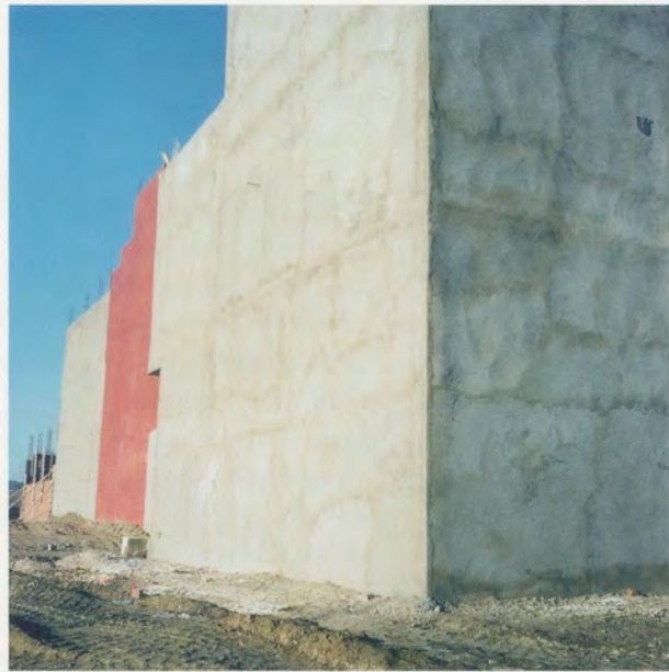
YTO BARRADA, MURS ROUGES FIG. 4

(RED WALLS FIG. 4), 2006, C-print, 39 3/8 x 39 3/8" / ROTE MAUERN, FIG. 4, C-Print, 100 x 100 cm.