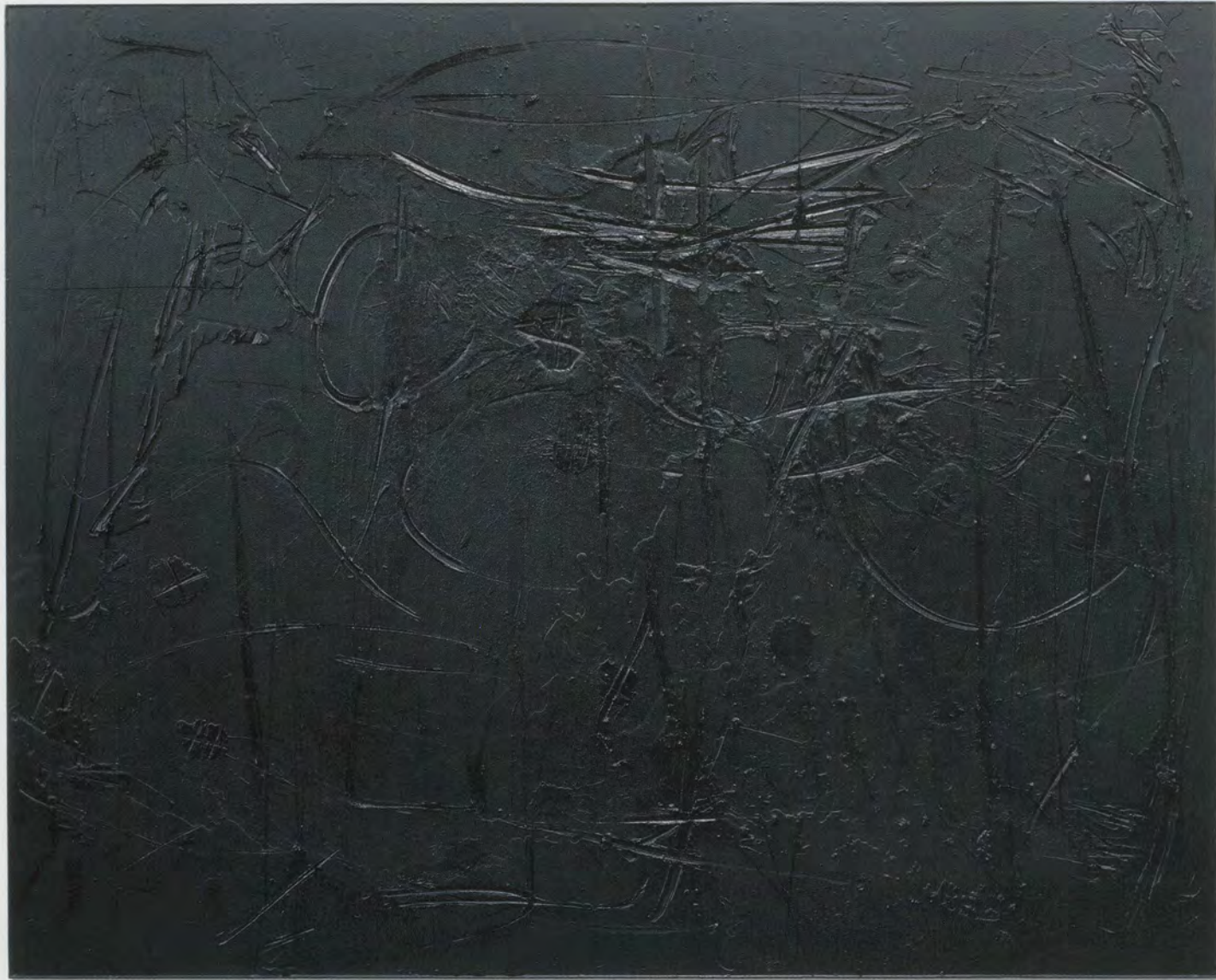
RASHID JOHNSON, COSMIC SLOP "BLACK ORPHEUS," 2011, black soap, wax, 96 1/2 x 120 1/2 x 2" / KOSMISCHE BRÜHE «SCHWARZER ORPHEUS», schwarze Seife, Wachs, 245,1 x 306 x 5,1 cm.