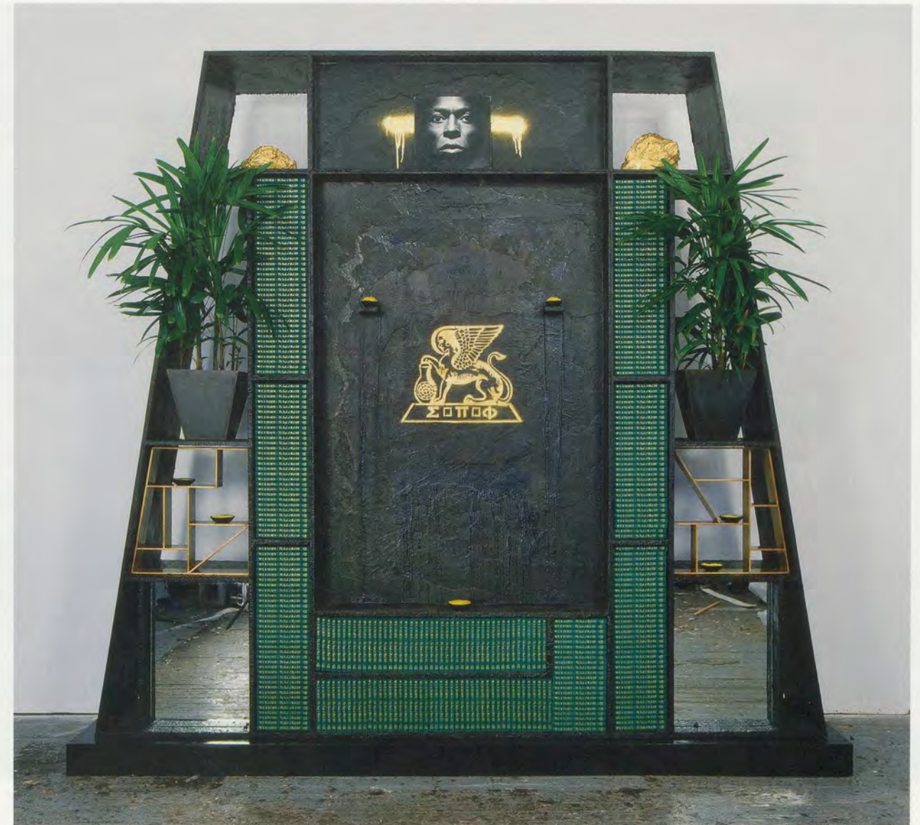
RASHID JOHNSON, SOULS OF BLACK FOLK , 2010, black soap, wax, books, vinyl, brass, shea butter, plants, space rocks, mirrors, gold paint, stained wood, 114 x 124 3/4 x 24 1/8" / SEELEN DER SCHWARZEN, schwarze Seife, Wachs, Bücher, Schallplatte, Messing, Sheabutter, Weltraumgestein, Spiegel, Goldfarbe, gebeiztes Holz, 289,6 x 316,9 x 61,3 cm.

Johnson’s sculptures, photographs, and videos proceed through reference and sheer density of information. His best-known works, shelf-like wall pieces such as WANTED (2011), gather together found items that allude variously to African American intellectual history, pop culture, the anointing of the skin, the free circulation of ideas, and the unstable stuff of value. Stacked books are a regular feature, here, their titles ( The Souls of Black Folk , Death by Black Hole , Time Flies ) and prominent African American authors (sociologist and civil rights activist W.E.B. Du Bois, astrophysicist Neil deGrasse Tyson, the complicatedly conservative comedian Bill Cosby) speaking of whole explosive cosmoses contained within their covers, like energy packed in a hydrogen atom. LP sleeves are also common, including artists like the psychedelic funk outfit Parliament and soul singer turned pastor Al Green. Shea butter is also common—the substance is derived from the African shea nut that is used in moisturizers and cosmetics, in Johnson’s work it recalls Joseph Beuys’ magically charged measures of fat. Houseplants also appear on the shelves, alongside CB radios and ordinary stones transformed into “space rocks” by a coat of gold spray paint. Taken