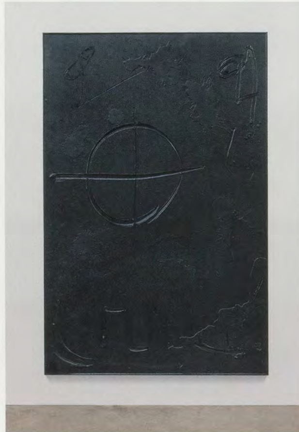
RASHID JOHNSON, COSMIC SLOP "UNDER WATER," 2011, black soap, wax, 72 1/2 x 49 1/2 x 1 3/4" / KOSMISCHE BRÜHE «UNTER WASSER», schwarze Seife, Wachs, 184,2 x 125,7 x 4,4 cm.