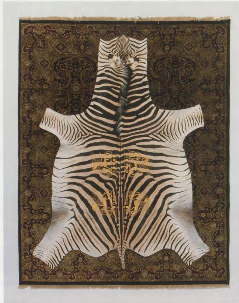
RASHID JOHNSON, TWO RUGS, 2010, Persian rug, zebra skin, gold embroidery, 120 x 94" / ZWEI TEPPICHE, Perserteppich, Zebrafell, Goldstickerei, 304,8 x 238,8 cm.

die Grundrisse der Häuser von Du Bois, dem Philosophen Bertrand Russell und dem Schriftsteller William Faulkner Pate, von Persönlichkeiten, deren pazifistische Haltung Johnson tief beeindruckt. Ganz grundsätzlich aber sollen wir uns Gedanken über die einzelnen Bestandteile der Kunstwerke und ihre Beziehungen zueinander machen. Das klingt nicht nur nach Museologie oder nach der Inszenierung von Machtverhältnissen durch taxonomische Logik, sondern auch nach häuslicher Unordnung. Der Blick auf Johnsons Regale erinnert uns weniger an sorgfältig beschriftete Vitrinen als vielmehr an Kaminsimse voller Familienandenken oder Altäre für Hausgötter. Das Ziel des Künstlers ist «die Rassenmischung aller Materialien zu einer neuen Sprache, mit mir als