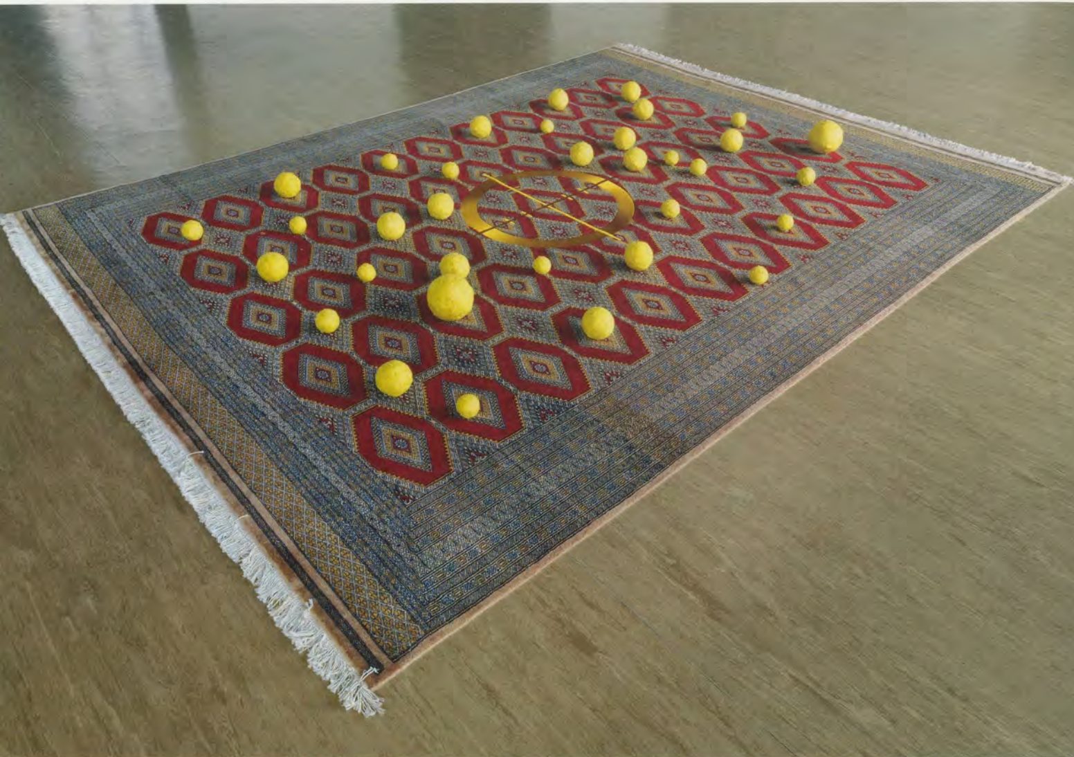
RASHID JOHNSON, HOW YA LIKE ME NOW , 2010, Persian rug, gold embroidery, shea butter, 7\frac{1}{8} \times 102\frac{1}{2} \times 143\frac{1}{2} " / WIE GEFALLE ICH EUCH JETZT , Perserteppich, Goldstickerei, Sheabutter, 18 \times 260,5 \times 364,5 cm.

pacifist sympathies the artist strongly admires), on a very basic level, their function is to encourage us to contemplate the relationships between the elements they contain. If there is something museological about this, a nod to the production of power relations through the application of taxonomic logics, there is also something more messily domestic. Looking at Johnson's shelves, we're reminded less of carefully labeled vitrines than of mantelpieces dotted with family mementos or altars to household