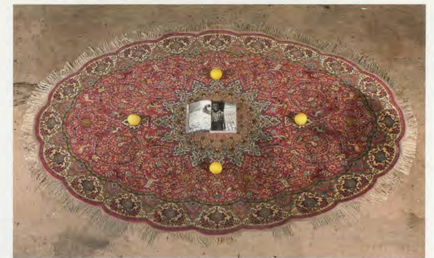
RASHID JOHNSON, PREFACE TO A TWENTY VOLUME SUICIDE NOTE , 2011, Persian rug, shea butter balls, book, 4\frac{1}{8} \times 129\frac{1}{2} \times 88\frac{7}{8} " / VORWORT ZUR NOTIZ VOR DEM FREITOD IN ZWANZIG BÄNDEN , Perserteppich, Sheabutterkugeln, Buch, 10,5 \times 329 \times 225 cm.

Like all of the artist's oeuvre, HOW YA LIKE ME NOW turns on fluidity, a perpetual refusal to ossify. Some questions occur. Does the Persian carpet function as a luxury commodity, an emblem of the artistic achievements of an ancient non-Western culture, or as a placeholder for American anxieties about Islam? Do its stitched and gilded crosshair motifs speak of the intertwining of the Muslim faith and African American resistance (several members of the Public Enemy-affiliated militia Security of the First World are also members of the religious movement the Nation of Islam), and how is the meaning of the hip-hop group's original logo altered by Johnson's editing out of the silhouetted figure of a black man, seen through a sniper's scope? What does it mean to transfer BLIZ-AARD BALL SALE from the cold of Cooper Union's ad hoc outdoor marketplace into the altogether different chill of a commercial or public gallery, and remake its icy white snowballs in a material of African origin—especially knowing that the artist has likened applying shea butter to the skin as "coating oneself in African-ness"? 5 How are we to understand Johnson's appropriation of the title How Ya Like Me Now , given Kool Moe Dee's track concerns itself with his belief that fellow New York rapper LL Cool J