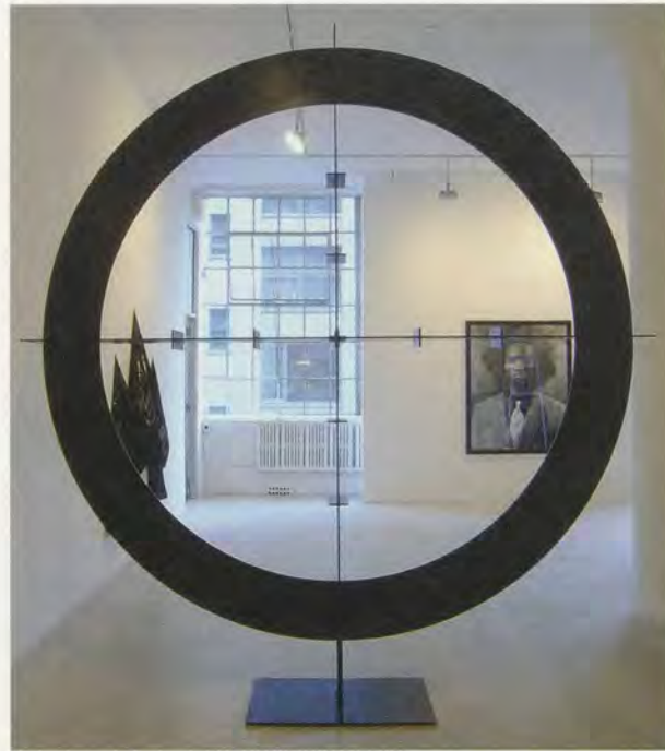
RASHID JOHNSON, BLACK STEEL IN THE HOUR OF CHAOS , 2008, blackened gunmetal steel, 126 x 141 x 24" / SCHWARZER STAHL IN DER STUNDE DES CHAOS, geschwärzter Waffenstahl, 320 x 358,1 x 61 cm.

pling» auf der Single Hot von 1976 –, könnten wir den Song als Versuch begreifen, alte Collageure neu zu collagieren und dabei einen frischen, eindringlichen Sound zu kreieren. HOW YA LIKE ME NOW (Wie gefalle ich euch jetzt) ist auch der Titel eines 2011 entstandenen Schlüsselwerks von Johnson. Ein Fadenkreuz, mit Goldgarn auf das Rautenmuster eines prächtigen Perserteppichs gestickt, erscheint darin wie eine Auskopplung aus dem Logo der Hip-Hop-Pioniere Public Enemy. (Dieses wiederkehrende Motiv in Johnsons Werk verspricht entweder Schutz oder tödliche Gewalt, je nachdem, an welchem Ende des Gewehrlaufs man sich gerade befindet.) Die über den gesamten Teppich verteilten Kugeln aus gelblicher Sheabutter verweisen unmissverständlich auf David Hammons' legendäre Performance BLIZ-AARD BALL SALE (Schneeballverkauf, 1983), für die der afroamerikanische Künstler vor dem Gebäude der Cooper Union in Lower Manhattan zwischen anderen Strassenhändlern, die weggeworfene und