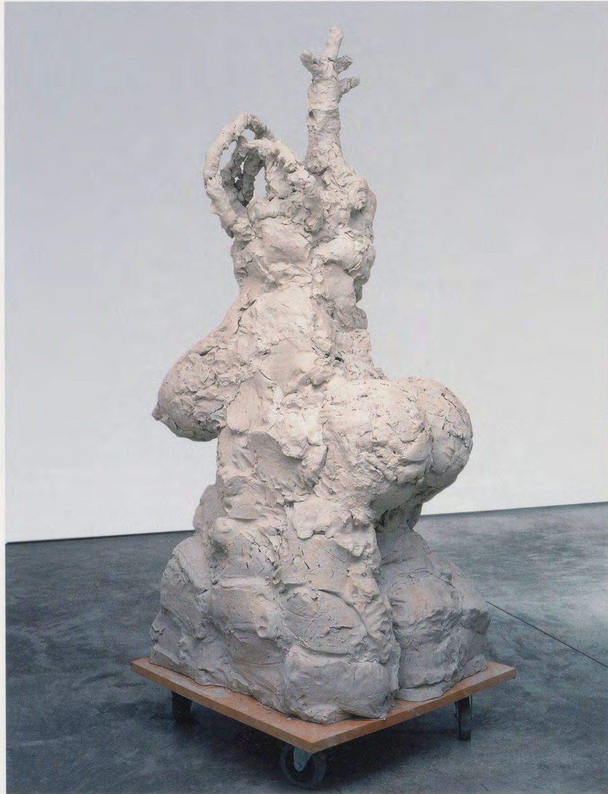
REBECCA WARREN, HOMAGE TO R. CRUMB, MY FATHER, 2003 , reinforced clay, MDF, wheels, 83 7/8 x 32 1/8 x 32 1/8" / HOMMAGE AN R. CRUMB, MEINEN VATER, verstärkter Ton, MDF, Räder, 213 x 81,5 x 81,5 cm.

related to children's modeling compounds but, stylistically, in Warren's hands, more to the anarchic little Plasticine sculptures, piles of mess, and spent chewing gum that children like to leave behind. Such discord is epitomized in Warren's appropriation of Degas' famous little ballerina ( LITTLE DANCER AGED FOURTEEN, 1880–81 ), who she subverts in her own THE TWINS (2004) and COME, HELGA (2006) by displacing the ballerina's delicate, modest stance with a gauche, lumpy physicality, twice over.