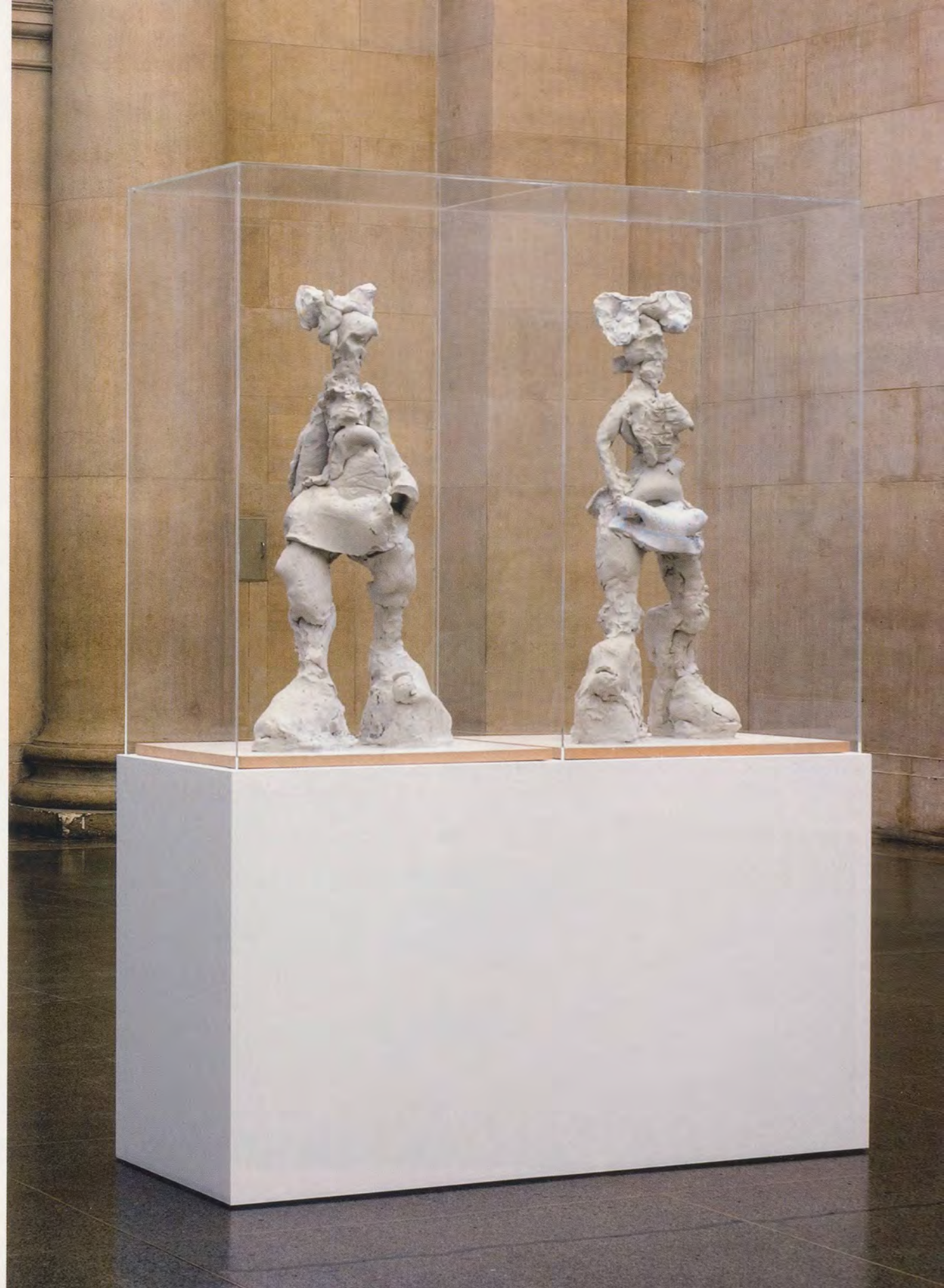
REBECCA WARREN, COME, HELGA, 2006, reinforced clay, paint, plinth, perspex, 84 7/8 x 24 x 60 7/8" / KOMM, HELGA, verstärkter Ton, Farbe, Sockel, Plexiglas, 215 x 61 x 154,5 cm.

NEAL BROWN is an artist and writer based in London. He is the author of Tracey Emin (Tate 2006) and was curator of "To the Glory of God: New Religious Art" at the second Liverpool Biennial.