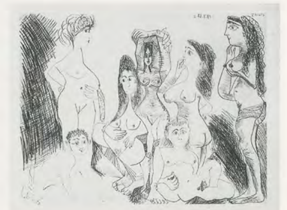
PABLO PICASSO, from the 347 series, 1968, etching / aus der Serie 347, Radierung