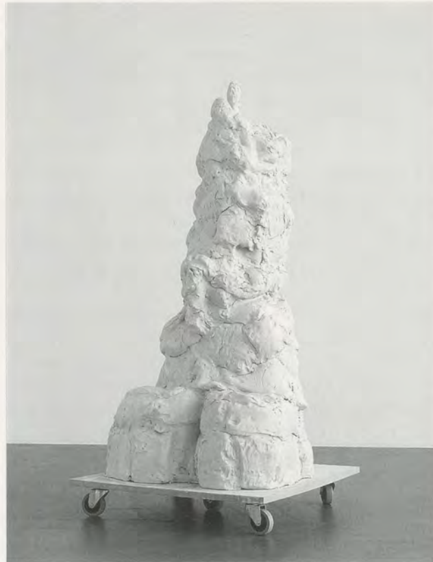
REBECCA WARREN, PRIVATE SCHMIDT , 2004, reinforced clay, MDF, wheels, 72 7/8 x 35 7/8 x 35 7/8" / SOLDAT SCHMIDT , verstärkter Ton, MDF, Räder, 185 x 91 x 91 cm.

the particular bodily types that are regarded so unfavorably in females these days: wide hips, thick goose-thighs, big bottoms, and general big-bonedness. Elements of many sexual paraphilias can be seen in Crumb's work, such as Saliromania , which is the deriving of erotic pleasure from soiling or spoiling the object of desire. (This may include tearing or damaging their clothing, covering them in mud or filth, or otherwise disheveling them—a fetish that can also involve the defacing of statues or pictures of attractive people, especially celebrities, and the forming of collections of defaced art.) Crumb, as a cartoonist, also summons ideas of Schediaphilia (more humorously known as Toonophilia ), which is love or sexual arousal towards cartoon characters. Crumb's work, unlike Warren's, includes visceral hatreds, often towards conventionally beautiful women and the highly esteemed status they enjoy, and it is possible to consider Warren's appropriation of him as allusive of the need, or not, to "earn" or "deserve" love in this world—for men as well as women—much of it centered around exaggerated ideas of beauty.