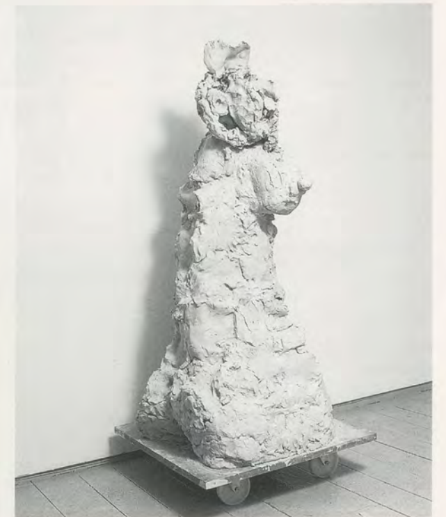
REBECCA WARREN, DEUTSCHE BANK , 2002, reinforced clay, MDF, wheels, 29 1/8 x 29 1/8 x 29 1/8" / verstärkter Ton, MDF, Räder, 166 x 74 x 74 cm.

There are stylistic points of comparison between Warren and Bacon. These include a shared emphasis on reductive bodily physicality and truncated monstrousness, as well as similarities between Bacon's spermy, Vaseline smearings and Warren's slippery sexualizing of clay. That there could be "a female Francis Bacon" is a strangely appealing idea to consider, both in the abstract and in respect to Warren's work. But it wouldn't be correct to attempt to describe Warren as this impossible person. Unlike Bacon, her work is self-deprecating and not grandiose, and is infinitely wittier. More importantly, the idea of love—damaged and dysfunctional as this love might be—is not extinguished, and, in spite of all the debauchery and outrage, is characteristically the voice of Rebecca Warren.