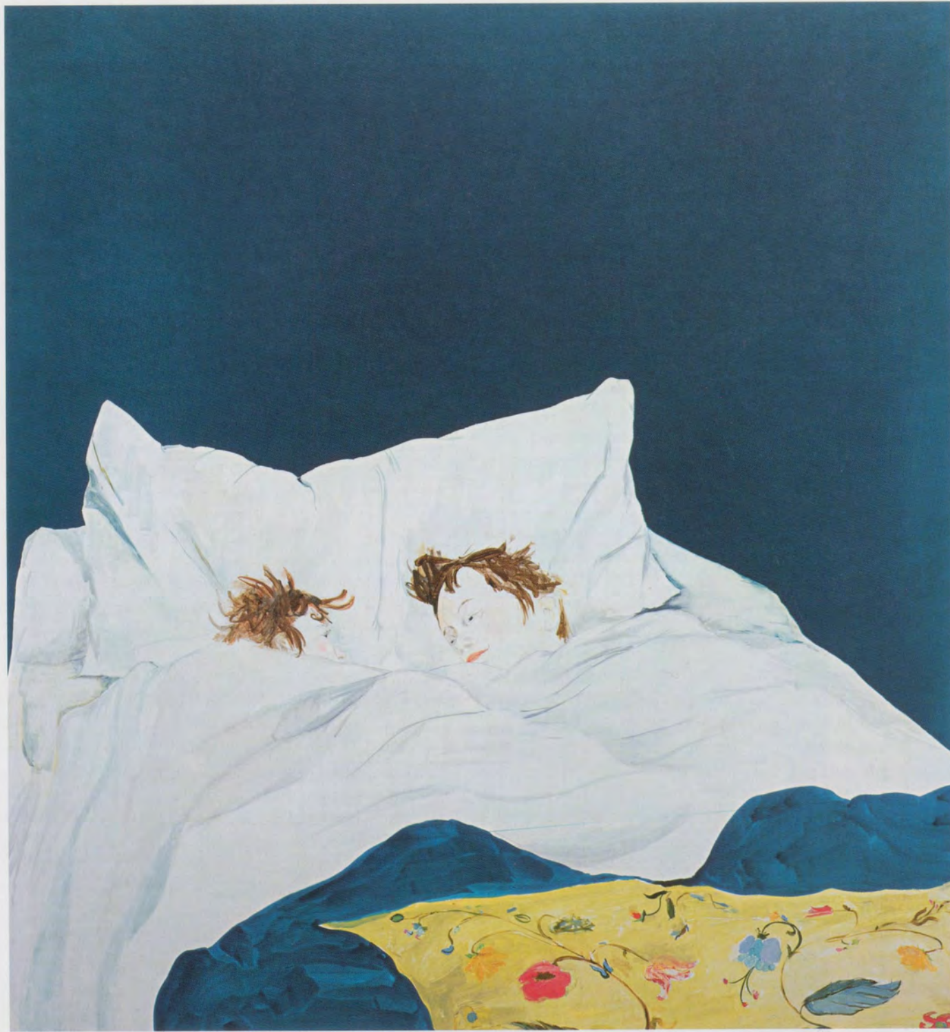
LAURA OWENS, UNTITLED, 2000, acrylic, oil, and watercolor on canvas, 66 1/2 x 72" / OHNE TITEL, Acryl, Öl und Wasserfarbe auf Leinwand, 169 x 183 cm.

Mein Titel ist natürlich dieser alten Serie in Art News entliehen, die jeweils im Atelier eines bekannten Künstlers die Entstehung eines Bildes verfolgte. Einerseits bestätigte diese Serie die traditionelle Vorstellung vom Atelier als Ort beinahe alchimistischer Transformationen, andererseits hat sie diese aber auch entmystifiziert, indem sie den Schleier etwas lüftete und die prosaische Arbeit des Bildermalens sichtbar machte. Auf gewisse zeitgenössische Künstler gemünzt, könnte ein solcher Titel nur ironisch wirken, und im Text wäre zu lesen, wie der Künstler telefoniert, während irgendwelche Spezialisten an seinem Werk arbeiten. Laura Owens hingegen malt auf ganz altmodische Art. Meistens ist sie allein in ihrem Atelier, nur gelegentlich hilft ihr jemand beim Aufziehen der Leinwand oder beim Abdecken. Sie setzt sich keinen Termin. Der Tag spielt keine Rolle: «Ich versuche einfach, das beste Bild zu machen, das ich in diesem Augenblick machen kann.» 1) An der Wand des Ateliers hängt ein altes, von Hand geschriebenes Schild: Make stuff (etwa: «Mach was und mach es selbst»). Aber was immer sie macht, «es wird mit Sicherheit ein Bild».