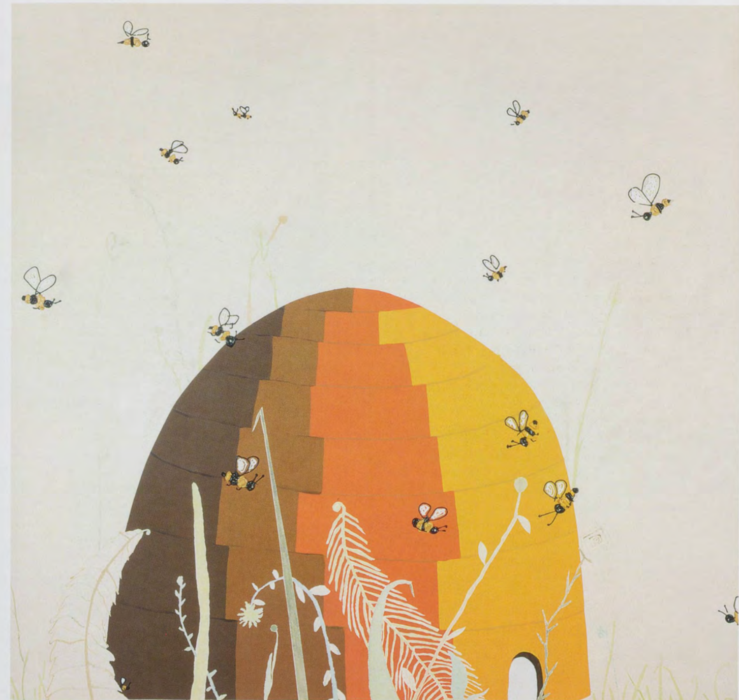
LAURA OWENS, UNTITLED, 1998, acrylic on canvas, 66 x 72" / OHNE TITEL, Acryl auf Leinwand, 168 x 183 cm.