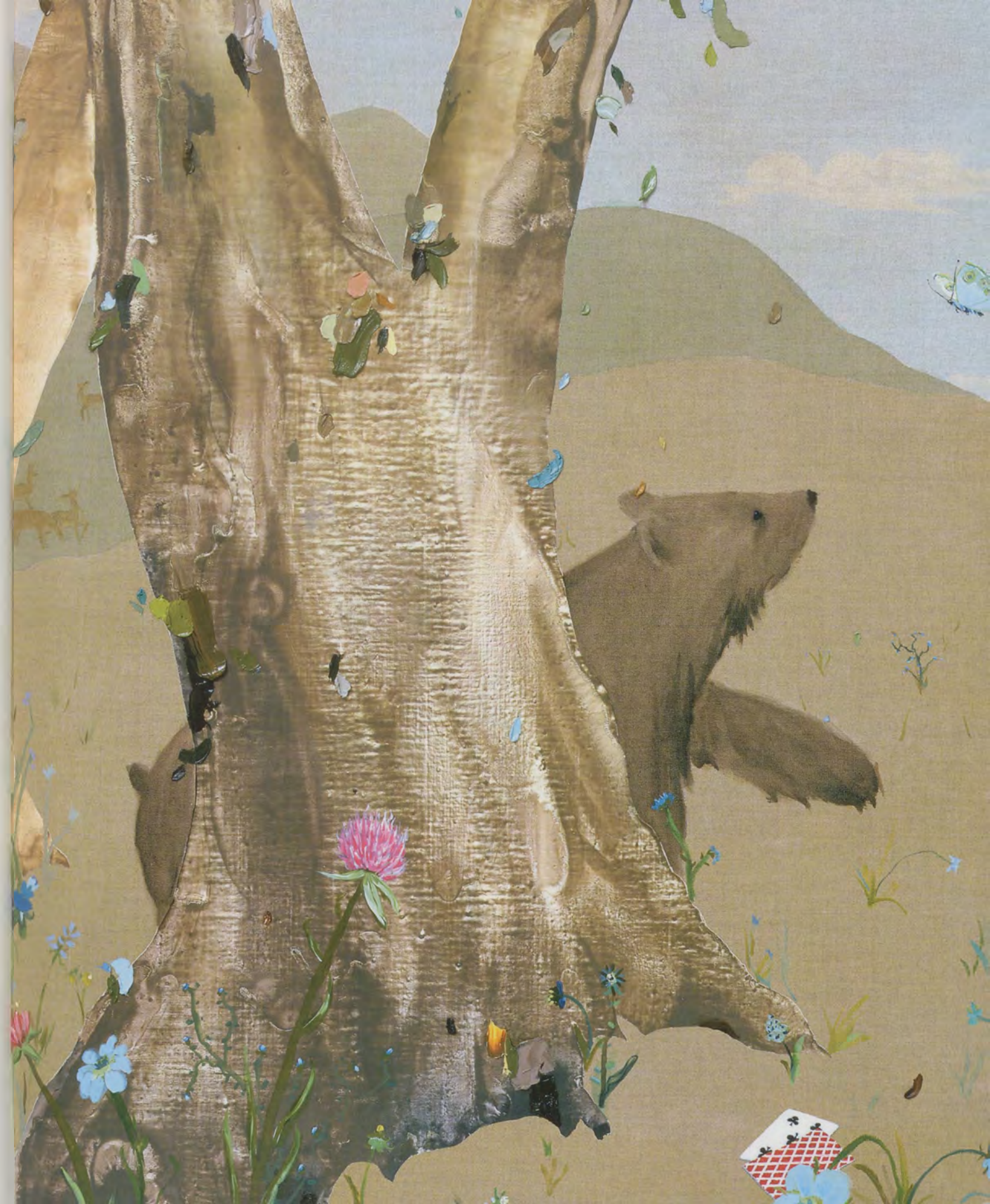
OWENS, UNTITLED, 2002, oil and acrylic on linen, 84 x 132", detail / OHNE TITEL, 213 x 335 cm, Ausschnitt.

Her first work on the canvas itself was to block out the silhouettes of the smaller trees and their branches with masking tape. Then the first painting: the monkey, brushed in with a dark water-based ink.