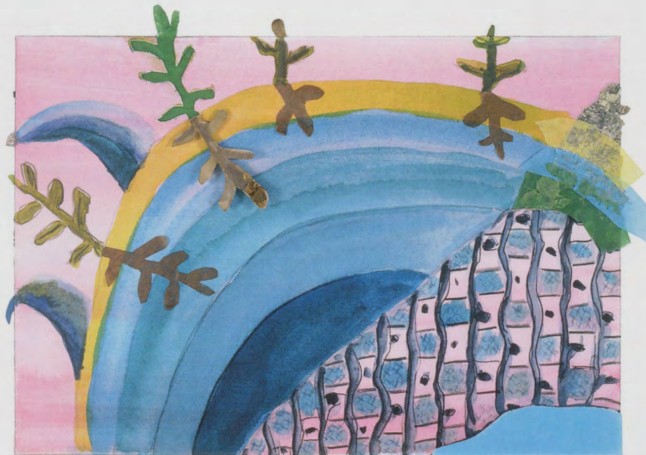
LAURA OWENS, UNTITLED, 2001, watercolor, tissue paper, and felt on paper, 7 x 10" / Wasserfarbe, Seidenpapier und Filz auf Papier, 17,8 x 25,4 cm.

Sportler haben oft komplizierte Rituale, die sie vor dem Wettkampf durchspielen müssen. Diese dienen nicht nur dazu, abergläubische Ängste zu beschwichtigen, sondern beruhigen auch die Nerven und machen den Kopf frei, damit die Leistung im entscheidenden Augenblick nicht durch zu viel bewusste Anstrengung behindert wird. Paradoxiertweise kann dieser Zustand nur durch jahrelanges mühsames Training erreicht werden. Für Owens sind die Verstörung und die konkreten Vorbereitungen Stadien, die sie durchlaufen muss, um den Punkt zu erreichen, an dem sie sich zuversichtlich an die Arbeit machen kann, in einem Bereich, in dem es «kein <gut> oder <böse> gibt». Doch ihr sich in den Akt des Malens Hineinsteigern unterscheidet sich grundsätzlich von Harold Rosenbergs berühmter Formulierung aus den 50er Jahren, wonach die Leinwand «eine Arena» sei, «in der es zu agieren gilt», dieser Hymne an die unberechenbare Inspiration, die «in den Muskeln des Malers und dem cremefarbenen Meer, in das er abtaucht» gefunden werden müsse. 2) Für Owens ist die Leinwand keine Kampfarena. Ihre