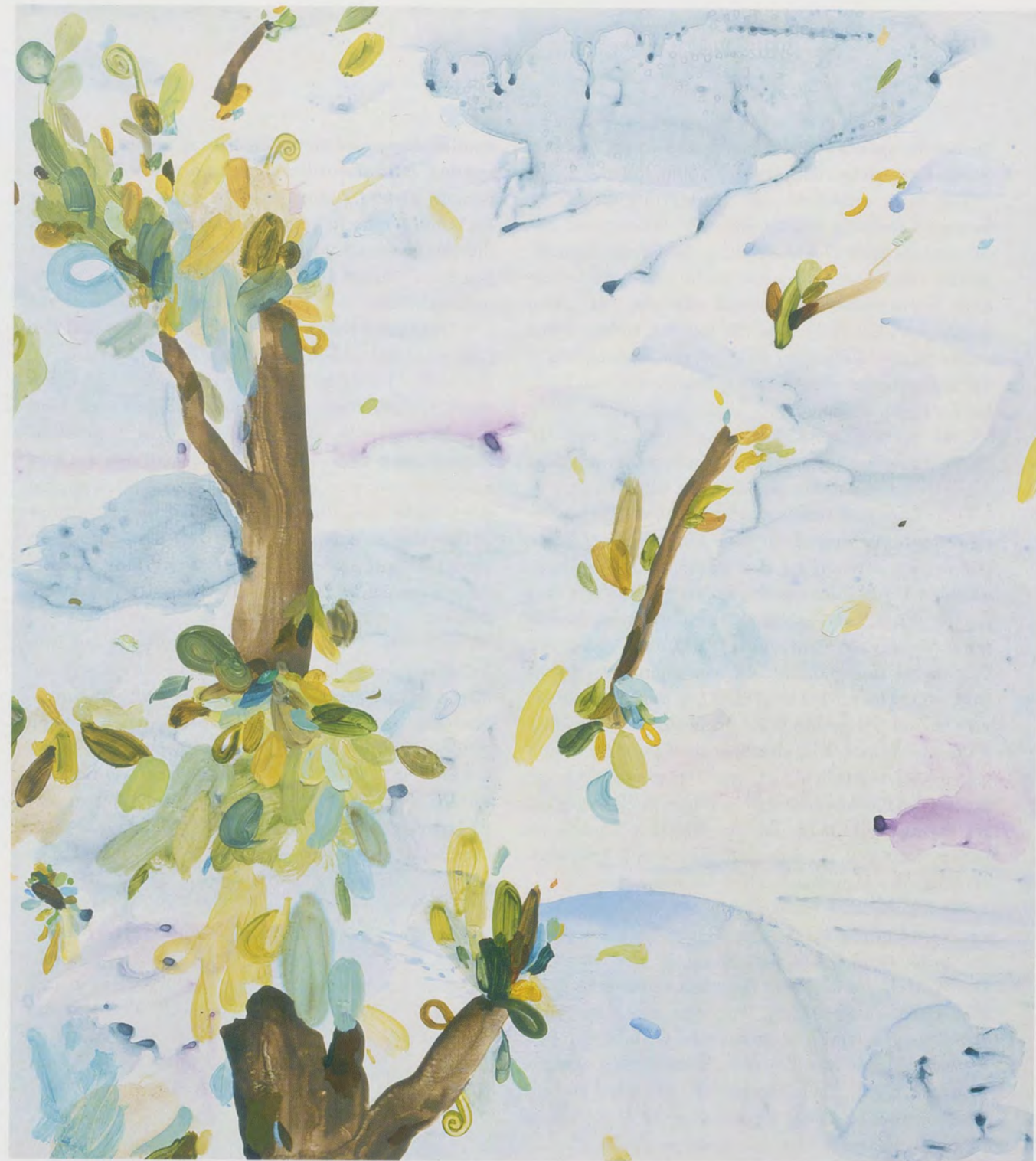
LAURA OWENS, UNTITLED, 2002, oil and acrylic on linen, 54 x 48" / OHNE TITEL, Öl und Acryl auf Leinen, 137,2 x 122 cm.