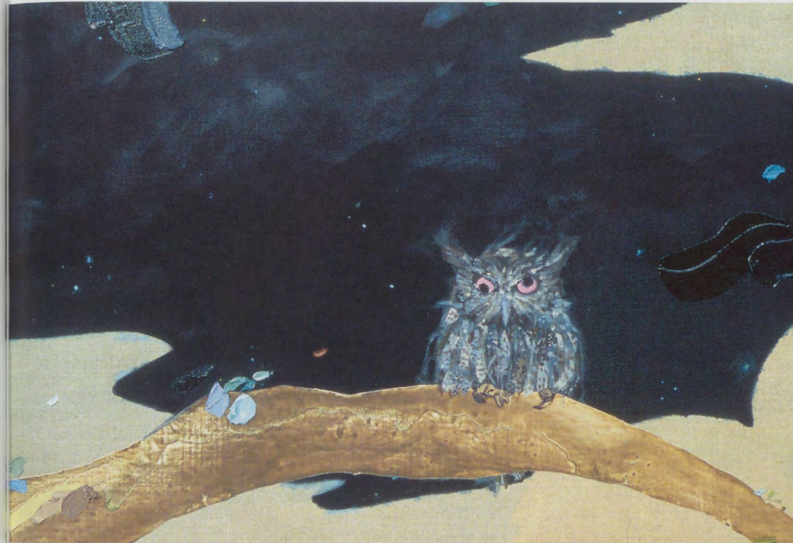
LAURA OWENS, UNTITLED, 2002, oil and acrylic on linen, 84 x 132", detail; full image on preceding double page. / OHNE TITEL, 213 x 335 cm, Ausschnitt; ganzes Bild siehe vorangehende Doppelseite.

Harmony, in fact, is the real theme of the painting. It provides the motif: even when a monkey reaches for a butterfly, it is playful rather than predatory. And the same theme pervades the construction of the composition in which each of the many animals has a certain independence: none dominates. The largest animals—a monkey and a bear—are discreetly half-hidden behind a tree trunk. The trees themselves are dispersed across the canvas so that they leave the visual frame on all sides, while a single trunk arches ambiguously into the relatively empty space at the upper right. Empty space is as important