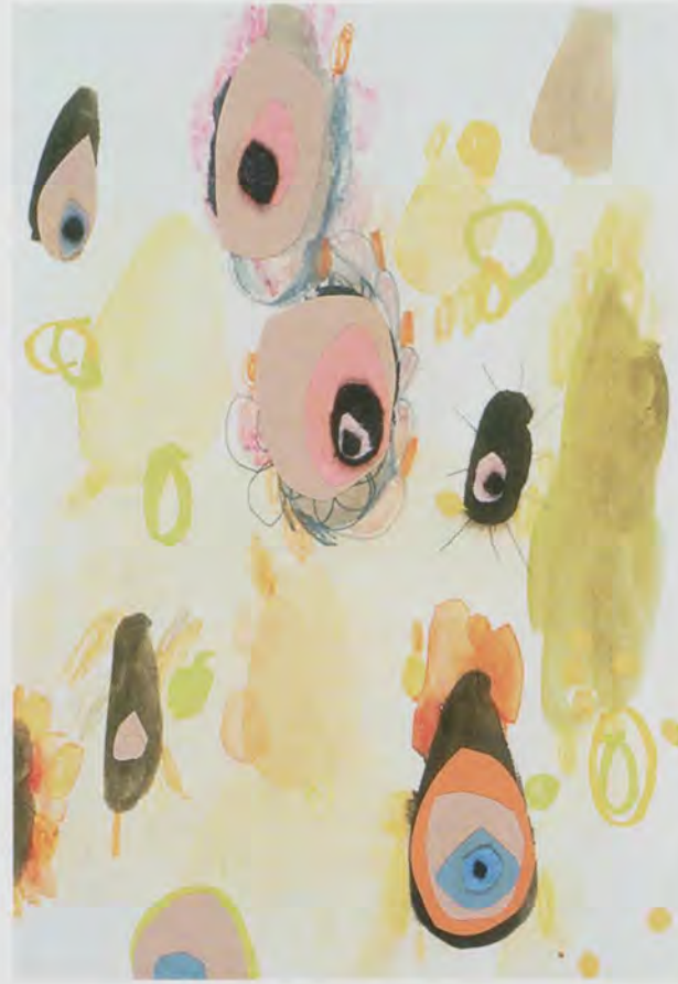
LAURA OWENS, UNTITLED, 2000, collage, watercolor, and pencil on colored paper, 10 x 7" / OHNE TITEL, Collage, Wasserfarbe und Farbstift auf farbigem Papier, 25,4 x 17,8 cm.

By wetting the canvas before applying the ink, she can achieve a satisfactorily fuzzy, furry edge to the silhouette. She's been painting monkeys for about three years now. They derive from those of the anonymous eleventh-century Chinese painter known as the Gibbon Master, in particular his MONKEYS IN A LOQUAT TREE , a large hanging scroll that belongs to the Palace Museum in Taipei. Chinese painting is clearly important to Owens, not just for particular models such as the monkey, but more broadly for its ability to create depth out of flatness, and for the alternative it provides to Western perspectival systems.