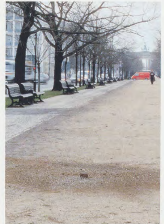
ANDREAS SLOMINSKI, BAUMSTUMPF, 1998, Deutsche Guggenheim, Berlin / TREE STUMP.