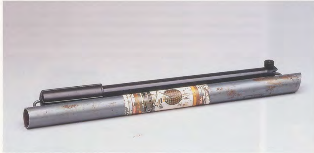
ANDREAS SLOMINSKI, GESTOHLENE LUFTPUMPE, 1998 / STOLEN BICYCLE PUMP, Deutsche Guggenheim, Berlin.